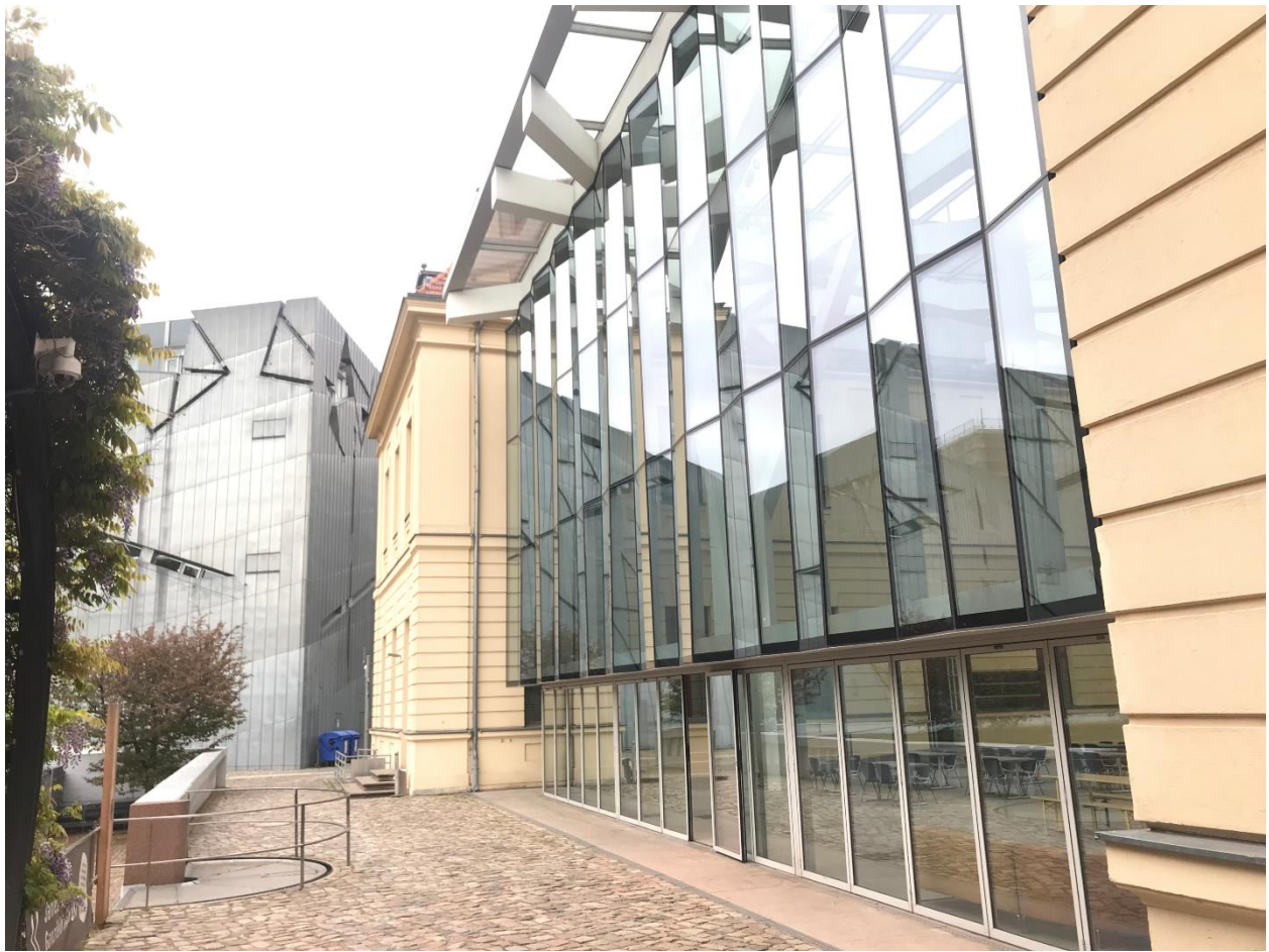
Şekil 3. Collegienhaus Binası ve Daniel Libeskind'in sıra dışı çağdaş eki

Günümüzde görülebilen Collegienhaus'un klasik barok taş cephesiyle keskin bir tezat oluşturan Daniel Libeskind'in sıra dışı ek yapısı, parlak titanyum-çinko kaplaması ve açılı duvarlarıyla zikzaklı bir form sergiler (Şekil 3). İki yapı, mimari açıdan birbirinden tamamen farklı bileşenlere sahiptir. Libeskind'in tasarımı, tarihi yapıyı ikincil ve önemsiz kılacak kadar karmaşık ve çarpıcı görünse de aslında Berlin'deki Alman ve Yahudi tarihleri arasındaki karmaşık ilişkiyi ve ayrılmaz kimlikleri sembolize eder.