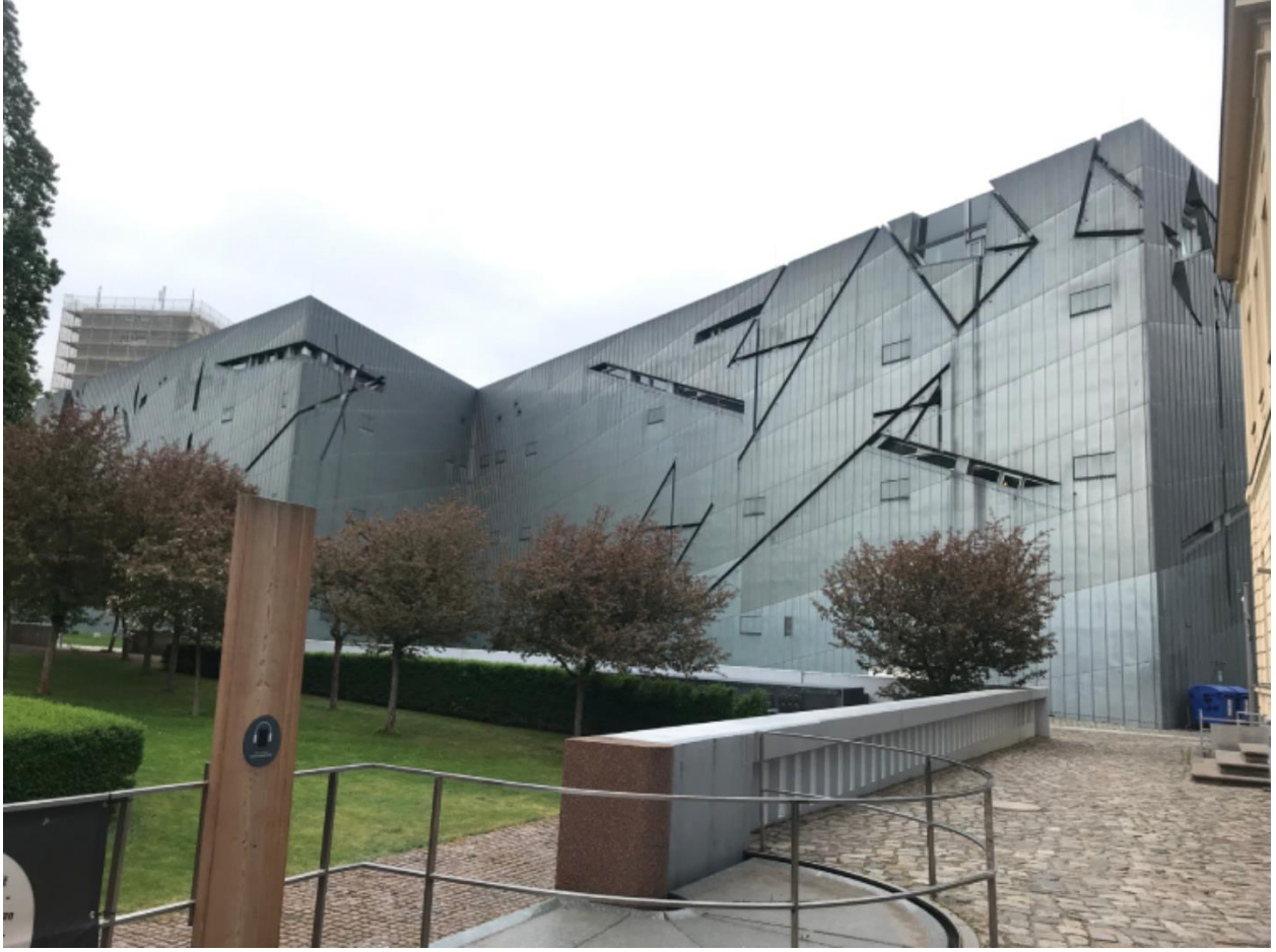
Şekil 4. Libeskind'in sıra dışı ekin cephesi

Libeskind'in sıra dışı tasarımı, Yahudi ve Alman tarihinin fiziksel ve ruhsal bütünleşmesini vurgulayarak, 20. yüzyılın başlarında Almanya'da egemen olan şiddetli kültürel bölünme politikasının bir reddini oluşturur (Mason ve Sayner, 2019). Yapının formu ve mekânsal düzeni, ziyaretçilere tarihsel travmanın ve hafızanın mekânsal bir deneyimini sunar. Özellikle müzenin içinde yer alan dar ve karanlık koridorlar, soykırımın yarattığı boşluğu ve kaybı sembolize eder (Till, 2005).