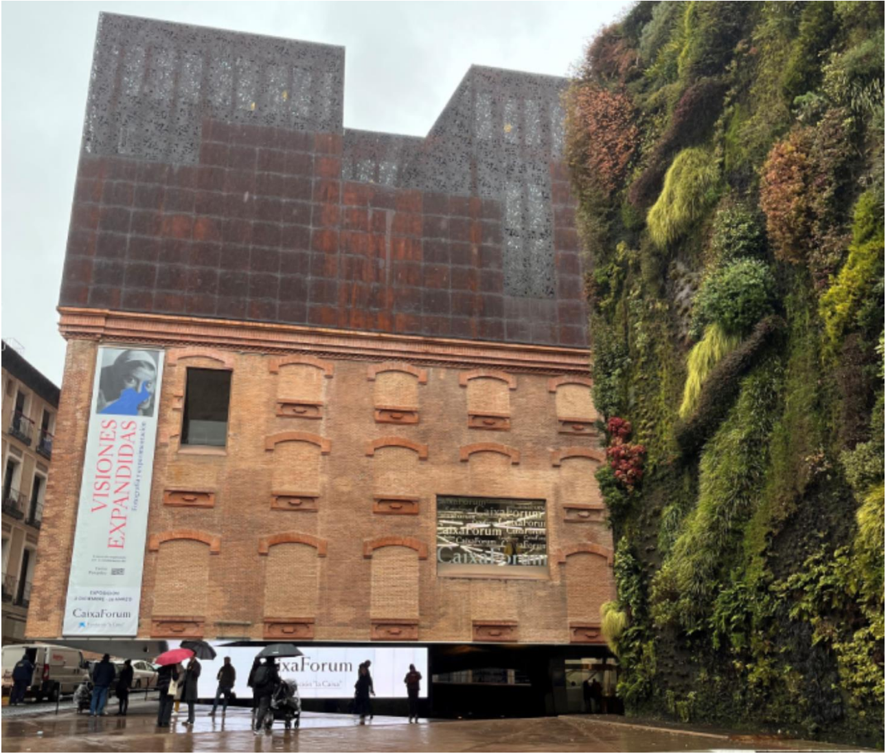
Şekil 5. Mediodia Elektrik Santrali ve Herzog & de Meuron'un sıra dışı çağdaş eki

Yapının en dikkat çekici özelliklerinden biri, zemin katın tamamen kaldırılarak binanın zeminden yükseltilmiş bir şekilde asılı durmasıdır (Şekil 6). Bu tasarım kararı, ziyaretçilere binanın altında kamusal bir alan sunarken, yapıya heykelsi bir nitelik kazandırır. Yerçekimine meydan okuyan bu yapı, boşlukta duran bir kütle olarak algılanır ve kent silüetinde güçlü bir varlık oluşturur. Tasarım, çevredeki sokakların darlığı ve ana girişin yerleşimi gibi sorunları ele alarak çözmüştür.