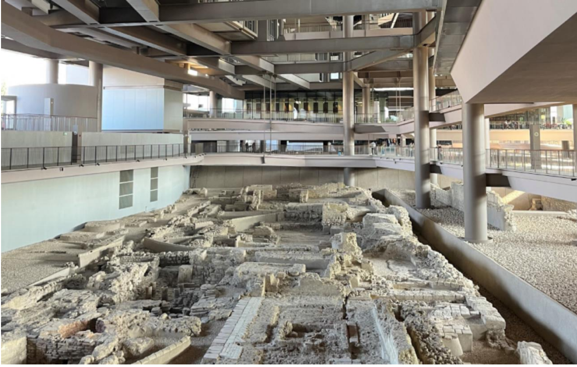
Şekil 7. The Museum Hotel Antakya'nın müze alanı

Arkeolojik buluntuların varlığı, bölgede ek yapı yapılmasını zorlaştırmış; ancak mimar bu duruma çözüm olarak, arkeolojik eserlerin sergileneceği bir halk müzesinin ek yapıya entegre edilmesi fikrini ortaya atmıştır. Bu cesur ve yenilikçi yaklaşım, projenin hem mimari hem de kültürel değerini artırmıştır. Otel tasarımında genellikle zemin katta yer alan balo salonu, yüzme havuzu ve konferans salonları gibi ortak alanlar, bu projede çatı katına yerleştirilmiştir. Müzedeki sirkülasyon ağı, arkeolojik buluntuların konumuna göre düzenlenmiştir. Buluntuların yaklaşık 15 metre yukarısında çelik kirişli bir ızgara sistemi inşa edilerek, otel oda modülleri bu ızgara sistemi üzerine yerleştirilmiştir (Şekil 8).