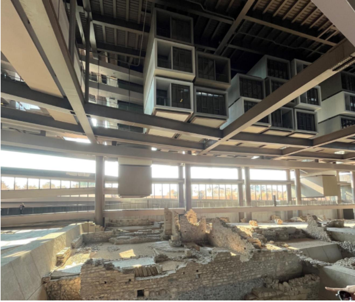
Şekil 8. Müze alanının üstündeki otel odaları (Kişisel arşiv, 2022)

Mekânın tasarımı, ziyaretçilerin algılarını sürekli olarak şaşırtarak, beklenmedik görüş açıları ve perspektifler sunar. Otel odalarına ulaşmak için kullanılan koridorlar ve geçiş alanları, aşağıdaki arkeolojik buluntulara görsel bağlantılar sağlar. Bu sayede misafirler, geçmişle sürekli bir görsel ve duygusal bağ kurarlar. Otel odalarının tasarımında kullanılan doğal malzemeler ve sade çizgiler, dikkatleri otel odalarından da görülebilen arkeolojik mirasa yönlendirir.