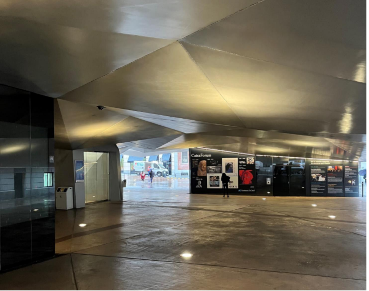
Şekil 6. CaixaForum Madrid'in zemin katı

Eski ve yeni malzemeler arasındaki diyalog, binanın cephelerinde açıkça görülür. Tarihi fabrikanın masif tuğla cepheleri ile yeni eklenen korten çelik kaplamaları, dokusal ve renkli bir kontrast yaratarak görsel bir etki oluşturur (Plevoets, 2021). Korten çeliğin zamanla değişen yüzeyi, yapının yaşlanma sürecini ve tarihsel katmanlaşmayı sembolize eder. Bu şekilde, mimarlar hem geçmişin hem de çağdaşın bir arada bulunabileceği bir mekân yaratmışlardır.