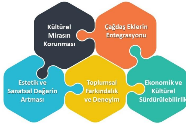
Şekil 9. Sıra dışı çağdaş eklerin tarihi çevrelerdeki rolü

Sıra dışı çağdaş ekler, kültürel mirasın korunması ve çağdaş mimarlığın entegrasyonu açısından önemli fırsatlar sunmaktadır (Şekil 9). Bu ekler, tarihi yapının değerini ve görünürlüğünü artırırken, ziyaretçilere yeni deneyimler sunmaktadır. Ayrıca, kentlerin ekonomik ve kültürel sürdürülebilirliğine katkı sağlamaktadırlar (Heidenreich ve Plaza, 2015).