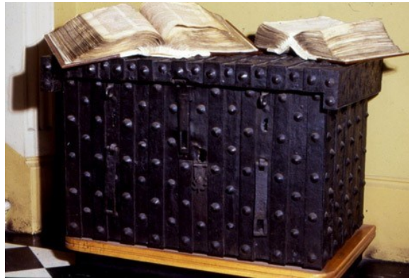
Resim 1. Domesday Kitabının yaklaşık 1600 yılından itibaren saklandığı üç farklı kilitle sabitlenmiş, kasalı, astarlı ve demirle bağlanmış tahta sandık. Katalog referansı: E 31/4

Domesday , ilk başlarda Winchester'daki kraliyet hazinesinde bulunduruluyordu. Ancak 13. yüzyılın başlarından itibaren, kral, seyahatlerinde yanında götürmediği zamanlarda, Westminster'da sarayda ya da manastırda bulunduruluyordu (Hallam, 1986: 55). Yaklaşık 1600 yılından itibaren büyük bir demir sandıkta muhafaza edildi. Sandık, üç farklı kilide sahipti ve anahtarları üç farklı görevliye teslim edilmişti, böylece yalnızca üçünün de rızası ile açılabilirdi (Birch, 1887:28). 1859'da Domesday , Londra'daki Chancery Lane'deki yeni Kamu Kayıtları Ofisine alındı. Şu an ise Londra, Kew'deki Ulusal Arşivlerde saklanmaktadır.