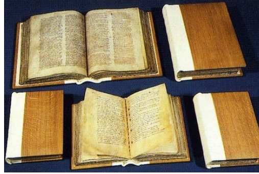
Resim 2. Great ve Little Domesday Book bugün beş bölüme ayrılmıştır: İki (yukarıda) Great Domesday için ve üçü (aşağıda) Little Domesday için; Katalog referansı: E 31/2 / 1-2 ve E 31/1 / 1-3

Domesday Book , İngiltere'nin neredeyse tamamını içermektedir ve içinde 13.000'den fazla yerden bahsedilmektedir (Betlehem, 2009: 4). Londra, Winchester, Durham ve Northumberland, William'ın bu araştırmasına dahil edilmedi. Günümüzde beş bölüme ayrılmış olan bu ciltler, Kew'deki Ulusal Arşivlerde, İngiliz kamu kayıtları arasında en eski ve en değerli olarak korunmaktadır.