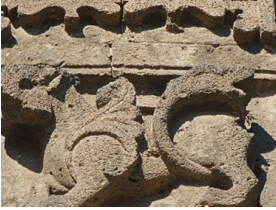
Şekil 7. Ejder. (Değertekin, 2003)

Ejderha: Çift ejder Urfa Kapısı'nın dış yüzeyindeki kitabenin kenarlarında karşılıklı olarak kullanılmıştır. Ejder figürünün oluşturulmasında, temel çıkış noktasının yılan olduğu düşünülmektedir. Ejder figürü gökyüzü ve kainat, karanlık ve kötülükle mücadele ve gezegen sembolizmi gibi bir çok anlamda kullanılmıştır (Çoruhlu, 1995).