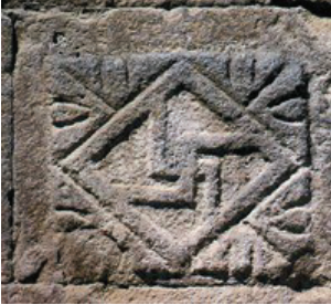
Şekil 9. Gamalı haç. (Değertekin, 2003)

Gamalı Haç Motifi (Çarkı Felek): Surların üzerinde hıristiyanlık dönemine ait, uluslararası adı svastikaolan, gamalı haç,(çarkı felek) motifi bulunmaktadır. Kelime olarak sanskritçe'de "mutluluk getiren" anlamına gelir. Sembol olarak da güneş çarkı anlamına gelmektedir ( http://www.ihlsozluk.com/nedir.php?&q=swastika ). Hristiyanlıkta svastika haçın çengelli versiyonu olarak düşünülür. Svastika sembolü, İslam sanatlarında da görülmektedir.