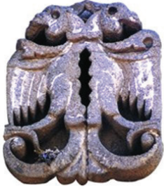
Şekil 6. Çift başlı kartal. (Değertekin, 2003)

üst düzey toplantılarda ortada hükümdar iki yanında da simetrik düzen içinde diğer kişiler yer almaktadır. Diyarbakır surlarında da merkezde görmeye alıştığımız hükümdarın yerini, onun simgesi durumundaki kartal figürü almıştır.