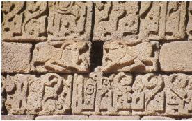
Şekil 5. Keçi figürü. (Değertekin, 2003)

Keçi: Diyarbakır surlarında yer alan keçi benzeri figürler doğadaki görünülerinden uzak, üsluba çekilmiş olarak betimlenmiştir. Örneğin Dağkapı'da yer alan keçi figürlerinin hilal biçimli boynuzları boğayı andırmaktadır. Ayrıca boyun kısmında hiçbir hayvan türüne benzemeyen bir şişkinlik bulunmaktadır