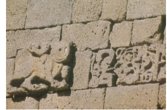
Şekil 3. Aslan figürü. (Değertekin, 2003)

Surlarda yer alan aslan kabartmaları aynı zamanda koruyucu nitelikleriyle birer bekçi hayvan konumundadır (Baş, 2006). Aslan ayrıca Hz. Ali'nin de sembolüdür. Lakabı Haydar, sanı Esedullah'tır (Allah'ın aslanı).