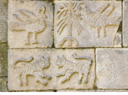
Şekil 4. Kuşlar ve hayat ağacı. (Değertekin, 2003)

almaktadır. Benzer şekildeki kuşlar Nur ve Melikşah burçlarında da görülmektedir (Baş, 2006).