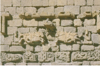
Şekil 2. At figürleri. (Değertekin, 2003)

At: Surlarda at betimlemesine Nur Burcu'nda rastlanmaktadır. Simetrik ve karşılıklı koşan atlar kabartma şeklinde yandan gösterilmiştir. Koşum takımları vardır ve kuyrukları düğümlüdür.