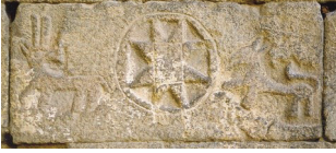
Şekil 8. Yıldız motifi. (Değertekin, 2003)

Yıldız: Yıldız motifi tüm kültürlerde görülmüş yaygın bir geometrik motiftir; çünkügeometrik oluşturulabilirliği yüksektir. İki üçgen birleştiğinde ya da dairenin bölünmesinin aşamalarında rahatlıkla elde edilebilmektedir. Genellikle merkezleri aynı olan üçgenlerin birleşimi ile oluşturulmuştur.