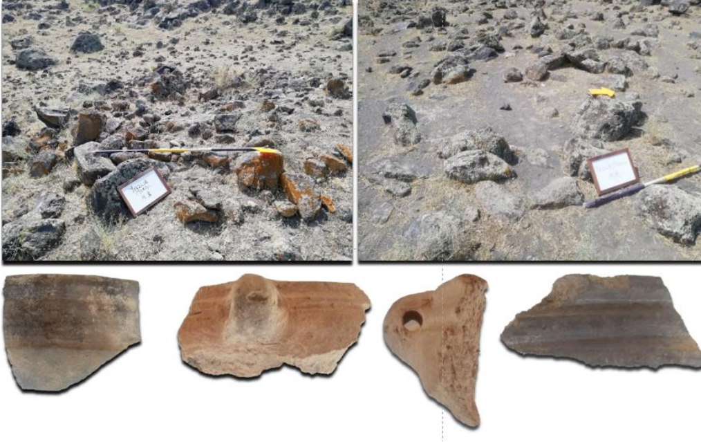
Res. 3: Bulakbaşı 8 Yerleşmesi kurganları ve seramikleri

açılardan uyumlu oldukları görülmüştür. 15 Seramikler, Urartu öncesi Demir Çağı'na tarihlenmiştir. Urartu yazıtlarında da bölgede Erikua Krallığı'ndan bahsediliyor olmasından yola çıkılarak bu tür merkezler Erikua Krallığı'na tarihlendirilmektedir. Bölgede sürdürdüğümüz araştırmalarda kurgan kullanımının Urartu Krallığı sürecinde sonlandığı düşünülmektedir. Kalus kurganlarında K1 numaralı kurganda Urartu seramiklerine rastlanmıştır. 16 Ancak bu oldukça sınırlı bir örnek olarak kayıt altına alınmıştır. Bölge; Urartu egemenliğine girmiş olmasına rağmen, bölgede kurgan geleneğinin yerel bir alışkanlık olarak bir süre daha devam ettiği anlaşılmaktadır.