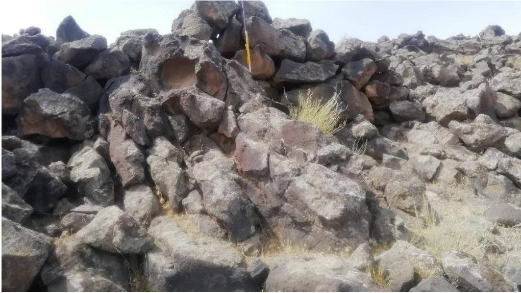
Res. 1: Bulakbaşı 8 Yerleşmesi savunma duvarları

mezarlık alanının sonlandığı doğu kısımda olup farklı bir tipolojidedir. Buradaki su sistemi kaynak suya ve burada bulunan Karasu Deresi'ne ulaşmak için tasarlanmış olup, burada bulunan kayalık alan kesilerek bir koridor elde edilmiş ve su kaynaklarına ulaşım kolaylaştırılmıştır. 4 Iğdır bölgesinde mezarlığa sahip yerleşim yeri olarak tanımladığımız ve kendi kendine yeter ekonomik sisteme sahip başka merkezler de bulunmaktadır. Bu merkezler; Karakoyunlu Erikua Yerleşmesi 5 ile Melekli'de bulunan Gelinciktepe, Örgülütepe, Kasımtığı, 6 Çilli'deki Luhiun 7 Doğubayazıt bölgesinde Balık Gölü Yerleşmesi'dir. 8 Bulakbaşı 8 ile beraber bu merkezler; yerleşmenin büyüklüğü, yapısal özellikleri, planı, yerleşme inşasında kullanılan taşların büyüklüğü, yerleşmede tespit edilen seramikler ve benimsenen ölü gömme geleneği açısından, Urartu'nun yazıtlarda 9 belirttiği Erikua Krallığı'na işaret etmektedir.