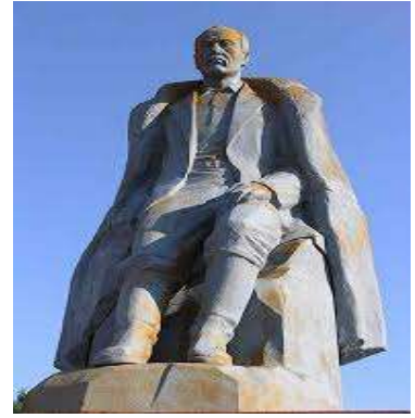
Gorno-Altaysk'taki G.İ. Çoros-Gurkin Anıtı

Gurkin'in eserlerinin önemli bir kısmının muhafaza edildiği Gorno-Altaysk'taki ulusal müzedekilerin restorasyonu ile ilgili 1960'lı yıllarda çalışmalara başlanmış ve 1988 yılına kadar 190 eseri restore edilmiştir (Erkinova 2020: 15). Sanatçının aklanmasını takip eden yıllarda hakkında bilimsel çalışmaların yapma ve eserlerini restore etme sürecinin başlaması ve bunların SSCB döneminde gerçekleşmesi Gurkin'in sanatsal gücünü göstermesi bakımından önemlidir. 1991 yılında SSCB'nin dağılmasıyla birlikte Gurkin hakkında yapılan her türlü çalışmanın sayısı artık binleri aşmış durumdadır. Bu durum Altay Türklerinin Gurkin'e ve onun düşüncelerine duyduğu ihtiyacın da göstergesidir aynı zamanda. Ocak 1991'de, doğduğu yer olan Gorno-Altaysk'ta ve yine aynı yıl çalışmalarının önemli bir kısmını