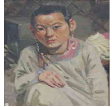
Tıva Kızı (1920)

Zorlu bir yolculuktan sonra ulaştığı Moğolistan ve Tıva'da kaldığı zaman içinde Altay'a duyduğu özleme rağmen sanatı bakımından verimli zamanlar geçirir. Anavatanından ayrılığı neredeyse 6 yıl süren (1919–1925) Gurkin, bu yıllarda yine çok çalışmış, manzaralar, portreler çizmiş, Moğolistan ve Tıva'nın doğasının karakteristik özelliklerini kalem ve boyayla resme aktarma çabası içinde olmuştur. Bu süre içinde Tıva yönetimi tarafından görevlendirilerek halk yaşamından sahneleri tasvir eden manzaralarla etnografik çizimler yapmıştır. Zorunlu göçünün ilk dönemini Moğolistan'da geçirmiş, Eylül 1921'de Moğolistan topraklarına baskın düzenleyen Tıva partizanlarının ünlü lideri Sergey Koçetov'un bir müfrezesiyle birlikte Moğolistan'dan