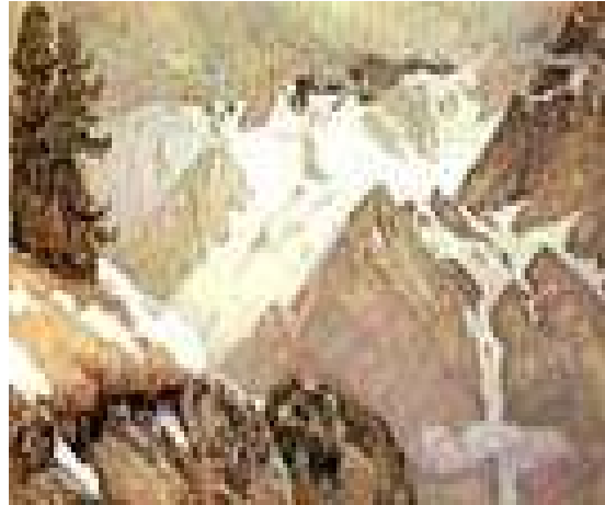
HAN ALTAY (1936)