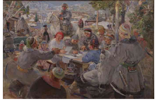
Anos'ta kolhoz çiftçilerinin buluşması (1936)

Gurkin'in resimlerinin bir diğer özelliği kendisinin de çağdaşı olduğu sosyo-politik olayların kroniği niteliği taşımasıdır (Tadışeva 2020: 45). Tanna Tıva ve Moğolistan'dan döndükten sonra yaptığı resimlerin adlarına ("Oyrotya, Lenin'in Yolu ve Mirası", "Dağlardaki Partizanlar", "Kolektif Çiftçiler" ...) bakarak Sovyet sistemiyle barışık yaşama isteğinde olduğu tahmin edilebilir. Kendisine verilen siparişler de dikkate alındığında anlaşılan o ki Sovyet sistemi de onun sanatından faydalanmak niyetindedir. Bu amaçla 1936 yılında Sovyet Sanatçılar Birliği tarafından Oyrot Özerk Bölgesi'nin kuruluşunun 15. yıldönümü dolayısıyla ve tarım sergisi için bir dizi resim yapmakla görevlendirilir. O, sipariş edilen resimleri yapmakla uğraşırken 11 Ekim 1937'de 67 yaşındayken "Büyük Terör" döneminde hayatı ve çalışmaları yarıda kesilir, devrim sonrası ilk yıllarına dair "hayalleri" affedilmez ve "halk düşmanı" olarak suçlanıp infaz edilerek sanatı ve ona ait her şey yasaklanır (Erkinova-Şastina 2020: 24-39).