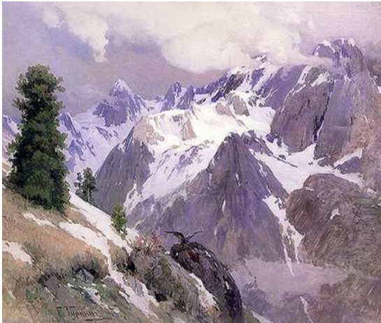
HAN ALTAY (1907)