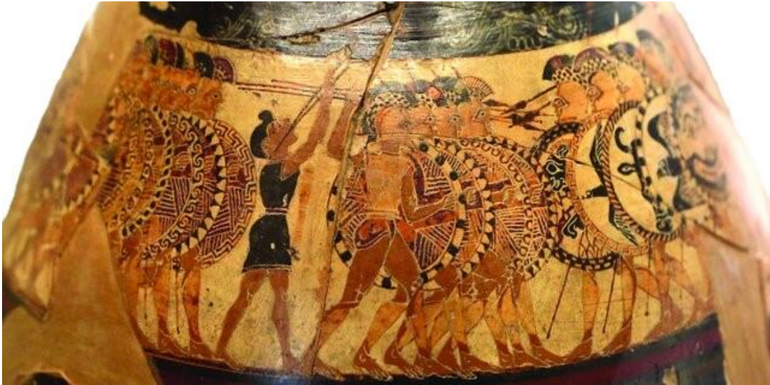
Fotoğraf 1. Chigi Vazosu üzerinde uygun adım yürütmesi için askerlere eşlik eden bir aulos icracısı (Lynch, 2022: Fig.1).

İfade edildiği gibi Spartalılar da askerlerin ahengini sağlamak amacıyla aulos adlı enstrümandan faydalanmışlardır. Antikçağda Hellen toplumunda ordunun senkronize hareket edebilmesi son derece önemlidir. Zira hoplites adlı askerlerden oluşan askeri sistemde, ancak hoplites lerin saflar halinde dizilmesi ve senkronize hareket etmesi başarıyı getirebilirdi. Safların bozulması, askeri dizilişte boşluklar yaratabilir, bu boşluklardan sızan düşmanlar orduya büyük zayıflar verebilirdi (Chrissanthos, 2008: 34). Bu bağlamda savaş meydanlarında ordudaki nizamın sağlanması için müzik olmazsa olmaz kabul edilmiştir.