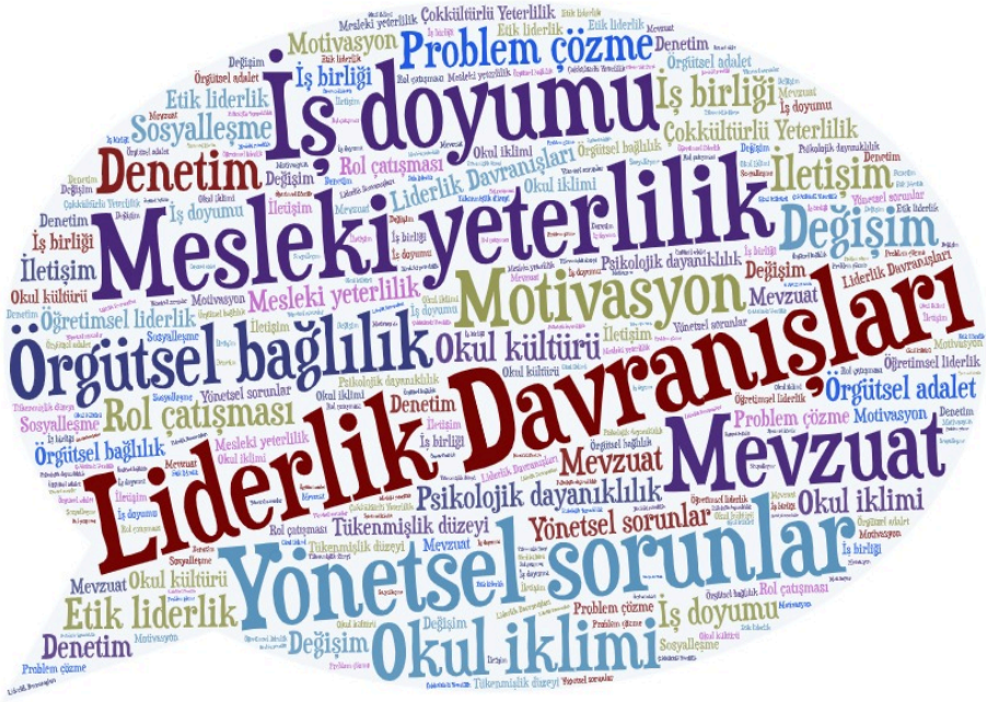
Şekil 1. Lisansüstü tezlerde ele alınan konuların kelime bulutu

Şekil 1'de görüldüğü üzere, özel eğitim okul yöneticileriyle ilgili yapılan lisansüstü araştırmalarda en sık ele alınan kavram, "liderlik davranışları" olmuştur (f15). Bununla birlikte, bazı lisansüstü tezlerde "mesleki yeterlilik"(f5), "yönetimsel sorunlar"(f5), "iş doyumu"(f4), "Örgütsel bağlılık"(f4), ve "mevzuat"(f3) gibi değişkenlerin de yoğun bir şekilde incelendiği görülmektedir. Tablo 3 ise, yapılan lisansüstü tezlerin amaçlarını detaylı bir şekilde incelemektedir.