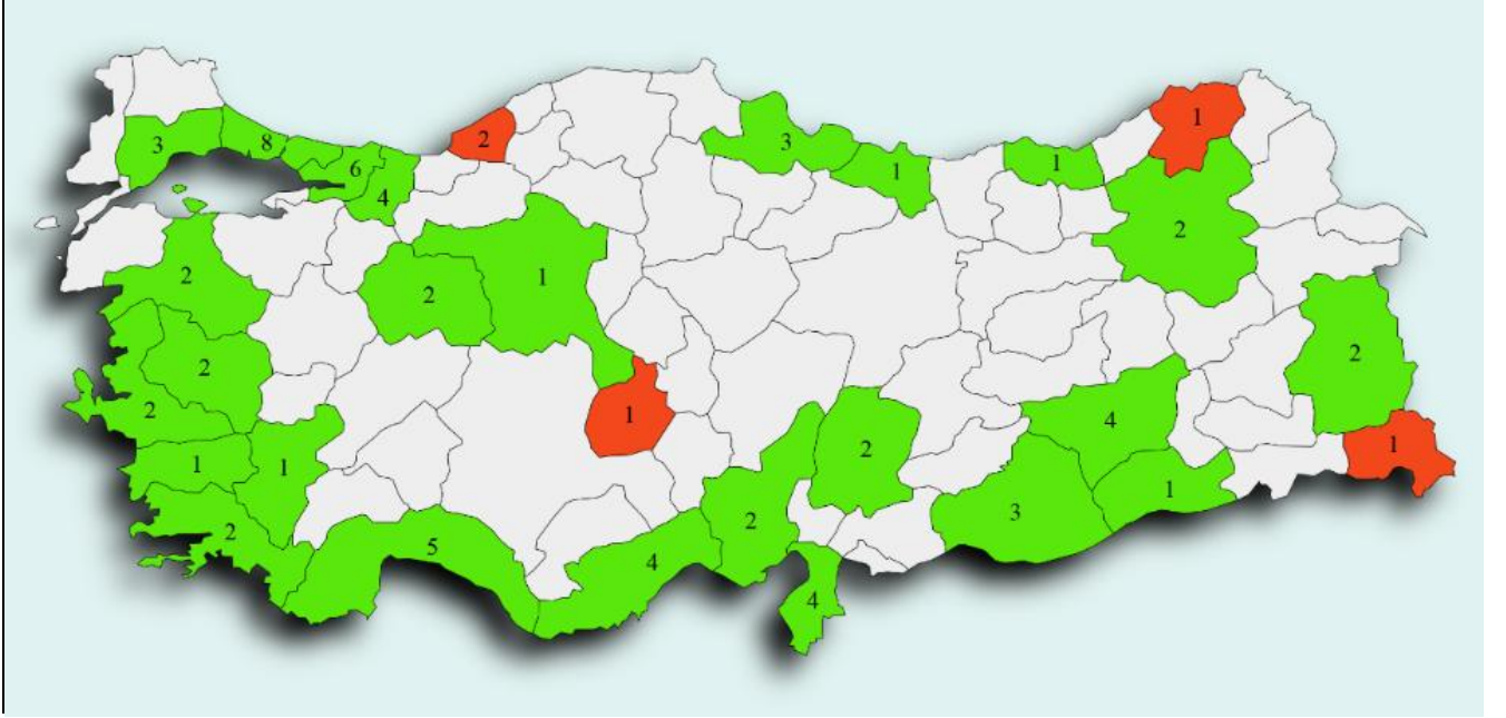
Harita 1. AK Parti Döneminde Yeni Kurulan İlçelerin Büyükşehir ve Diğer İllere Dağılımı

Kurulan ilçe sayılarının iktidardaki süreye bölünmesiyle elde edilen yılbaşına düşen yeni ilçe sayısına bakıldığında ANAP döneminin "31,88", DP döneminin ise "14,10"luk bir ortalamaya sahip olduğu görülmektedir. Buna karşın AK Parti döneminde söz konusu ortalamanın "3,48" olduğu tespit edilmiştir. Özetle, cumhuriyet tarihindeki tek başına iktidar dönemleri arasında mülki idare düzenlemelerine en az yer verilen dönem AK Parti iktidarıdır.