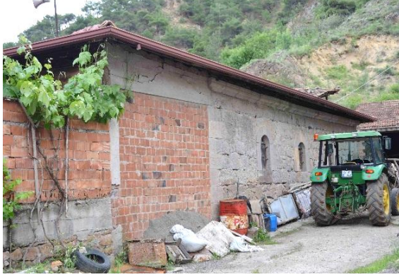
Şekil 3: Cami Batı Cephesi, 2023