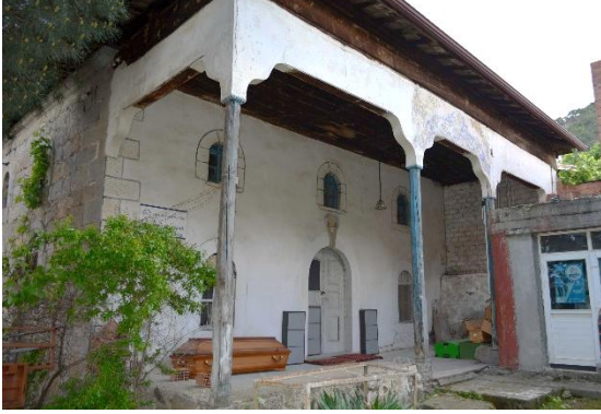
Şekil 1: Cami Kuzey Cephesi, 2023