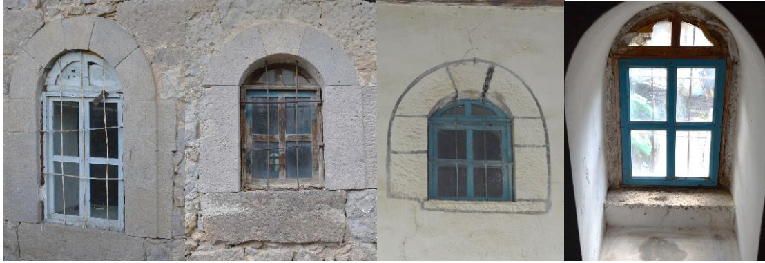
Şekil 7: Cami Pencere Tipleri, 2023

Camiye çift kanatlı sade bir kapıdan girilmektedir. Her bir kanadında üçer aynalığı bulunan kapı sonradan boyanmıştır. Kare planlı harim, düz ahşap tavanla örtülüdür (Şekil 8). Çatı duvarlar üzerine boydan boya atılan kalın ağaç kirişlerle taşınmaktadır. Kirişlerin altı tahta kaplanmıştır. Tahta kaplamanın birleşim yerlerine ince çiteler çakılmıştır. Harimi ve mahfili boydan boya kaplayan sade tavan, ortasındaki çita işi yedigen bir tavan göbeği ile hareketlenmektedir. Harim güney duvarının tam ortasında bulunan mihrap nişi sade olup oldukça dardır. Açıklığı yuvarlak kemerle geçilmiştir. Minber ise batı duvarına dayanmış, tamamen ahşaptan yapılmıştır. Yan aynalığı karelere bölünmüş tablalardan oluşmaktadır (Şekil 9). Camide vaaz kürsüsü bulunmamaktadır.