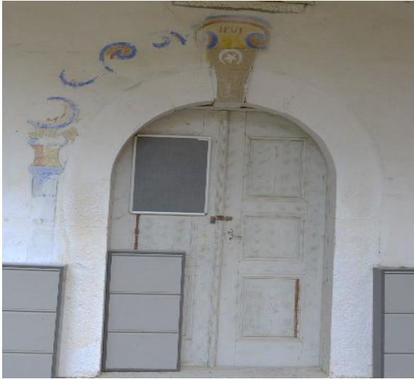
Şekil 16: Cami Kalem İşi Detay, 2023