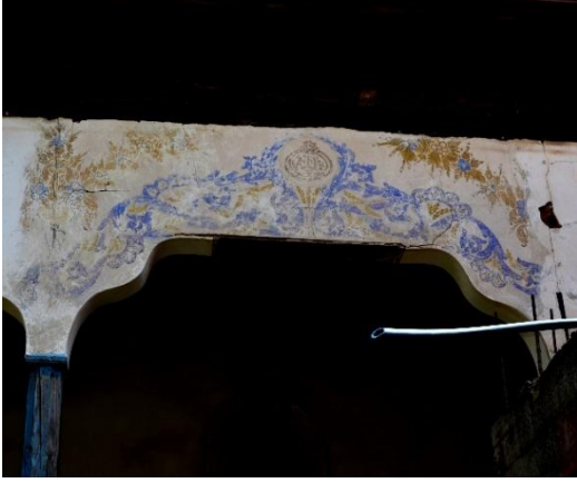
Şekil 12: Cami Son Cemaat Yeri Kalem İş, 2023