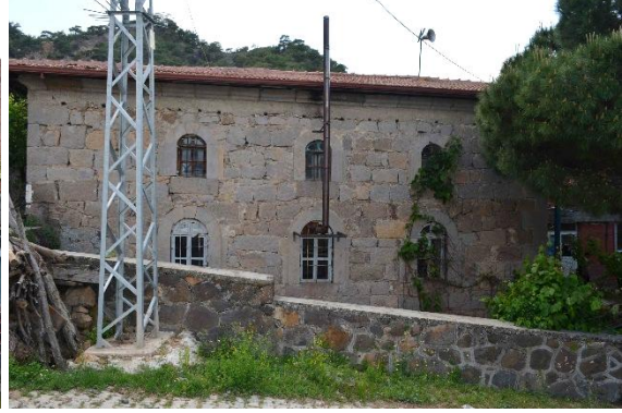
Şekil 2: Cami Doğu Cephesi, 2023