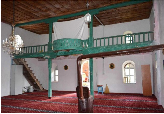
Şekil 10: Cami Ağaç Mahfil Katı, 2023