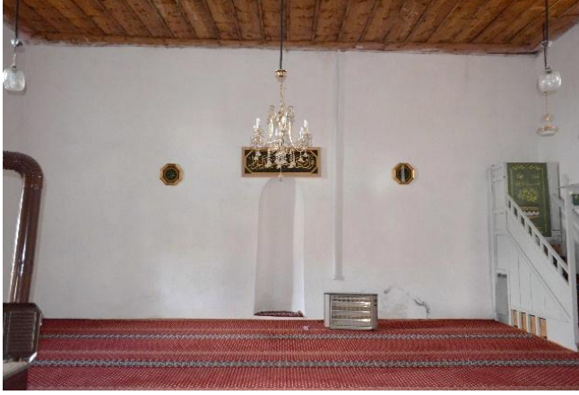
Şekil 8: Cami Harimi Mihrap ve Minber, 2023