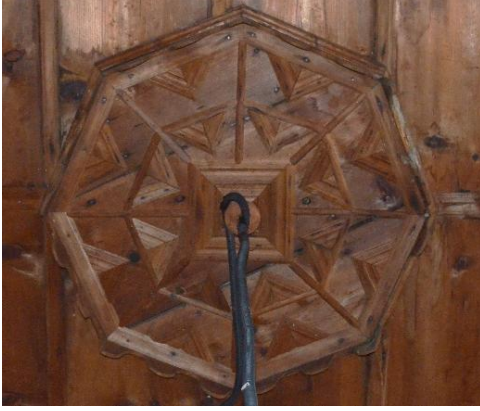
Şekil 18: Cami Harim Tavan Göbeği, 2023