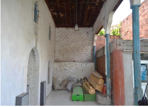
Şekil 5: Cami Son Cemaat Yeri, 2023