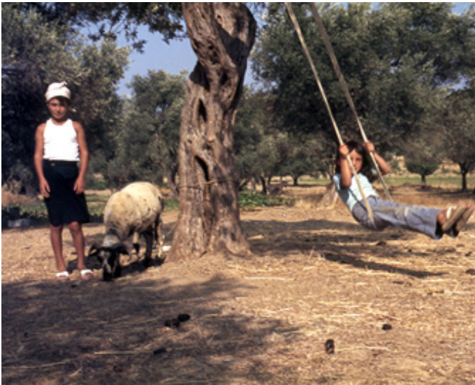
Figür 10. Müze'de "salıncak oyunu" ile ilgili sergilenen fotoğraflar