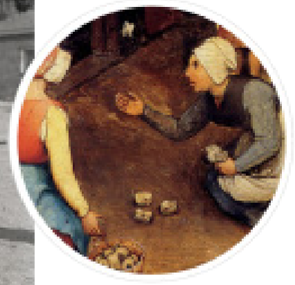
Figür 11. Musa Baran'ın 1970 yıllarında, Bademler Köyü'nde çekmiş olduğu "Aşık Oyunu" ve Hollandalı ressam Peter Brueghel'in tablosundan bir kesit (Fotoğraf: Bademler Kültür Sanat ve Eğitim Vakfı Arşivi)

Çocuklar yakın geçmiş ve Antik Çağ çocuk oyunlarının günümüze taşınması konusunda bilgilendirilmektedir. Müze, kültürel bir mirası korurken çocuklara bilgi kaynağı ve yetişkinlere de nostaljik bir gün geçirme imkanı sunmaktadır.