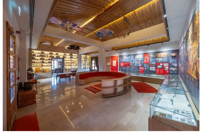
Figür 8. Musa Baran Çocuk Oyuncakları Müzesi

Köyü’ne aittir. Ege Bölgesi ve İzmir yöresinden de parçalar vardır. Ayrıca araştırma konusu olan oyunların Antik Çağ oyunları ile karşılaştırması panolar halinde sergilenmektedir.