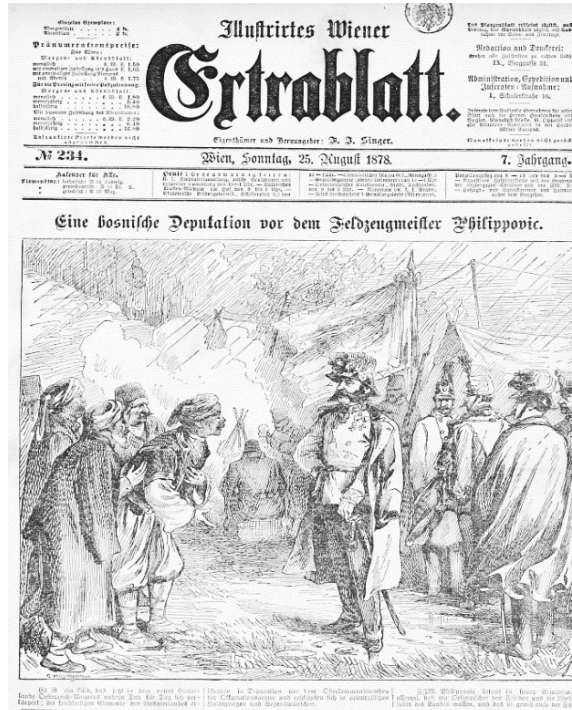
Resim 4. “Bir [Müslüman] Bosna Heyeti, İşgal Kuvvetleri Komutanı Philippoviç’in Huzurunda”, Illustriertes Wiener Extrablatt , 25 Ağustos 1878.