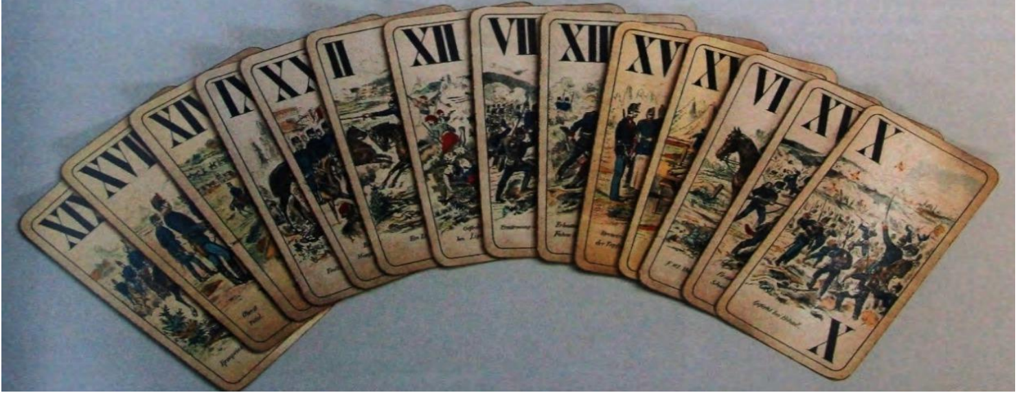
Resim 8. Avusturya-Macaristan'ın Bosna-Hersek'i 1878'deki işgal sahnelerini büyük bir kahramanlık ve zafer olarak yansıtan Viyana-Platnik İskambil fabrikası tarafından imal edilmiş Tarot Kartları.