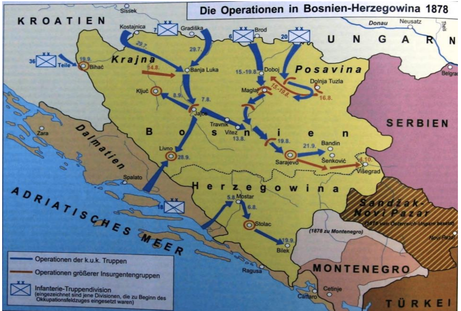
Resim 5. "1878 Bosna-Hersek'teki Operasyonlar"; Avusturya-Macaristan birliklerinin, 28 Temmuz 1878 itibariyle Macaristan, Hırvatistan ve Dalmaçya üzerinden Bosna-Hersek'e üç koldan düzenledikleri askeri operasyonu gösterir haritadır. (Neumayer & Schmid, 2008, s. 24).

Bu görüşmenin ertesi günü Hafız Paşanın, Bosna-Hersek Müslümanlarının temsilcilerinden İmam Kandiyâ, Hoca Jamakoviç ve Ortodoks esnaf Petraki ile görüşmesi hakkında bilgi veren Konsolos Wassisch, birlikte gelmelerine rağmen Müslüman temsilcilerle Ortodoks temsilci arasında fikir ayrılığı olduğuna dikkat çekmiştir. Hoca Jamakoviç'in konuşmasında "... Avusturya-Macaristan, bütün kanunlara aykırı bir şekilde, birliklerini Müslümanları soymak ve yok etmek için gönderiyor..." suçlamasını yönelttiğini belirtmiştir. Konsolos Wassisch ise, "...Avusturya-Macaristan, Avrupa'nın talebi ve Bab-ı Ali'nin onayıyla bu vilayetin iyiliği Bosna-Hersek'i işgal etmektedir..." ifadesiyle suçlamaları yalanlamış ve İmparator Franz I. Josef'in bildirisinin tam metnini toplantıda okutmuştur (Telegramm von Generalconsul, 1878, s. 4-5). (Resim 5).