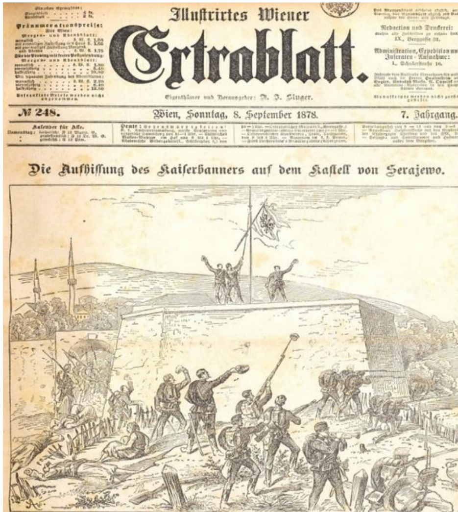
Resim 7. “[Avusturya-Macaristan] İmparatorluk Sancağı’nın Saraybosna Kalesinde Göndere Çekilmesi”, Illustrirtes Wiener Extrablatt , 8 Eylül 1878

Avusturya-Macaristan basınına ve diplomatik yazışmalarına yansıdığı şekilde bir anlaşmalı işgalden çok Bosna-Hersek’in Müslüman direnişçilerini şiddet kullanarak kontrol altına almak suretiyle “savaşla fetih hareketine” dönüşmüş olan Bosna-Hersek’in işgali Avusturya-Macaristan kamuoyunda o kadar çok popüler olmuştur ki, Die Vedette gazetesi, Avusturya-Macaristan bayrağının göndere çekildiği savaş meydanından zafer sahnesini ilk sayfasından yayınlamıştır (Aufhüllung des Kaiserbanners, 1878, s. 1). (Resim 7).