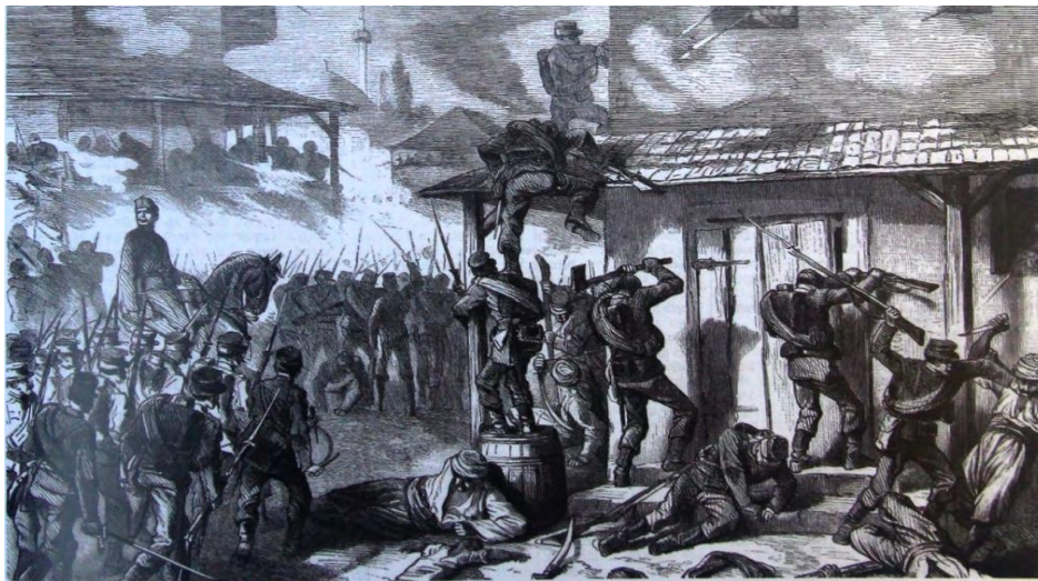
Resim 6. Christoph Neumayer; Erwin A. Schmidl, Des Kaisers Bosniaken-Die bosnisch-herzegowinischen Truppen in der k.u.k Armee-Geschichte und Uniformierung von 1878 bis 1918 , Verlag Militaria, Wien, 2008

19 Ağustos 1878'de, Müslüman direnişçilerle yaşadıkları sokak çatışmalarında çok sayıda kayıp verdikleri iddiasıyla, Avusturya işgal güçlerinin Müslümanların evlerine teker teker silahlı müdahalede bulunmak zorunda kaldıkları beyan edilmiş ve buna kanıt olarak da savaş ressamı tarafından çizilmiş kara kalem resim yayınlanmıştır (Neumayer & Schmidl, 2008, s. 29). (Resim 6).