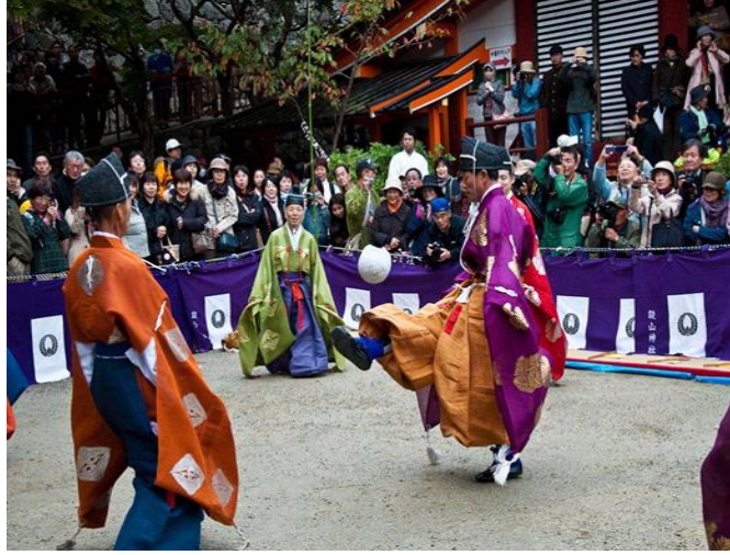
Resim 2: Kemari oyununu gösteren bir resim.

Resim 2’de, Kemari oynayan insanlar yer almaktadır.