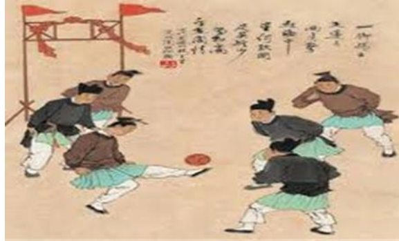
Resim 1: Cuju oyununu gösteren bir resim.

Resim 1'de, Cuju oynayan insanlar yer almaktadır.