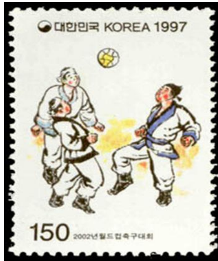
Resim 3: Ch’ukuk oyununu gösteren bir resim.

Resim 3’de, Ch’ukuk oynayan insanlar yer almaktadır.