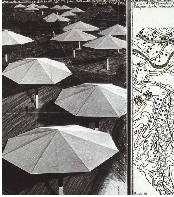
Tablo-4: Christo “Şemsiyeler Japonya-ABD” (“ The Umbrellas Japan-USA ”), 1987-91

Bulgar asıllı sanatçı Christo, bugüne kadar siyasal çağrışımları olan binaları paketleme (Reichstagsverhülun), Kaliforniya-Silikon Vadisi ile Japonya’da (Ibaraki’ye ve Satokava Irmağı kıyılarına) gerçekleştirdiği “ The Umbrellas Japan-USA ” adlı yerleştirmesi ve aynı biçimde Kaliforniya’da bir dağın yamaçlarına gerdiği 36 km. uzunluğundaki “ Running Fence ” (“ Boyluboyunca Giden Çit ”) konulu renkli kumaşla yaptığı enstalasyonu ya da bir adanın kıyılarını renkli naylon kumaşla kapladığı “ Floating Plastic Skirts ” ( Dalgalandan Plastik Etek ) gibi büyük boyutlu, “site specific” (yere özgü) türünden kavramsal “çevre” projeleriyle bu alanda belli bir ilgi alanı oluşturan önemli sanatçılardan biridir. Christo, proje giderlerini, çalışmalarıyla ilgili karakalem eskizlerini satarak karşılamaktadır.