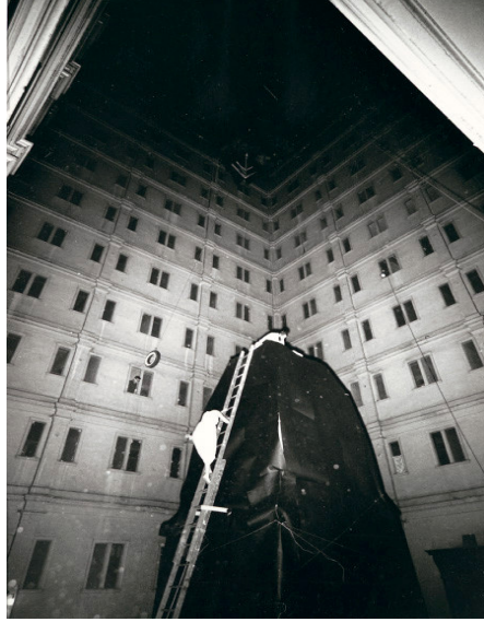
Tablo-1: Alan Kaprow, “Avlu” ( The Courtyard ), 1962

saygınlığı giderek artmıştır. İşte bu noktadan sonra, izleyici ile kavramsal sanat arasındaki ilişkiler giderek daha da belirginleşmektedir. Çünkü burada, popüler olmayan özgün düşünce öne çıkmakta; düşüncenin düşüncesi önem kazanmaktadır. Bir başka deyişle 'idea' nın ilk 'idea'sı ya da düşüncenin ilk düşüncesi sanatın konu maddesi olmaya başlamıştır” (Wilson, 81: XIII).