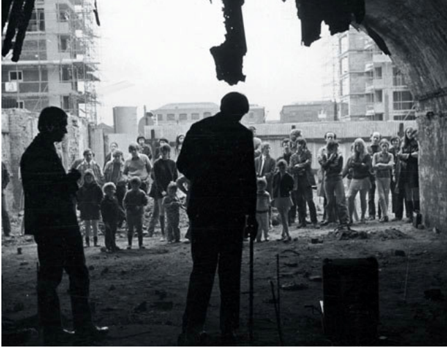
Tablo-3: Gilbert & George , “Şarkı Söyleyen Heykeller”(The Singing Sculpture) Cable Caddesi, Londra, 1988

Yaptığı performansların birçoğu, Stuart Brisley’inkilerden daha risklidir. Beuys, 1965’de “24 Saat” konulu çalışmasında, kolları gerilmiş olduğu halde bir platform üzerinde 24 saat durmuştur; ancak bu tür etkinliklerin izleyici üzerinde yarattığı dolayimli etkilerden pek tatmin olmadığı için, 1967’de radikal, fakat hiçbir partiye bağımlı olmayan siyasi bir organizasyon oluşturmuştur. Bu bir Alman öğrenci partisiydi. Sanatsal eylemleri, giderek daha belirgin bir forma ulaşıyor; kendi politik görüşlerini yansıtan bir araca dönüşüyordu. Ama yine de bunların çoğu müzelerde gerçekleştirilmiştir. 1972’de Tate Gallery’deki bir sergiye davet edildiğinde, kendi siyasi görüşlerini izleyicilere anlatmak için bir gün harcamıştır. Aynı yıl, Kassel’de sergi salonunun zemin katını büro olarak kiralamış ve burayı, kendine soru sormak ya da kendisiyle tartışmak isteyen tüm ziyaretçilere açık tutmuştur. 1970’li yılların sonlarında yaptığı açıklamalarda Beuys, sanat ve sanat yapma girişimini saçma bulduğunu ima eder gibi gözükmekte; sanatı fikir alışverişinde (iletişiminde) bir dil zenginliği yerine, engelleyici bir öğe olarak tanımlamaktaydı.