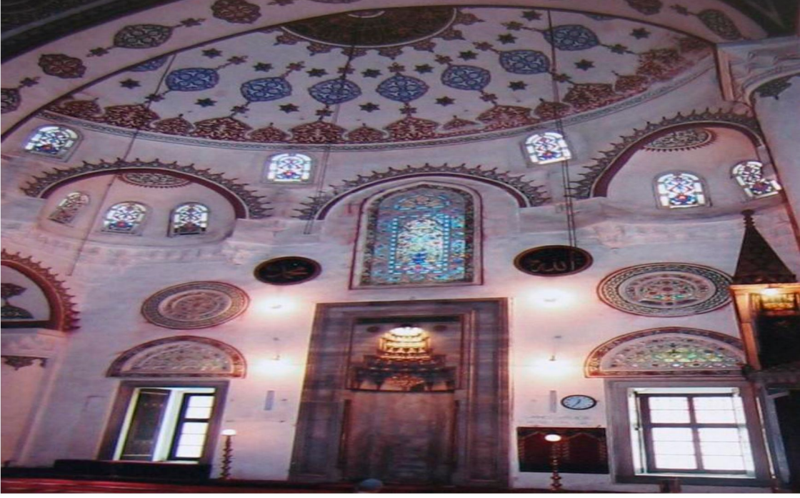
Resim 9: Üsküdar Mihrimah Sultan Camii mihrap duvarı

PİRİ MEHMET PAŞA CAMİİ'NİN SÜSLEME PROGRAMININ KLASİK OSMANLI MİMARİSİNDEKİ YERİ