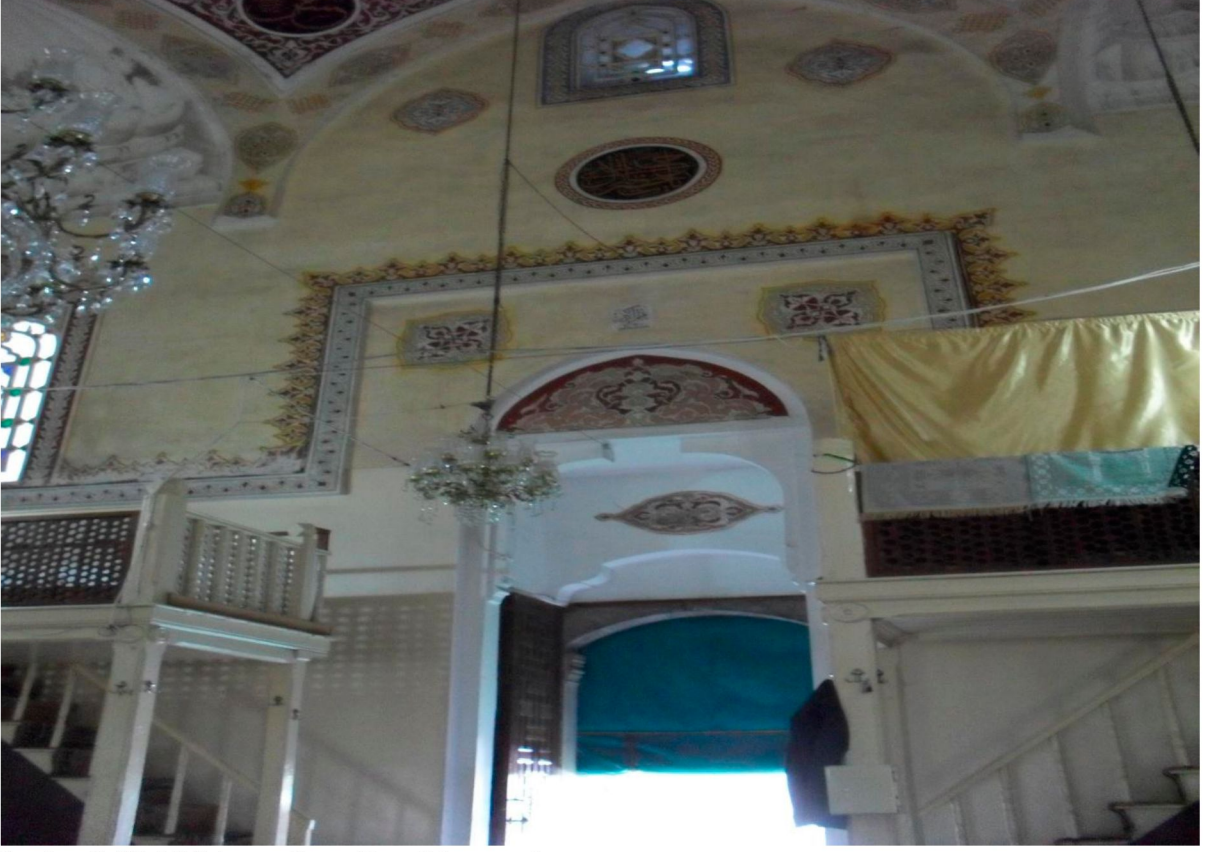
Resim 5: Piri Mehmet Paşa Camii kuzey duvarı