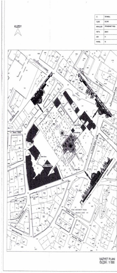
Plan 1: Piri Mehmet Paşa Camii vaziyet planı (Silivri Belediye Başkanlığı'nın izni ile)