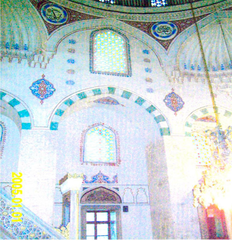
Resim 11: Hadım İbrahim Paşa Camii, batı duvarı