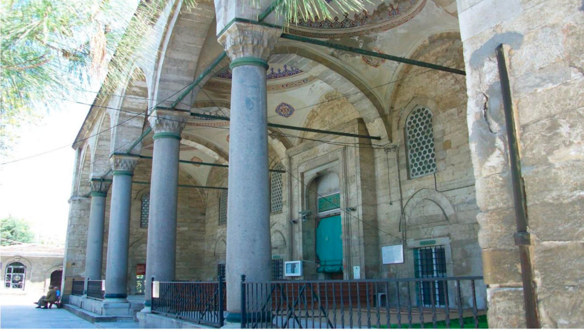
Resim 7: Piri Mehmet Paşa Camii, son cemaat yeri