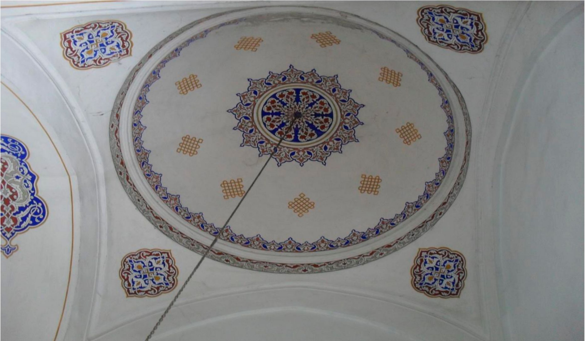
Resim 6: Piri Mehmet Paşa Camii batı tabhane kubbesi