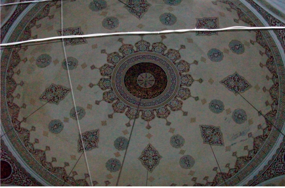
Resim 2: Piri Mehmet Paşa Camii merkezi kubbe içi