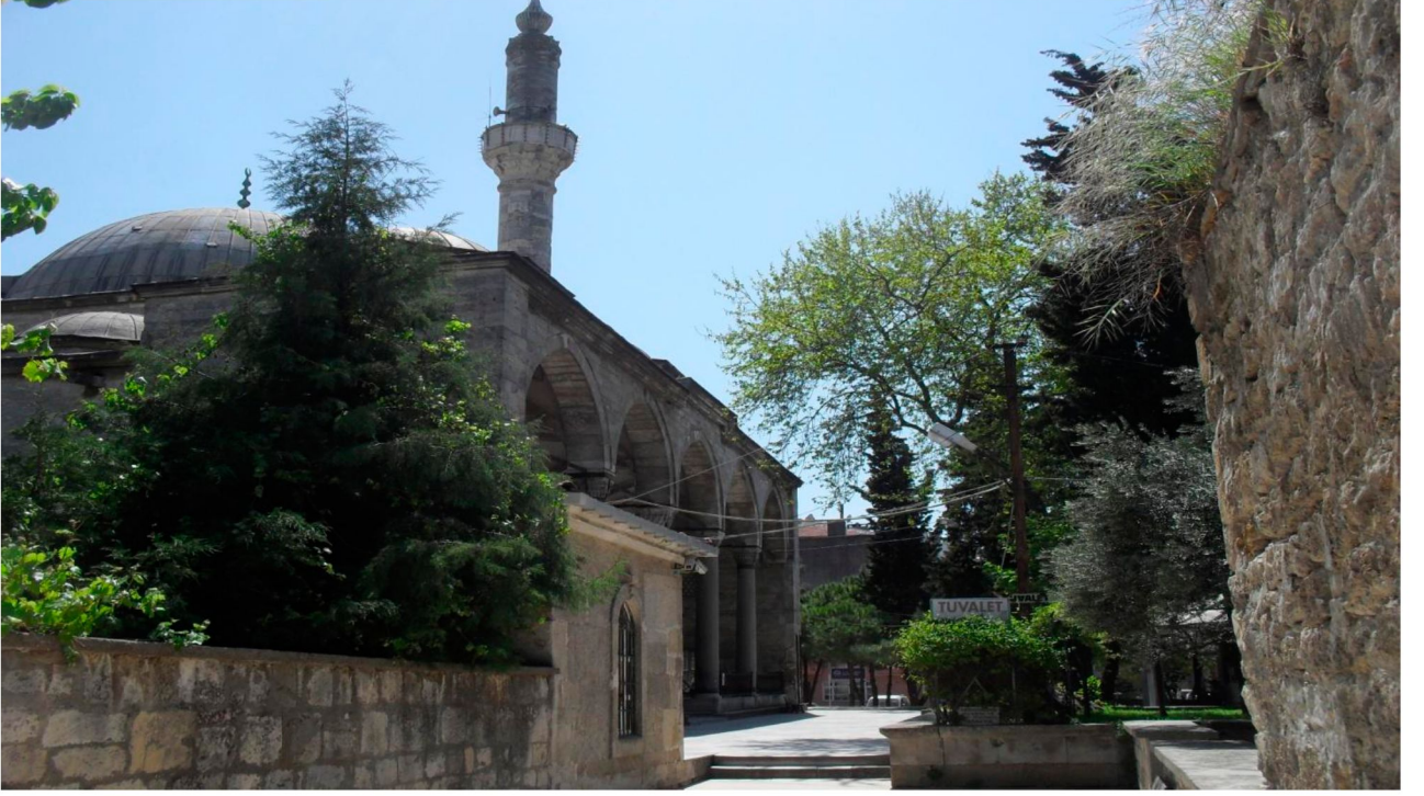
Resim 1: Piri Mehmet Paşa Camii