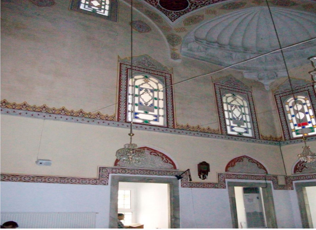
Resim 4: Piri Mehmet Paşa Camii, doğu duvarı