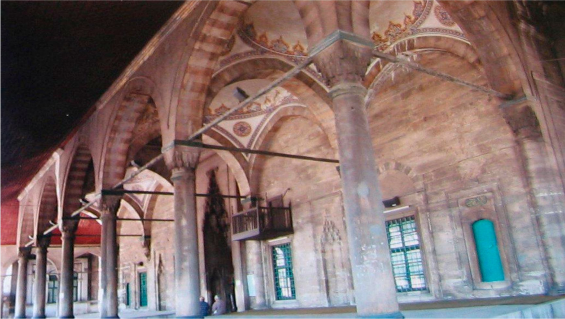
Resim 10: Üsküdar Mihrimah Sultan Camii, son cemaat yeri