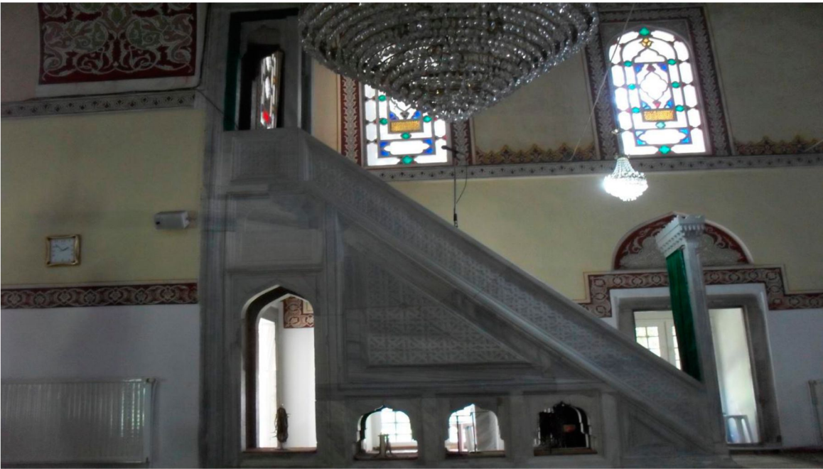
Resim 3: Piri Mehmet Paşa Camii minberi