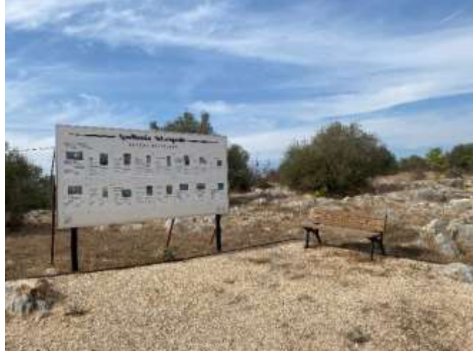
Görsel 13: Bilgilendirme Levhaları

getirilmiştir. Yol kenarlarına yer yer banklar yerleştirilerek ziyaretçilerin kimi zaman alanı içselleştirmelerine, detaylı incelemelerine ve dinlenmelerine imkân sağlanmıştır (Görsel 13).