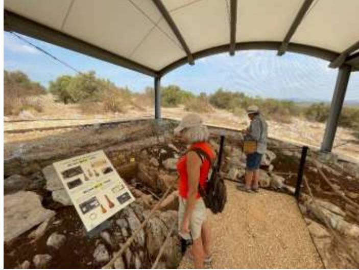
Görsel 34: Ziyaretçiler