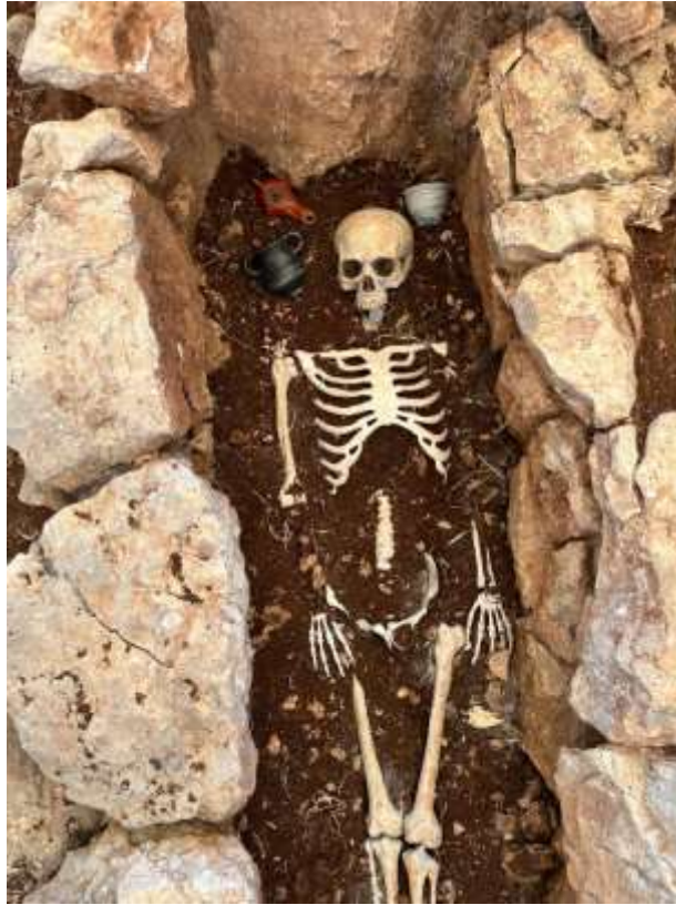
Görsel 26: Sergi Örneği Detay

Apollonia a.R. nekropolünde bulunan kondisyonu iyi durumdaki bir grup eser bugün Bursa Arkeoloji Müzesi'nin hemen girişinde yer alan bir vitrinde sergilenmektedir. Ancak mimarisinden kopuk bir şekilde sadece eser odaklı bir sergi kontekst bütünlüğü olmadığından maalesef çok anlam ifade etmemektedir (Görsel 27-31).