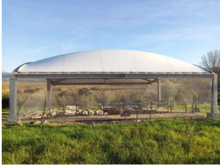
Görsel 23: Nekropol Alanı Ağ Sistemi Detay

Ağ sistemi sayesinde daha korunaklı hale gelen mezarlardan iki mezar seçilerek, ölü gömme geleneklerinin daha iyi anlaşılmasını sağlamak için polyester iskeletler yerleştirilmiştir. Kazılarda elde edilen buluntular doğrultusunda mezar hediyesi olarak kullanılan kap formlarının imitasyonları yapılarak ilgili mezarlara yerleştirilmiştir 11 . Buradaki amaç kontekst buluntunun bütünsel olarak ziyaretçiye sunulması ve antik dönem ölü gömme geleneklerinin daha iyi anlaşılmasını sağlamaktır.