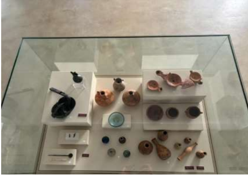
Görsel 28: Bursa Arkeoloji Müzesi Gölyazı a.R. Nekropolü Sergisi Detay