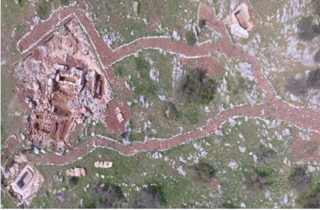
Görsel 3: Apollonia a.R. Nekropolü Genel Görünüm