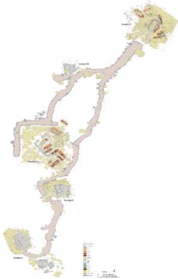
Görsel 4: Apollonia a. R. Nekropolü Sondaj Alanları, Rölöve