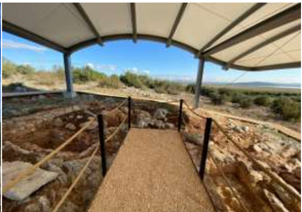
Görsel 12: Yürüyüş Yolları

Yürüyüş zemini 1,35 cm genişliğinde korten bir çerçeveden yapılmış daha sonra içleri sırasıyla jeotekstil ve çakıl taşı dökülerek basit ancak alanın topografyasına uygun hale