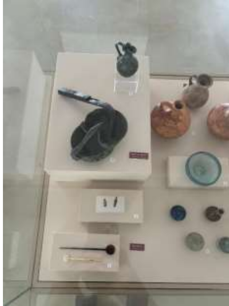
Görsel 31: Bursa Arkeoloji Müzesi Gölyazı a.R. Nekropolü Sergisi Detay

Kazı dönemi boyunca cumartesi ve pazar günleri “halk günleri” 13 kapsamında rehber eşliğinde ziyaretçilere bilgilendirme yapılarak onlardan geri bildirimler alınmaktadır (Görsel 32-34).