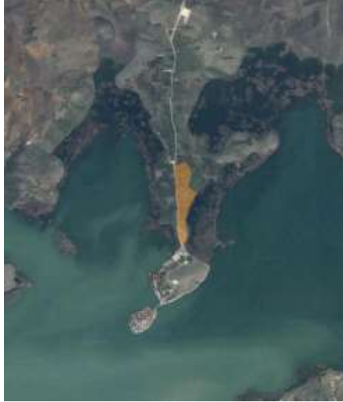
Görsel 1: Uydu Fotoğrafından Apollonia a.R. ve Apolloniatis

Antik Propontis (Marmara Denizi) ile Olympos (Uludağ) Dağları arasında kalan Apolloniatis (Uluabat) Gölü kıyısında yer alan Apollonia ad Rhyndacum Antik Kenti, Antik Çağ'da Bithynia Bölgesi'nin önemli kentlerinden birisidir. Kent Bursa-Karacabey karayolunun 35. kilometresinden güney yönünde 7 kilometre içeride yer almaktadır. Modern yol, yerli halk tarafından "Gâyrimüslüm Mezarlığı" olarak adlandırılan nekropolün ortasından geçerek kente ulaşır (Görsel 1-4) (Şahin, 2018, s. 2788).