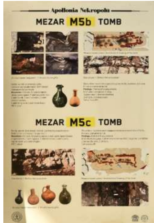
Görsel 20: Bilgilendirme Levhaları Detay