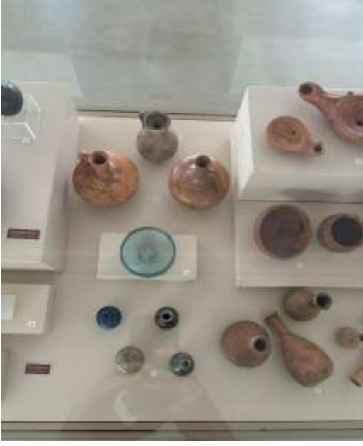
Görsel 29: Bursa Arkeoloji Müzesi Gölyazı a.R. Nekropolü Sergisi Detay