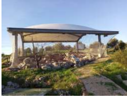
Görsel 22: Nekropol Alanı Ağ Sistemi Detay