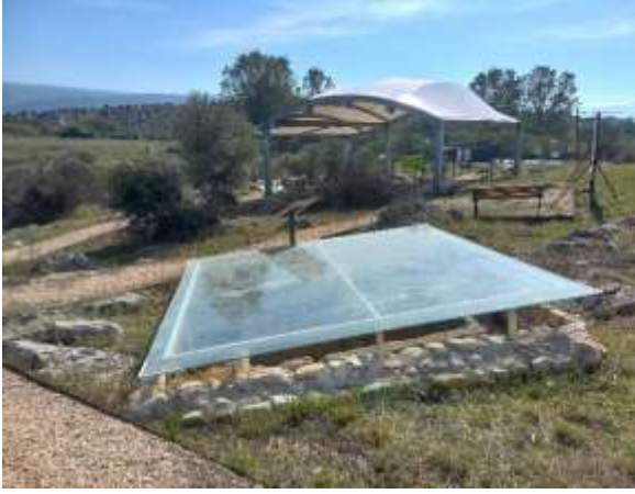
Görsel 9: Khamosorion Tipi Mezarlar