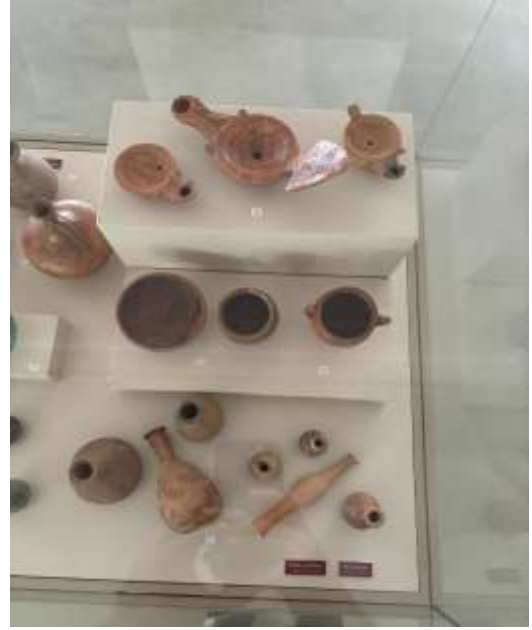
Görsel 30: Bursa Arkeoloji Müzesi Gölyazı a.R. Nekropolü Sergisi Detay