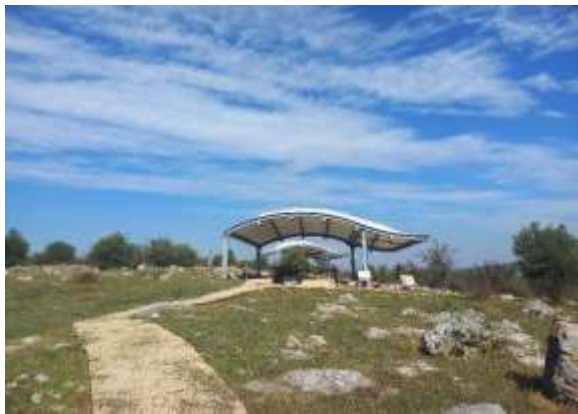
Görsel 11: Yürüyüş Yolları

Koruma çalışmaları dışında alanda mezarların konumuna uygun olarak yürüyüş yolları ve seyir terasları tasarlanmıştır (Görsel 11-12).