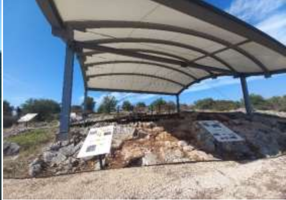
Görsel 15: Bilgilendirme Levhaları Genel Görünüm