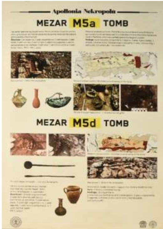
Görsel 19: Bilgilendirme Levhaları Detay