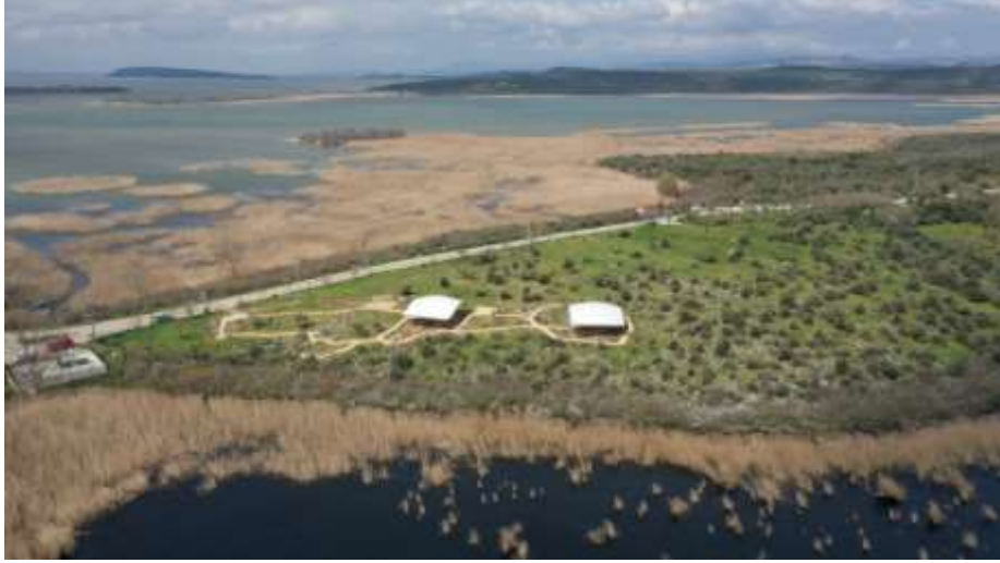
Görsel 6: Nekropol Alanından Genel Görünüm