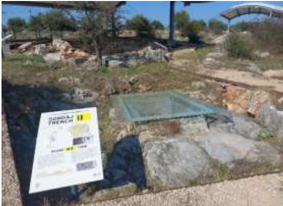
Görsel 16: Bilgilendirme Levhaları