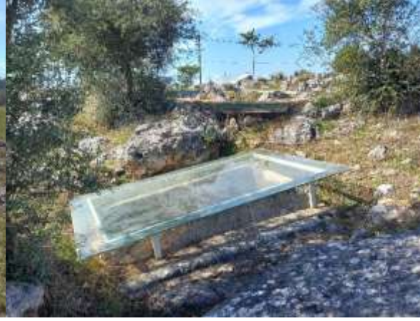
Görsel 10: Khamosorion Tipi Mezarlar