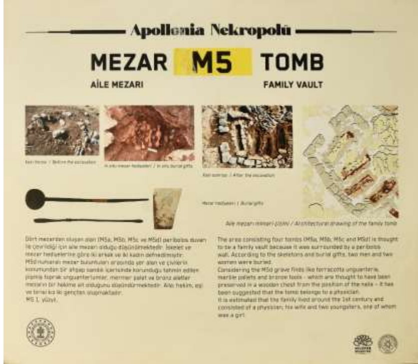
Görsel 18: Bilgilendirme Levhaları Detay

Mezarların bilgilendirme levhaları Türkçe ve İngilizce olmak üzere iki dilde yazılmıştır. Bilgiler içinde mezarın kazı öncesi durumu, kazı sonrası buluntuların pozisyonuna göre fotoğrafı ve çizimi, ayrıca buluntuların temizlenmiş fotoğrafları ile tarihlendirme detaylarına yer verilmiştir (Görsel 18-20).