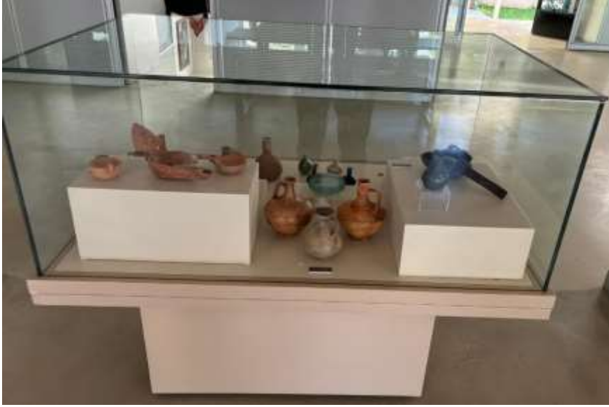
Görsel 27: Bursa Arkeoloji Müzesi Gölyazı a.R. Nekropolü Sergisi