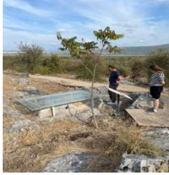
Görsel 33: Ziyaretçiler