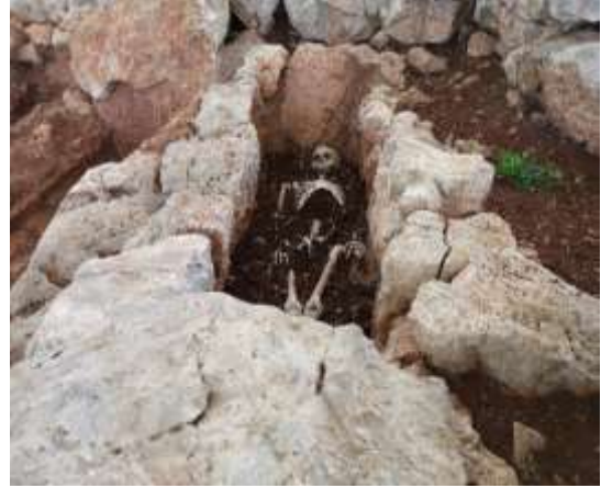
Görsel 25: Sergi Örneği Genel