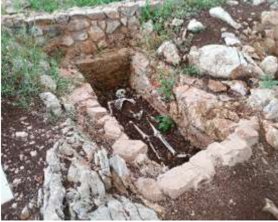
Görsel 24: Sergi Örneği Genel