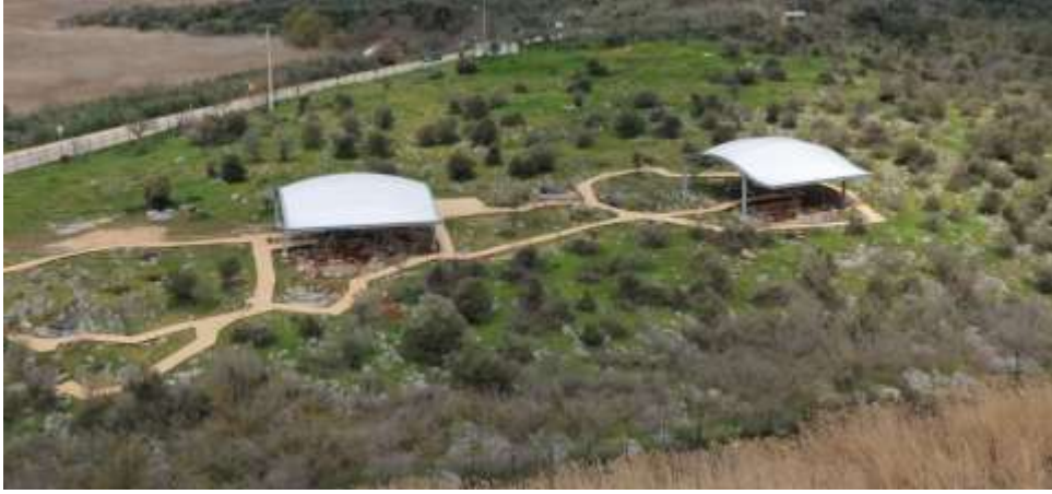
Görsel 7: Nekropol Alanından Genel Görünüm