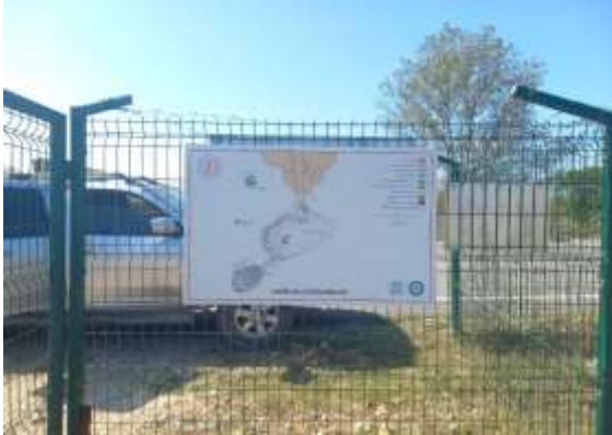
Görsel 14: Bilgilendirme Levhaları

Bu rotanın başlangıcından itibaren yürüyüş yolları, mezarların kazı başlangıcındaki hallerini ve kazılarda bulunan buluntu detaylarını gösteren bilgilendirme levhalarıyla desteklenmiştir (Görsel 14-16). Ayrıca bölgede bulunan endemik bitkiler hakkında detaylı bir bilgilendirme tabelası da yaptırılmıştır (Görsel 17).