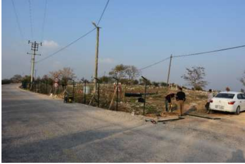
Görsel 5: Nekropol Alanının Çitle Çevrilmesi

Kazı çalışmalarını takip eden süreçte, ilk olarak define kazılarının yoğun olduğu 1307 numaralı parselin içinde kalan yaklaşık 2,5 hektarlık bir alanın çevresi koruma çiti ile çevrilmiştir 7 (Görsel 5).