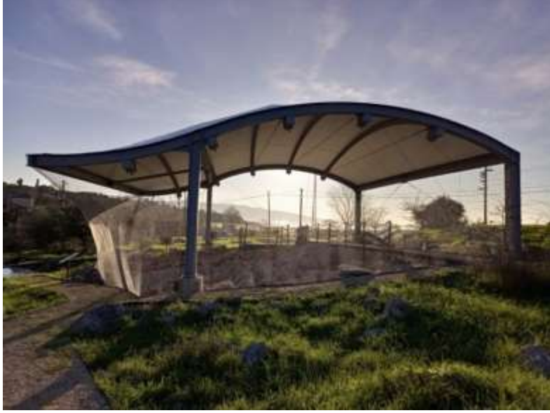
Görsel 21: Nekropol Alanı Ağ Sistemi

2023 yılında Türk Tarih Kurumunun proje desteği 9 ile özellikle alanda birincil kremasyon 10 mezarların sokak hayvanları tarafından tahrip edilmeye başladığının tespiti neticesinde, üst örtüsü olan grup mezarların etrafı ağ sistemi ile tamamen çevrilerek dış etkilere kapalı bir hale getirilmiştir (Görsel 21-23).