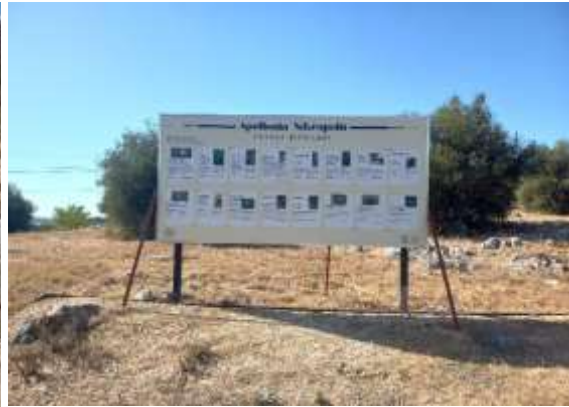
Görsel 17: Bilgilendirme Levhaları Detay