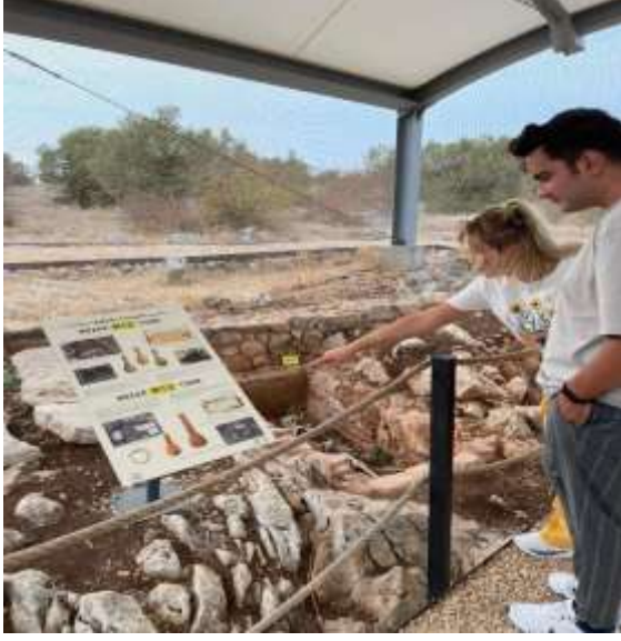
Görsel 32: Ziyaretçiler

Apollonia ad Rhyndacum Antik Kenti Nekropol alanında 17 Ağustos-12 Kasım tarihleri arasında hafta sonları 09:00-18:00 (12:00-13:00 arası hariç) saatleri arasında bilgilendirilme gezisi gerçekleştirilmiştir. 17 Ağustos-29 Eylül tarihleri arasında 106 kişi ziyaret etmiştir. Gelen ziyaretçiler arasında aileler, gençler ve orta yaşta kişiler yer almaktadır. Ziyaretçilerimiz oldukça ilgili ve entelektüel seviyeleri yüksek bireylerdir. Bir arkeolog eşliğinde nekropolü ziyaret eden turistler, kimi zaman alandaki bilgilendirme levhalarına odaklanarak detaylı bilgiler edinmeye çalışmışlardır. Kısa kültür gezisi sonucunda ziyaretçiler, antik kentteki diğer kalıntılara da daha ilgili yaklaşmışlardır.