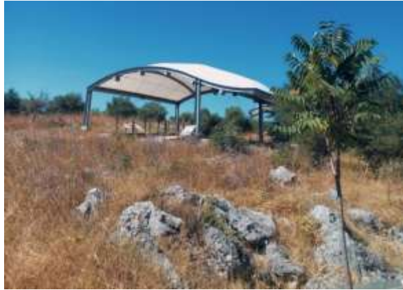
Görsel 8: Nekropol Alanından Görünüm

Bu koruma alanının dışında kalan, ana kayaya oyulmuş khamosorion tipi mezarlar ise metal bir çerçeve üzerine mezarların hava almasına imkân verecek açıklıklar bırakılarak cam ile örtülmüştür (Görsel 9-10).