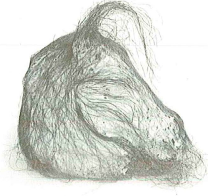
Resim: 4 Cafer ARSLAN, Sisal lif, İndigo boyama, Nonwoven, 2012, İstanbul En: 20cm, Boy: 20cm, Derinlik.13cm