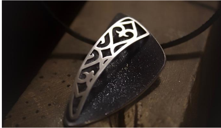
Görsel 8. Kazak desenli gümüş pandantif

Bu makalede, Kazak motiflerinin çağdaş takı tasarımında nasıl kullanıldığına dair bir örnek üzerinde durulmaktadır. Geleneksel motiflerin zengin kültürel ve sanatsal geçmişini, modern tasarım teknikleriyle buluşturmak için, Kazak takı sanatından ilham alarak hem estetik hem de kültürel açıdan derin anlamlar taşıyan bir takı tasarlanmıştır