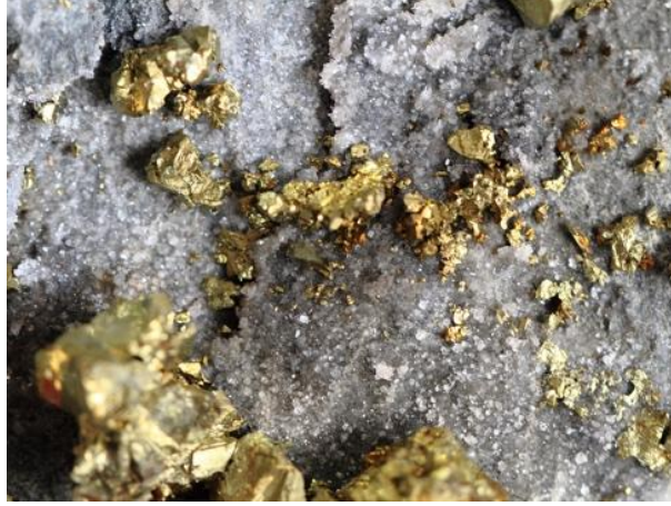
Görsel 7. Altın Madeni