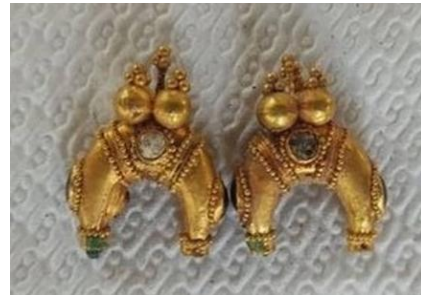
Görsel 4. Ay Motifi