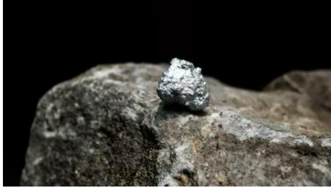
Görsel 6. Gümüş Madeni

Kazak takılarında en yaygın kullanılan madendir. Gümüş hem estetik bir değer katmakta hem de dayanıklılığı ile bilinen bir metal olarak takı yapımında önemli bir yer tutmaktadır. Gümüş takılar, özellikle kadınlar arasında yaygın olarak kullanılmakta ve günlük yaşamda olduğu kadar özel günlerde de tercih edilmektedir. Gümüşün işlenmesi sırasında kullanılan geleneksel teknikler, takıların üzerindeki desen ve motiflerin detaylı ve zengin olmasını sağlamaktadır. Kazak kültüründe gümüş takılar, sosyal statünün bir göstergesi olarak da kabul edilmektedir.