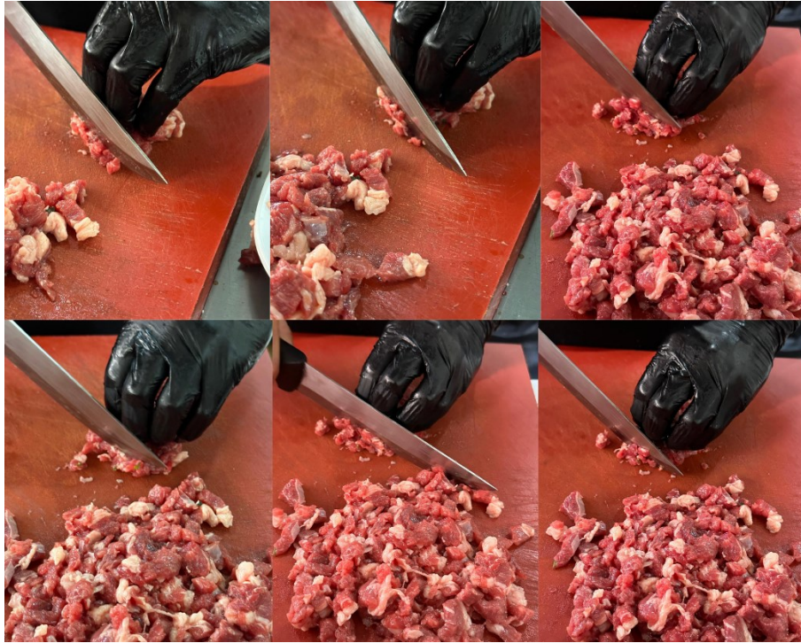
Şekil 2: Tantuni Etinin Doğrama Aşamaları

Katılımcılar, tantununin ayırt edici özellikleri olarak etinin kalitesini (K1, K3, K7) ve lezzeti ile kullanılan yağın önemini (K5, K6) vurgulamışlardır. Akademik araştırmalar etin kalitesinin lezzeti doğrudan etkilediğini ve doğru yağ kullanımının yemeğin karakteristik tadını oluşturduğunu göstermektedir. Ayrıca bu araştırmalar etin kalitesinin yemeğin genel lezzetini ve tüketici memnuniyetini etkilediğini ortaya koymaktadır. Özellikle, araştırmalar etin kalitesinin lezzet ve doku gibi duyuşal özellikler üzerinde belirleyici olduğunu göstermektedir (Webb, 2014; Mir vd., 2014; Lu, Abdalla Gibril, Xu ve Xiong, 2024). Şekil 1’de tantununin en ayırt edici özelliklerinden bir tanesi olan etinin doğrama aşamaları yer almaktadır.