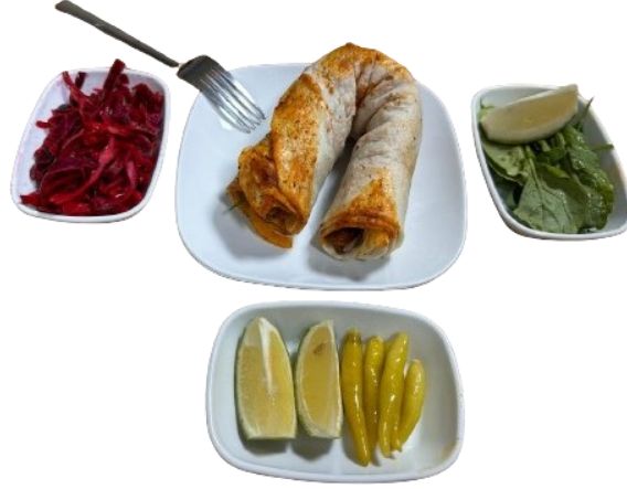
Şekil 5: Tantuni Servisi

Turşu ve limon gibi eşlikçiler yemeğin asidik dengesini sağlar ve lezzetini artırır (Achaya, 1994). Salata ve biber bir yemeğe tazelik ve çeşitlilik katar. Ayran ise baharatlı ve yoğun lezzeti dengeleyici bir içecek olarak sıkça tercih edilir (Tarakçı ve Küçüköner, 2003). Bu bulgular tantununin zengin içeriği ve çeşitli servis şekilleri ile geniş bir tüketici kitlesine hitap ettiğini göstermesi açısından önemlidir. Tantununin içeriği ve eşlikçilerinin hem besleyici hem de lezzetli bir yemek deneyimi sunduğu söylenebilir. Tablo Servis çeşitliliği ise tantununin farklı tüketim ihtiyaçlarına ve tercihlerine uyum sağlamasında etkilidir.