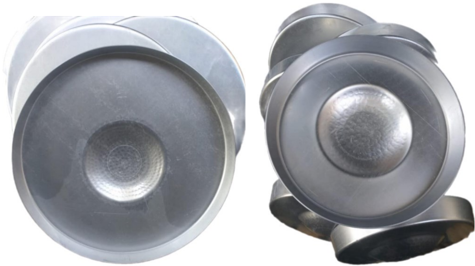
Şekil 1: Tantuni Tepsisi

Katılımcılar, tantuni adının kökeni konusunda farklı görüşler bildirmişlerdir. K3, K5, K9 ve K10'a göre, tantuni adının tahta kaşığın tantuni tespisine (Şekil 1) vurulmasıyla çıkan sestense geldiği ifade edilmiştir. Bu görüş, tantuninin adının yemeğin hazırlanma sürecindeki belirgin bir sesle ilişkilendirildiğini göstermektedir.