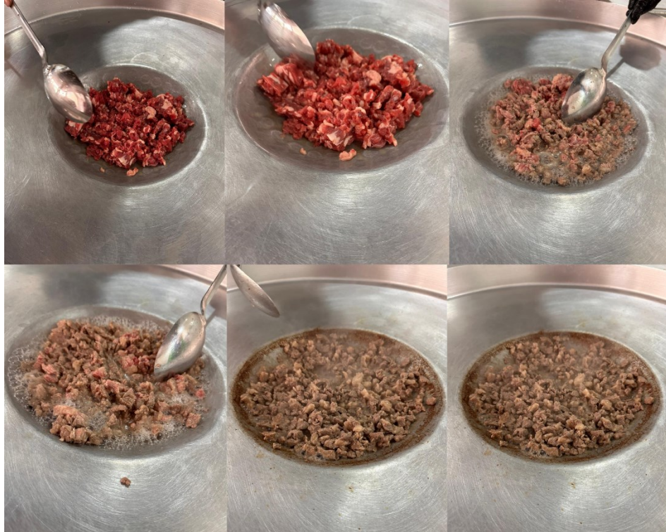
Şekil 3: Tantuni Etinin Pişirme Aşamaları

Tantuninin yapımında kullanılan yağın pamuk yağı olduğu vurgulanmıştır (K2, K3, K4, K5, K6, K8, K9). Bazı katılımcılar ise ayçiçek yağının da kullanıldığını belirtmişlerdir (K1, K7, K10). Bu bulgular, tantuninin hazırlanışında kullanılan yağ türleri konusunda çeşitli tercihler olduğunu göstermektedir. Yemeklerde kullanılan yağın, yemeğin besin değeri ve lezzet profili üzerinde önemli bir etkiye sahip olduğu bilinmektedir (Hart, Petersen ve Kris-Etherto, 2023). Pamuk yağı, yüksek duman noktası ve nötr lezzeti ile kızartma ve pişirme