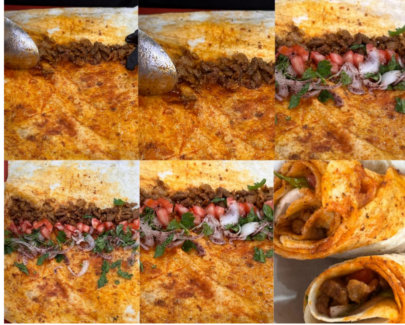
Őekil 4: Tantuninin İeriđi

Yemeklerde kullanılan malzemeler, sunum ve servis Őekilleri, yemeđin besin deđeri ve kltrel kabul zerinde nemli bir etkiye sahiptir (Fischler, 1988; Zellner vd., 2014; Uuk, 2022; Uuk, Kahraman ve zdemir, 2023; Uuk, 2023). Servis Őekilleri tktim Őeklini ve kullanıcı deneyimini dođrudan etkilemektedir (Capatti ve Montanari, 2003). Bulgular, tantuninin ieriđi ve servis Őekilleri konusunda eŐitli tercihler olduđunu gstermektedir. Katılımcıların tamamı tantuninin ieriđinde et, sođan, domates, maydanoz, yađ ve baharatlar bulunduđu belirtilmiŐtir. Bazı katılımcılar tantuninin servisinin genellikle drm, ekmek arası veya tabakta yapıldıđını (K1, K4, K5, K6, K7, K9, K10) belirtmiŐlerdir. Őekil 3'te tantuninin ieriđi yer almaktadır.