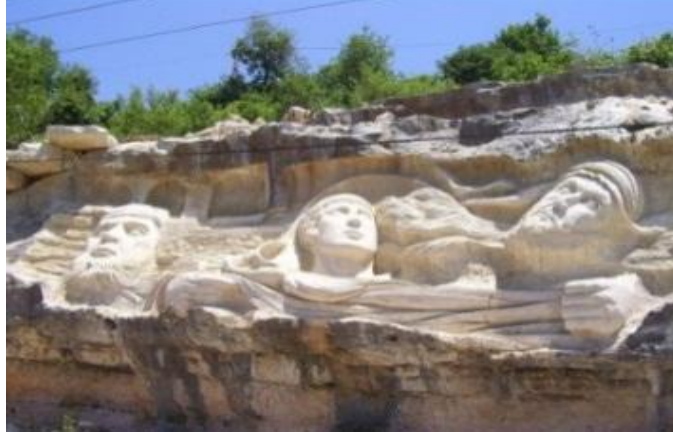
Görsel 14: Şeyh Halil el-Khatib ve Arkadaşlarının Rölyefi, Suriye, Tartus