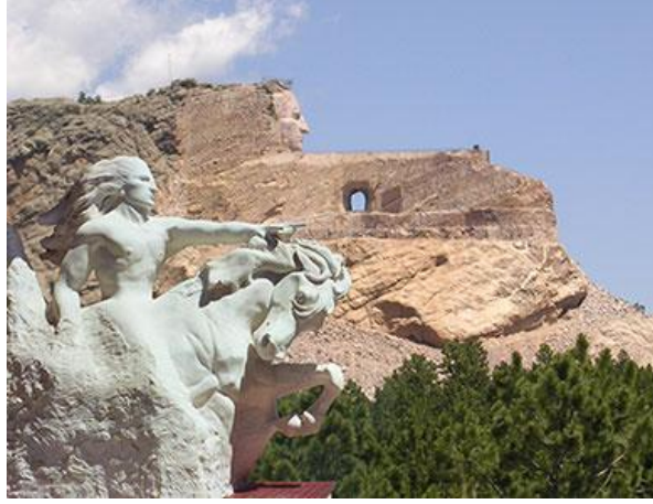
Görsel 2: Crazy Horse Anıtı

1948 yılında başlanan ve yerli Amerikalıların maddi olanaksızlıklardan dolayı henüz tamamlanmamış bir anıt projesi olan Crazy Horse Anıtı ile kendisini göstermektedir. Heykel konu olan Crazy Horse, Oglala Lakotalarının Oglála Thiyóspaye kolunun Húnkpathila bandından Siu lideridir. Bir Amerikan yerlisi olarak, beyazlara karşı elde ettiği zaferlerle dikkat çeken Crazy Horse yine beyazlar tarafından 1877 yılında pusuya düşürülerek öldürülmüştür. Büyük bir savaşçı olduğu kadar önemli bir politik lider ve geleneklerine çok bağlı bir filozof olarak tanımlanan Crazy Horse, beyazlara karşı tüm Kızılderili'lerin bir onur ve gurur sembolü olarak anılmaktadır. ( https://web.archive.org/web/20090112005717/http://www.crazyhorse.org/ ) (Görsel 2-3 ).