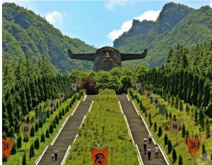
Görsel 8: Çin, Shennong Heykeli

Tarihin her döneminde mevcut erklerin inançsal ve ideolojik düşüncelerinin yaygınlaştırılma ve kabul ettirilme sürecinde gösterişli ve etkili bir metot olarak, anıtsal yapılar varlık bulmuştur. Çünkü