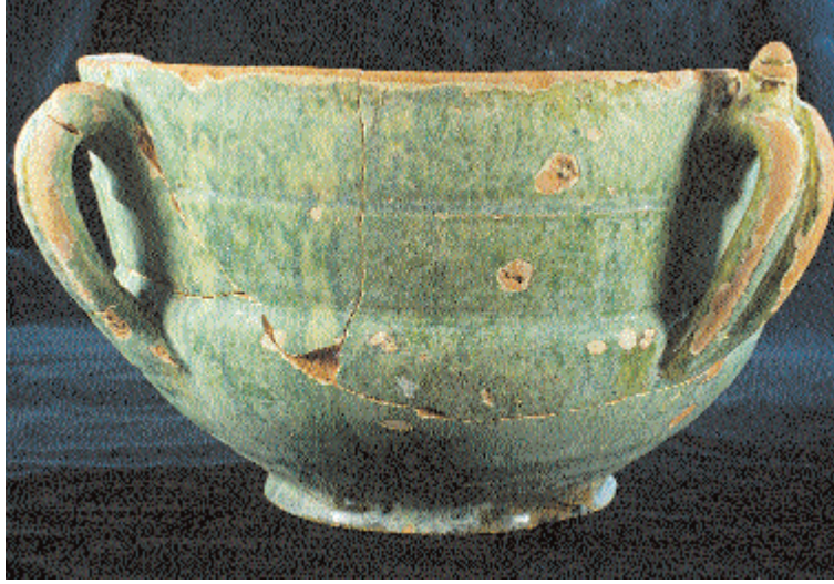
Resim 5. Samosdelka seramik buluntusu E. Zilivinskaya ve D. Vasil'yev, "Gorodişe v del'te Volgi", Vostochnaya kolleksiya, s. 52.

tuğlaların ana yapı malzemesi olarak değil de duvarların kaplanması, dolgusu veya tadilat işleri için üretildiğini ortaya çıkarmıştır. 39