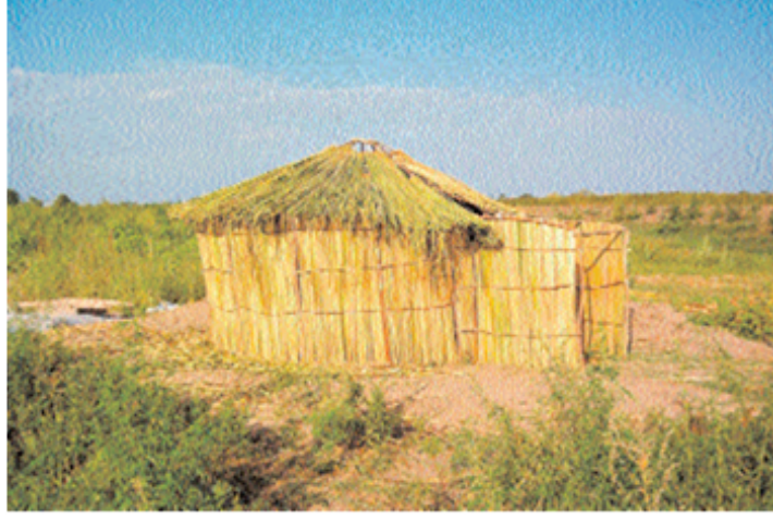
Resim 6. Yurt tipi konut rekonstrüksiyonu E. Zilivinskaya ve D. Vasil'yev, agm, s. 49

Yazılı kaynaklarda şehrin orta kısmının bulunduğu adada kağanın yaşadığı geçmiştir ki hava fotoğrafları adada üçgen şeklinde düzenlenmiş surların varlığını göstermiştir.