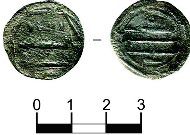
Resim 3: Tunus'ta Abbasi Halifeliği adına basılmış gümüş dirhem (VIII. yy)

https://www.rgo.ru/en/article/threshold-great-discovery-archaeologists-begin-excavations-legendary-capital-khazar , 9. 11. 2024 sa. 18:00