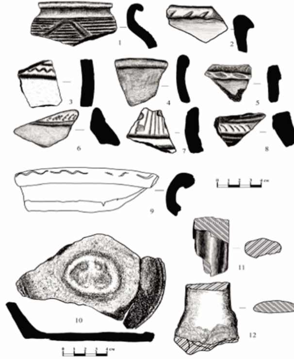
Resim 2: Semibugr yerleşiminde keşfedilen seramik parçaları D. S. Solov'yev vd., agm, s. 104

hesaplanmıştır. 26 Aynı sene höyüğün tepesinden tabanına kadar yayılmış seramikler araştırmacılar tarafından çeşitli kıstaslar (kullanım amacı, tipoloji, pişirme usulü vd.) gözetilerek kategorize edilmiştir. İlk tip sayısı en fazla olan ve herhangi yabancı bir madde içermeyen kilden yapılmış, mutfak eşyalarıdır. Parçaların ana kısmı gri, gri-kahverengi ve kahverengi renkte olup, çömlekçi çarkında imal edilmiştir. Süsleme kompozisyonu ise doğrusal, dalgalı, eğik, kafes çentikler ile temsil edilmektedir. İkinci tip ise hamurunda organik madde karışımı bulunan, çömlek çarkında imal edilmiş, çizgisel veya tarakla uygulanan dalgalı bezemelere sahip sofraya kap kacaklarıdır ki bunlar Dağıstan ve Ten Bölgesi'ndeki Saltovo-Mayat seramikleri ile benzer nitelikler taşır. 27 Özellikle keşfedilen bu ikinci tip seramiklerin yoğunluğu keşfedilen bu Hazar yerleşiminin en geniş Saltovo-Mayat yerleşimlerinden biri olarak etiketlenmesine vesile olmuştur.