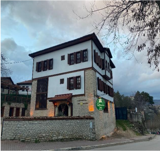
Resim 4. Sağ Ön Cephe