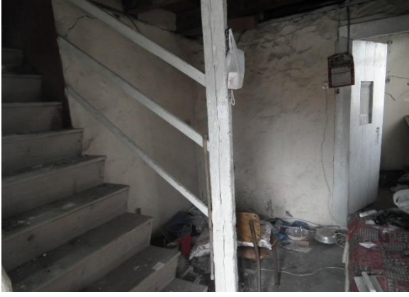
Resim 8. Zemin Kat (Hol)