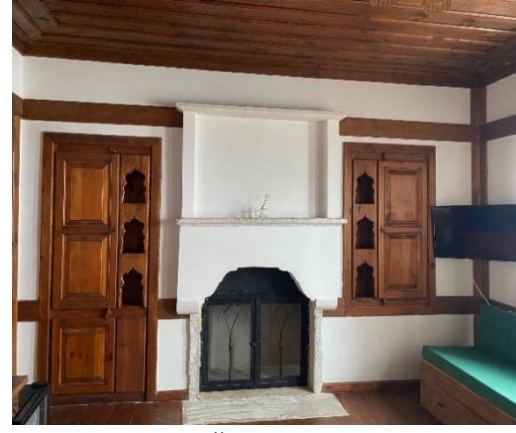
Resim 13. 1. Kat Örnek Oda (Amastrist)