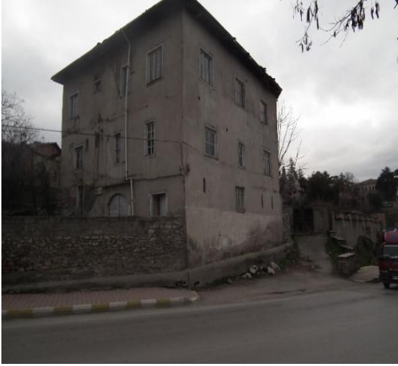
Resim 2. Sağ Ön Cephe

Safronia 1900 Otel'i'nin doğu duvarında yer alan "Dua Odası", Kıranköy semtindeki gayrimüslim cemaatlerin bıraktığı mimari mirasın önemli bir yansımasıdır. Tarihsel olarak, bu tür sivil mimari yapıların ilk katlarındaki odalar genellikle dini amaçlar için kullanılmış ve dua odası, şapel veya ikona odası olarak adlandırılmıştır. Bu kutsal alanlardan bazıları özellikle dönemin gayrimüslim kadınları tarafından bakımının yapıldığı dönemin gayrimüslim cemaatlerinin dini pratiklerini ve günlük yaşamlarını sergileyen önemli kültürel ve ruhani unsurlar olarak düzenlenmiştir (Gür ve Karakök, 2024: 101-125).