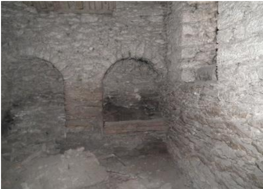
Resim 10. Zemin Kat

Görsellerden de anlaşılacağı üzere, otelin girişinde yer alan dinlenme alanı, giriş ile ana mekân arasında güçlü bir görsel ve mekânsal süreklilik sağlamaktadır. Bu süreklilik, yalnızca fiziksel bir bağlantıyı değil, aynı zamanda yapının tarihi dokusunu ve öyküsünü mekânlar arasında hissedilir bir biçimde aktarmayı amaçlamaktadır. Otelin tarihi karakteri, yapının cephesinden başlayarak giriş alanına, oradan da ana mekâna kadar kesintisiz bir şekilde hissedilmekte ve ziyaretçilerine geçmişin izlerini çağrıştıran anlamlı bir deneyim sunmaktadır.