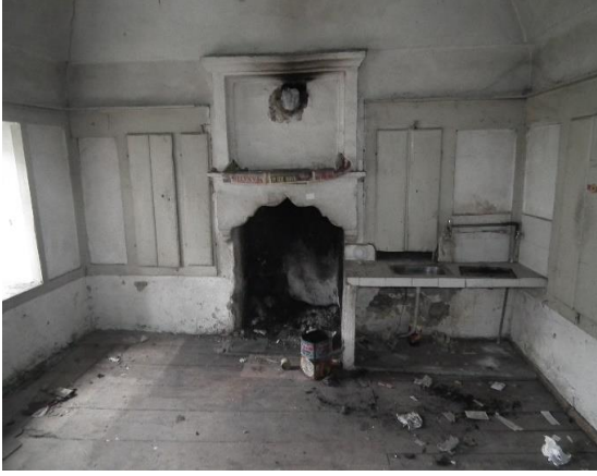
Resim 14. 2. Kat Örnek Oda