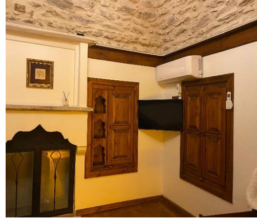
Resim 15. 2. Kat Örnek Oda (Taş Oda)