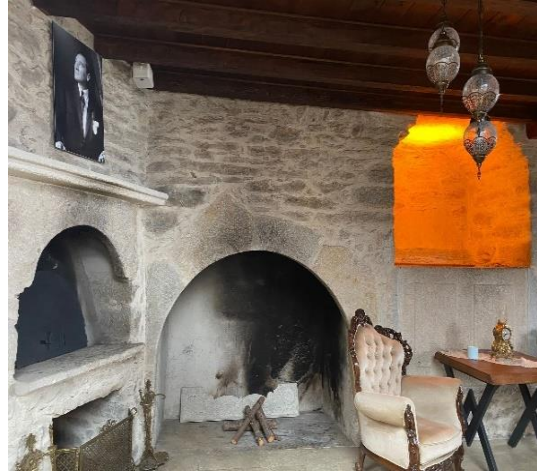
Resim 7. Zemin Kat (Lobiden bir bölüm)