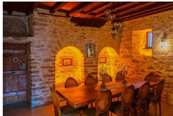
Resim 11. Lobi oturma alanı

Saffronia Otel'in mekânsal düzenlemeleri incelendiğinde, yapının özgün mimari özelliklerinin korunduğu ve geçmişteki ev işlevinin, otel işlevine uyarlanarak mekânsal bir uyum sağlandığı görülmektedir. Otelin girişi (lobi), merdivenler, zemin kattaki alanlar (odalar), üst katlardaki (1.ve 2. kat) ara holler ve da mekânları ve tasarımları, her odada farklılık göstermekle birlikte mevcut mekânların özgün hali korunarak işlevsel bir şekilde yeniden kullanıma kazandırılmıştır. Görsellerde Safranbolu Rum evlerinin zemin katlarında yüksek taş duvarlar ile tasarlanmış ve üst kat tabanına kadar yükseltildiği görülmektedir. Rum evlerinin plan ve tipolojik yapılarının, zaman içinde büyük bir değişim göstermediği ve geleneksel özelliklerini büyük ölçüde koruduğu gözlemlenmektedir (Günay, 1998) Rum evlerinin mimari sürekliliği ve kültürel mirası