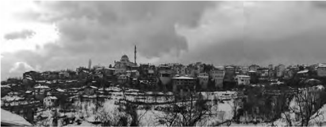
Resim 1. Kıranköy Görünümü

Kıranköy yerleşimlerinin oluşumunda, Rum yapılarının önemli bir etkisi olmuştur. Kıranköy'de, Rumlar mübadele dönemi öncesine kadar uzun yıllar boyunca yaşamış, dini, ticari ile ekonomik faaliyetlerini devam ettirmiştir. Kıranköy, tarihi dokusuyla birlikte modern yapılaşmanın içinde kalan önemli bir yerleşim alanıdır. Ancak, modern yerleşim düzeninin etkisiyle bölge bazı tehditlerle karşılaşmaktadır. Mübadele sonrası dönemde, yaşam koşulları ve zamanın ihtiyaçları doğrultusunda Kıranköy'de çeşitli değişiklikler yaşanmıştır. (Hacısalıhoğlu, 1995). Bu değişikliklerin bir sonucu olarak, bölgedeki sivil mimari yapılar günümüzde farklı turizm işletmeleri olarak kullanılmaktadır.