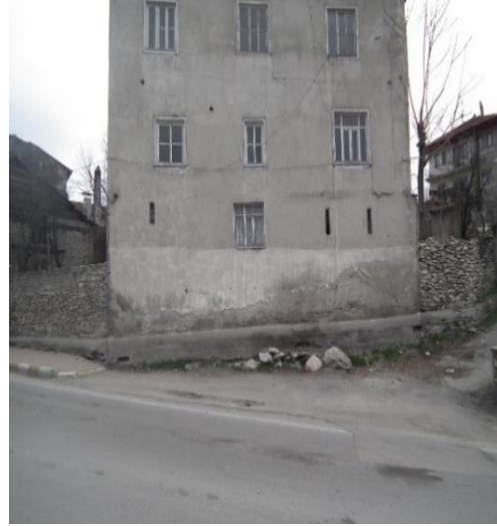
Resim 3. Sağ Yan Cephe