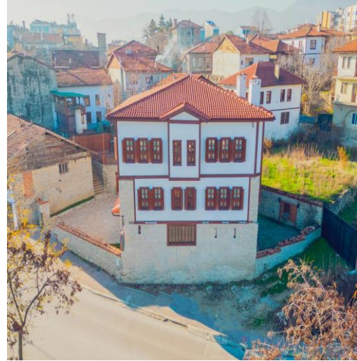
Resim 5. Sağ Yan cephe