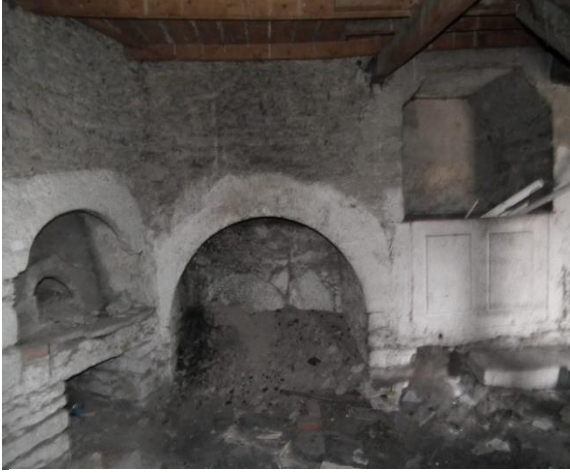
Resim 6. Zemin Kat (Hol)

bir katkı sağlamaktadır. Özellikle kültür turistleri için bu otantik mekânlar, geçmiş ile bugün arasında bir köprü kurulmasına olanak tanıyarak Safranbolu'nun mirasını öne çıkaran sürükleyici bir deneyim yaratmaktadır. Bugün Saffronia 1900 Otel koruma altındaki bir yapı olarak, Safranbolu'nun turistik ve kültürel kimliğine katkıda bulunmaktadır. Restorasyon çalışmaları ve sürdürülebilir turizm anlayışı ile bu tür tarihi yapılar hem yerel halk hem de ziyaretçiler için birer kültürel zenginlik kaynağı olarak önemini korumaktadır. Saffronia 1900 Otel gibi yapılar, geçmişin izlerini bugüne taşıırken, aynı zamanda gelecek nesillere aktarılması gereken önemli birer miras olarak değerlendirilmektedir.