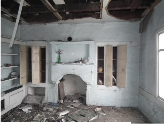
Resim 12. 1. Kat Örnek Oda

koruma özelliği, Saffronia Otel'in girişinde benzer taş duvarlarla yaşatılmış ve görsellerde etkili bir şekilde yansıtılmıştır.