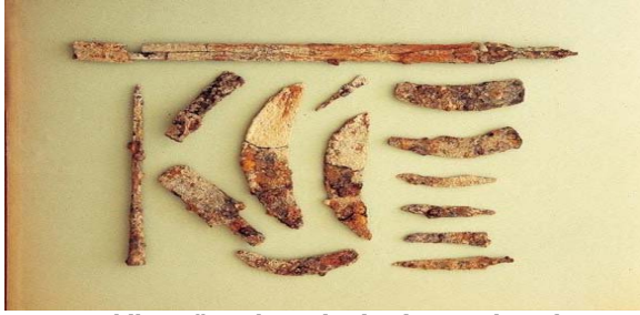
Şekil 7. Sümerlere ait pişmiş toprak orak

Mezopotamya ve Anadolu geleneğinden farklı olarak gelişen Mısır'da da ekonominin temelini tarım oluşturmaktadır. Doğal olarak bu olanağı Mısır coğrafyasına sağlayan Nil Irmağıdır. Nil Irmağı'nın belli aylardaki taşkınlığının sonrasında çekilen suların bıraktığı alüvyon bakımından zengin bataklık alanda, önceleri doğrudan tohum atılarak tarım yapılmaya başlanmış (Mısır'da tarımda saban kullanılmadan önce taşan Nil yatağının çekilmesinden sonra oluşan bataklık alana tohumların atıldığı ve domuzların bunları yemek için geldiklerinde, tırnakları sayesinde tohum tanelerinin çamurla kaplanmasını sağlayarak bu