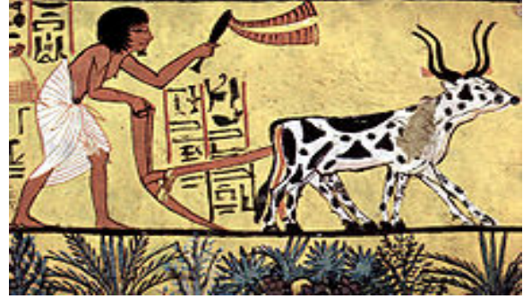
Şekil 8. Mısır'dan saban kullanımı

yolla yeşermesinin gerçekleştiği anlaşılıyor. Bu nedenle ekim ayına domuz-temmuz ayı denildiği ve bugünkü temmuz ayının isminin buradan geldiği düşünülmektedir) ancak sonraları ise bu alanların hayvan (boğa) gücüyle sürülmesi yöntemiyle tarım yapılmaya başladığını çeşitli betimlerden öğrenebilmekteyiz (Resim 8).