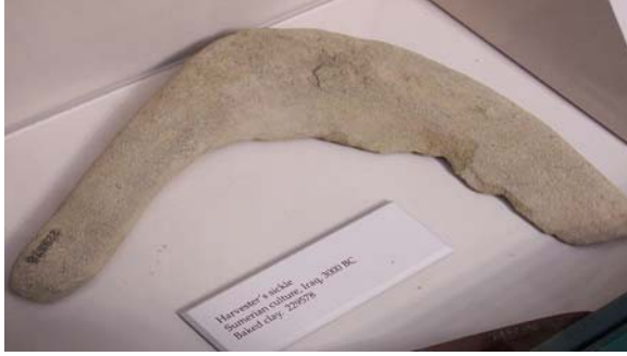
Şekil 6. Van kalecik'ten Urartu dönemi tarım aletleri

olarak tanınan Mezopotamya'da erken dönemlerden itibaren tarım aletleri kullanılmaya başlanmıştır. Anadolu'nun erken dönemlerinde olduğu gibi Mezopotamya'da, M.Ö. 4. binde gelişen Sümer kültüründe, yay şeklinde kesici bir yüzeye sahip orakların kullanıldığını arkeolojik verilerden öğrenebilmekteyiz (Resim7).