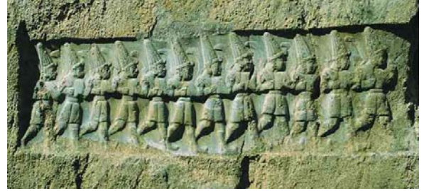
Şekil 5. Yazılıkaya ellerinde orak taşıyan 12 tanrı betimi

da kolaylaştırmıştır. Yeni ihtiyaçlar, bilinen aletlerin yanında madenden kürek, kazma, çapa, yaba ve benzeri birçok tarım aletinin geliştirilmesi ve üretilmesine neden olmuştur. Bunun en güzel örneklerinden biri, Hitit İmparatorluğu döneminde yapılan Yazılıkaya kabartmasında karşımıza çıkar. Burada yer alan 12 tanrı kabartmasında, figürlerin ellerinde madenden yapıldığı anlaşılan orak ile betimlenmişlerdir. (Şekil 5). Yine benzer orak örneklerini Elazığ bölgesindeki Korucu Tepe kazı buluntuları arasında da görebilmekteyiz (Ertem, 1988).