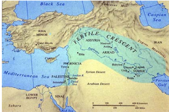
Şekil 1. Mezopotamya haritası

Dünyanın ısınması ve buzulların çekilmesi ile Güney Dođu Anadolu'da, Dicle ve Fırat ırmaklarının yatakları ortaya çıkmış, bu iki ırmak arasında kalan ve Mezopotamya olarak adlandırılan bölgenin kuzeyini oluşturan bugünkü Güneydođu Anadolu Bölgesi, insanların yaşamasına en elverişli coğrafyalar halini almıştır (Şekil 1).