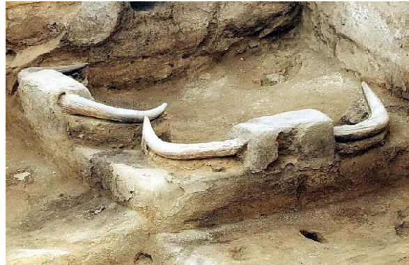
Şekil 3. Çatal höyük tapınağı boğa boynuzları

Gerçektende Anadolu'daki hemen bütün yerleşme yerlerindeki arkeolojik kazılardan çıkan çeşitli boyutlardaki boğa figürlerinin yanında, Çatalhöyük'te görüldüğü gibi (Şekil 3) tapınakta monte edilmiş boğa boynuzlarına (bukranion-stilize boğa başı), Neolitik Dönemden Roma Dönemi'nin sonlarına kadar yoğun bir şekilde rastlanılmaktadır (Günümüz Anadolu köylerinde evlerin giriş cephesinde nazar veya estetik amaçlı duvara yerleştirilen boğa başları geleneğinin misyonel değişime uğramasına rağmen kültürel olarak halen sürdürülüyor olması, bağlam anlamında dikkat çekicidir).