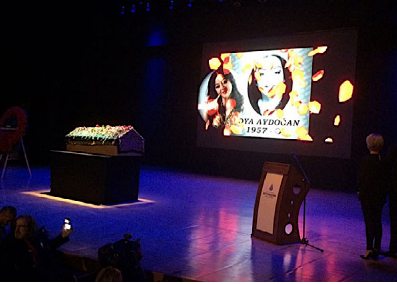
Foto 2. Oya Aydoğan için Cemal Reşit Rey Konser Salonunda tören düzenlenmiştir. (URL-6)