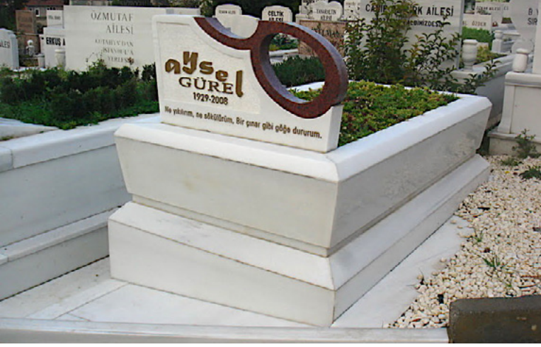
Foto 14. Türk pop müziğinin ünlü söz yazarı Aysel Gürel'in cenaze töreni, habitusunu yansıtacak şekilde düzenlenmiştir. Aynı şekilde, Zincirlikuyu Mezarlığı'ndaki mezar taşı da onun yaşam tarzını simgeleyecek şekilde tasarlanmıştır.

Aysel Gürel, yaptığı işi yansıtan habitusuna uygun bir topluluk tarafından son yolcuğuna uğurlanmıştır. Cenazesine katılan isimlere bakıldığında, zamanında beste ve şarkı sözü verdiği elinden tuttuğu isimlerden oluşmaktadır: