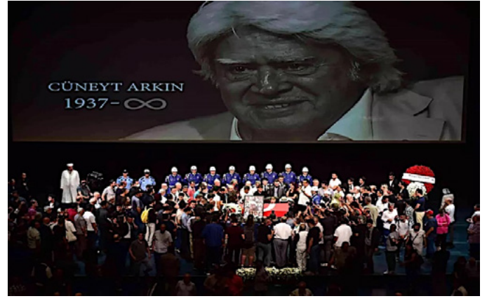
Foto 7. Haziran 2022'de 85 yaşında hayatını kaybeden Yeşilçam'ın usta ismi Cüneyt Arkin için AKM'de düzenlenen törene Ediz Hun, Ahmet Arıkan, Nuri Alço'nun da aralarında bulunduğu Yeşilçam'ın ünlü isimleri katılmıştır. Tören, Cüneyt Arkin'in unutulmaz filmlerinden kesitlerin yer aldığı sunum ile başlamış ve bitiminde Arkin, dakikalarca ayakta alkışlanmıştır. (URL- 11)