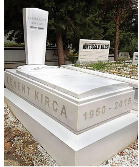
Foto 18. Mezarın üzerinde yapılan iki çukur hem kuşların gelip su içmesi için hem de Levent Kirca'nın pos bıyıklarını simgelemektedir. “

Kültürel sermaye ve habitus, yalnızca mezar taşlarında değil, yaşamın içinde ölümsüzleştirilen kentsel mekânlarda da varlığını sürdürmektedir. Habituslarına uygun olarak, isimlerinin ölümsüzleştirilmesi ve her zaman hatırlanmaları amacıyla ünlülerin isimleri çeşitli kentsel ve kamusal alanlara verilmiştir. Bu durum, kültürel sermaye tarafından şekillendirilen habitus kavramının, bu alanlara verilen isimler aracılığıyla somut bir şekilde görünürlük kazandığını göstermektedir.