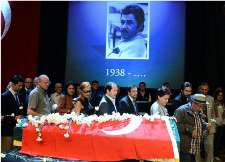
Foto 3. 1 Ekim 2012 tarihinde vefat eden Türk müzik dünyasında "Samanyolu" şakısıyla tanınan Berkant için önce Cemal Reşit Rey'de tören düzenlenmiştir. Berkant, daha sonra Teşvikiye Camii'nde kılınan cenaze namazının ardından Zincirlikuyu'da toprağa verilmiştir. (URL-7)