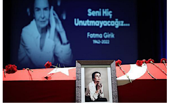
Foto 5. 27 Ocak 2022 tarihinde vefat eden Ünlü Sinema oyuncusu Fatma Girik'in cenazesi bir dönem Belediye Başkanlığı yaptığı Şişli Belediyesine ardından da AKM'ye getirilmiştir. Buradaki törenin ardından Teşvikiye Camisinde kılınan cenaze namazının ardından Bodrum'da toprağa verilmiştir. (URL- 9)