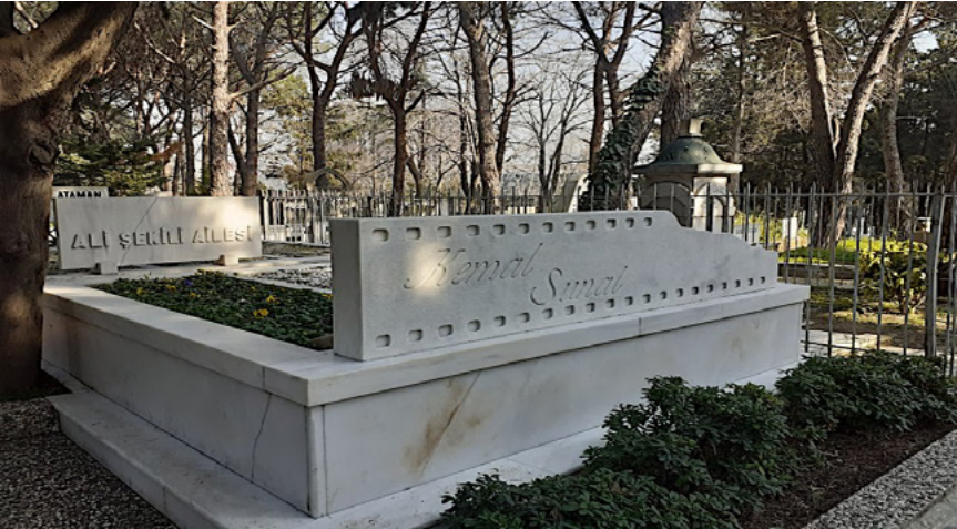
Foto 15. Sinema sanatçısı Kemal Sunal'ın Zincirlikuyu Mezarlığı'ndaki mezarı, oynadığı sayısız filme ve oyunculuk kariyerine atıfta bulunmak amacıyla film şeridi şeklinde tasarlanmıştır.

Aysel Gürel'in habitusuna uygun olarak tasarlanan mezar taşında da o meşhur gözlüklerine yer verilmiştir. Kızı Mehtap Ar üzerinde “Ne yıkılırım ne sökülürüm, bir çınar gibi göğe dururum” yazan mezar taşı için; “Annemin gözlükleri meşhurdu, biz de böyle bir şey yaptırmak istedik” demiştir. (URL-19).