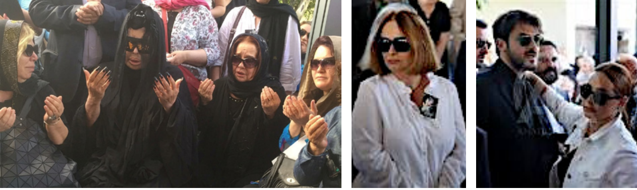
Foto 10. Oya Aydoğan’ın Teşvikiye camisindeki cenaze törenine katılan ünlülerin çekilmiş fotoğrafları Cem Yılmazın skecinde mizahi olarak dile getirmiş olduğu rayban gözlük, gözlüksüz alınmaz şeklindeki tespitlerini doğrulamaktadır.

Cenazeye katılanların önemli bir kısmı acıyı paylaşmaktan ziyade basına görüntü vermek, ertesi gün gazetelerde isminin haber içinde geçmesini sağlayarak cenaze törenlerinde toplumsal görünürlük görevini başarıyla yerine getirmek kaygısıyla hareket etmektedir. Geçtiğimiz yıllarda kaybettiğimiz, Oya Aydoğan ile ünlü müzisyen Özkan Uğur’un AKM’deki cenaze töreni ile ilgili basında “ünlüler akın etti” başlığıyla yer verilmiştir. (Foto.10.-11.)