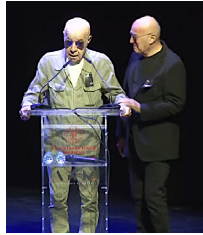
Foto 8. 10 Temmuz 2023 tarihinde vefat eden MFÖ grubundan Özkan Uğur'un AKM de düzenlenen cenaze töreninde tabutunun yanına kendisiyle özdeşleşen elektro gitarları konulmuştur. Grup üyesi, Mazhar Alanson; "Özkancım ele güne karşı yapayalnız, böyle de olmaz ki..." sözüyle konuşmasına başlamıştır. (URL-12)