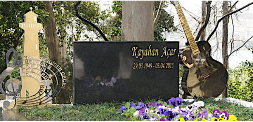
Foto 13. Türk pop müziğinin usta yorumcusu Kayahan'ın Kanlıca Mezarlığı'ndaki mezar taşı habitusunu yansıtmak üzere yapılmıştır.

Söz yazarı kimliğinin yanı sıra renkli ve eğlenceli kişiliğiyle bilinen Aysel Gürel 2008 yılının şubat ayında vefat etmiştir. Cenazesi diğer ünlülerde olduğu gibi habituslarına uygun olarak Teşvikiye Camii'nde kılınan cenaze namazından sonra Zincirlikuyu Mezarlığı'nda defin edilmiştir. Cenaze töreni de Aysel Gürel'in yaşadığı hayat tarzı gibi son derece renkli olmuştur.