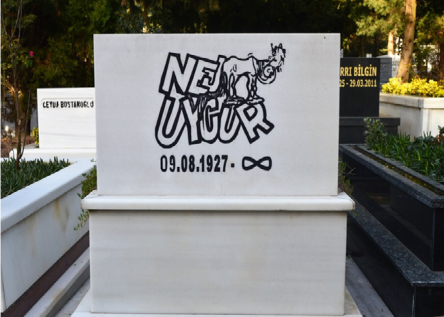
Foto 17. Türk tiyatrosunun ve mizahının usta ismi Nejat Uygur'un Zincirlikuyu Mezarlığı'ndaki habitusunu yansıtmak üzere tasarlanmış mezar taşındaki adı üzerinde bir kelime oyunu yapılarak ölüme mizahi bir boyut kazandırılmıştır.

Foto 16. Sinema sanatçısı Sadri Alışık ve eşi Çolpan İlhan'ın Zincirlikuyu Mezarlığı'ndaki kabirleri, film şeridi şeklinde tasarlanmış mezar taşlarıyla dikkat çekmektedir. Bu mezar taşlarında, Sadri Alışık ile özdeşleşen şapkanın işlendiği detaylar, sanatsal kimliğini ve kültürel sermayesini yansıtmaktadır.