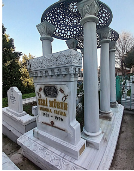
Foto.1: Habitüsüne uygun şekilde vefat eden isimlerden biri de Zeki Müren olmuştur. Aldığı bir ödülün ardından, sahnede ve onu sevenlerin yanında, ödül töreninden yalnızca beş dakika sonra hayata gözlerini yummuştur. Mezarı, Bursa Emir Sultan Mezarlığı'nda yer almakta olup, 'Sanat Güneşi' unvanıyla anılmasından dolayı yıldız ve güneşi simgeleyen süslemelerle dikkat çekmektedir.