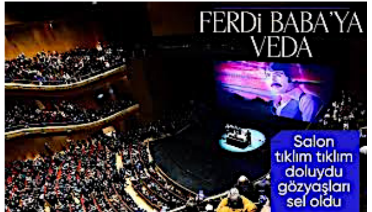
Foto.9: 2 Ocak2025' tarihinde 79 yaşında vefat eden, Arabesk müziğin efsane isimlerinden Ferdi Tayfur'un Türk bayrağına sarılı cenazesi, AKM' de düzenlenen törenin ardından, Levent Barbaros Hayrettin Paşa Camii'nde ikinci namazını müteakip kılınan cenaze namazının ardından Yeniköy Mezarlığı'nda toprağa verilmiştir. (URL-13)

Ünlülerin, sanatçıların ve sosyete kesimin cenaze törenlerinde dikkat çeken bir diğer önemli ayrıntı ölen kişiyi uğurlama yöntemleridir. Özellikle sanat camiasından vefat eden tanınmış isimlerin cenazesi AKM'den ya da cami bahçesinde uğurlanırken tabutunun alkışlanması Hz. Mevlana'nın; "Herkesin ölümü kendi rengindedir" sözünü tekrar, akıllara getirmektedir. Sanatıyla ve seyircinin alkışlarıyla yaşayan, alkışı seyircinin takdiri olarak gören sanatçılar, tüm yaşamlarında olduğu gibi ölümlerinde de alkışlarla uğurlanması; "bize sanatınla yaşattığın güzellikler adına" teşekkür ediyoruz anlamına gelmektedir.