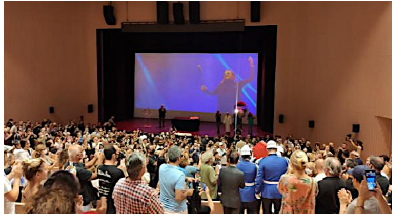
Foto 6. 29 Temmuz 2022 tarihinde vefat eden ünlü sanatçı İlhan İrem'in cenazesi vasiyeti gereği, AKM'ye getirilmiştir. Törende İlhan İrem'in şarkılarıyla hazırlanan kısa video gösterimi izletilmiştir. "Usta sanatçı için törende konuşmalar da yapıldı. Törende dostları da İlhan İrem'i anlattı. Konuşmaların ardından İrem'in naaş Bebek Camisinde kılınan cenaze namazının ardından Aşyan mezarlığında defin edilmiştir." (URL- 10)