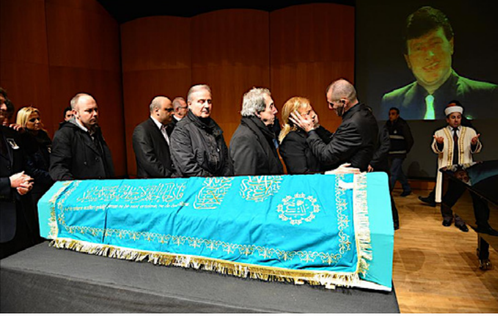
Foto 4. 28 Ocak 2013 yılında vefat eden Ferdi Özbeğen'in cenazesi önce Cemal Reşit Rey Konser Salonu'na getirilmiş burada tabutunun yanına piyanosu ve beyaz çiçekler habitusuna uygun olacak şekilde konulmuştur. Törenin sonrasında, Levent Camii'nde kılınan cenaze namazının ardından Ulus Mezarlığı'nda toprağa verilmiştir. (URL-8)