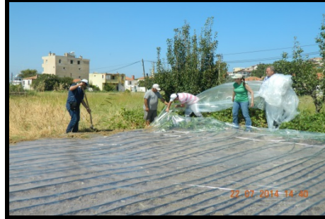
Şekil 2. Solarizasyon uygulamasından görüntüler