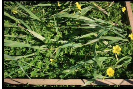
Şekil 1. Sürvey alanından görüntüler