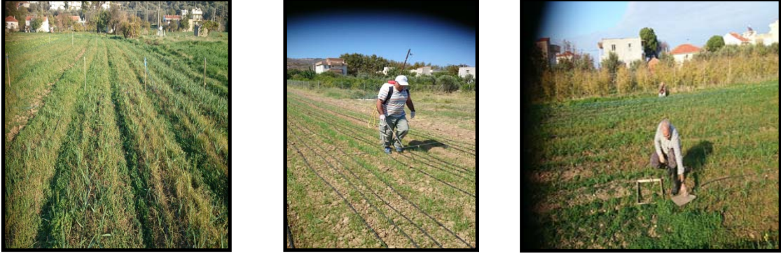
Şekil 3. Deneme alanından görüntüler Figure3. Images from experiment field

Deneme alanından hasat edilen yabancı otların yaş ağırlıkları alındıktan hemen sonra laboratuvara getirilmiş ve etüvde 70 °C'de 48 saat bekletilerek kuru ağırlıkları belirlenmiştir. Uygulamaların yabancı otların yaş ve kuru ağırlıklarına etkisini belirlemek için her uygulamadan elde edilen değerler kontrol parselleriyle