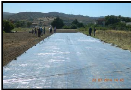
Figure 1. Images from survey area