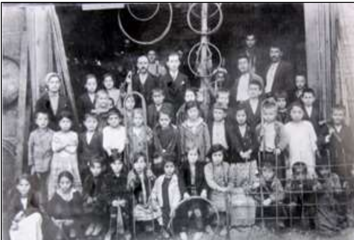
Foto-2: 1940'lı Yıllarda Tokat Meydan Semtinde Bir Demirci Dükkânı