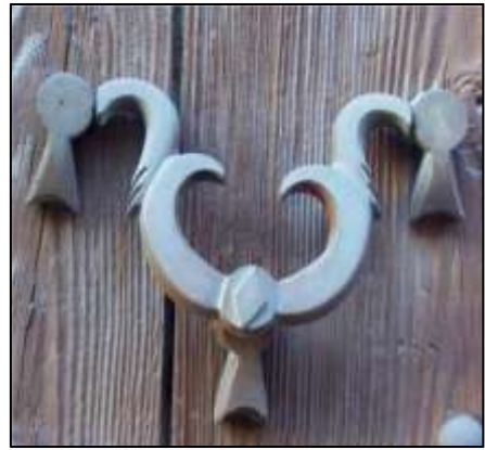
Foto. 8. Tokatta Mesleği Dokumacılık Olan Ailelerin Kapılarını Süsleyen, "Eli Belinde" Kilim Motifli Kapı Tokmaklarının tutacak kısmına işlenen Baklava Motifi öteden beri Mesleği Dokumacılık Olan Aileleri Temsil Etmektedir. (Kışla Mahallesi (Kale Dibi) Tokat 1999)