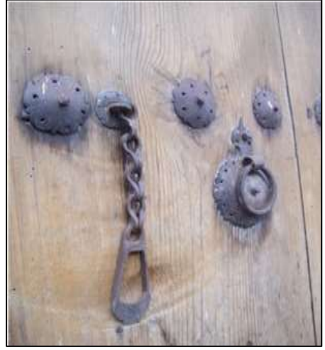
Foto-3: Tokatta Sacdan yapılmış, Orta Halli Ailelerin Evlerinin Kapısını Süsleyen "Kapi Şakşağı" (Üstte) ve "Zerze" (Altta) Örnekleri (Bey Sokağı / Kışla Mah. Tokat 1999).