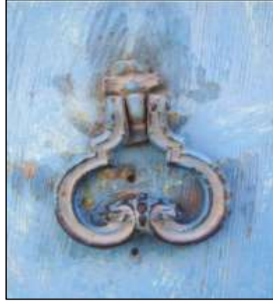
Foto-4: Tokatta hayvancılıkla uğraşan, hayvan sürüleri olan Ailelerin kapılarını Süsleyen “Koç Başı” Biçimli Tokmak Örnekleri. (Mutlu Özgen Arşivi -Horuç Mah. Tokat 1999)