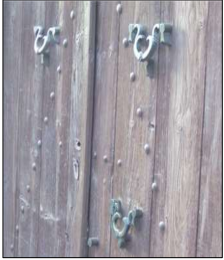
Foto-9: Tokatta Üç Tokmaklı Kapı Örnekleri (Fotoğraf: Mutlu Özgen Arşivi, Bey Sokağı Tokat 2001).