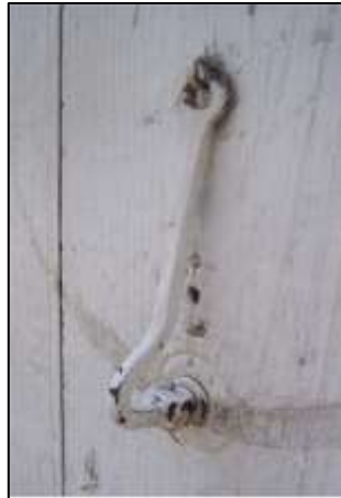
Foto-5: Tokatta Mesleği Doktor /Sıhhiyeci Olan ailelerin Kapılarını Süsleyen “Yılan” şeklinde stilize edilmiş Tokmak Çeşitleri (Bey Sokağı/Horuç Mah. Tokat 1999)