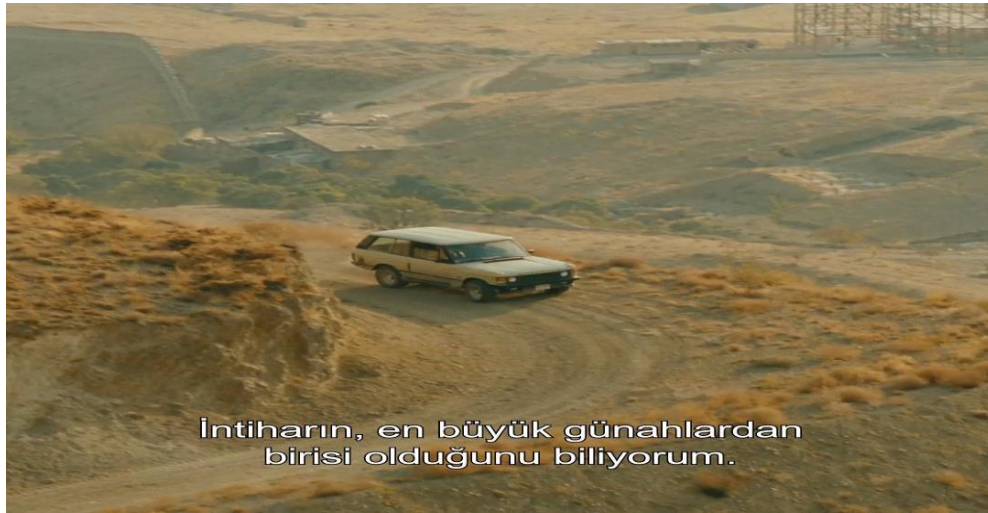
(Görsel 2 İkinci yolcu, ilahiyatçı)

Bedii ve Kürt askerinin bu kısa ama yoğun karşılaşması, yaşamın ve ölümün karmaşıklığını sade bir dille anlatır. Kiarostami, bu sahnede yalnızca çukurun fiziksel bir boşluk olmadığını, aynı zamanda karakterlerin içsel boşluklarını ve insanın kendi varoluşuyla yüzleşme cesaretini de temsil ettiğini ima eder. Bu basit görünen ama çok katmanlı anlatım, Kiarostami'nin minimalist sinema anlayışının güçlü bir örneği olarak öne çıkar.