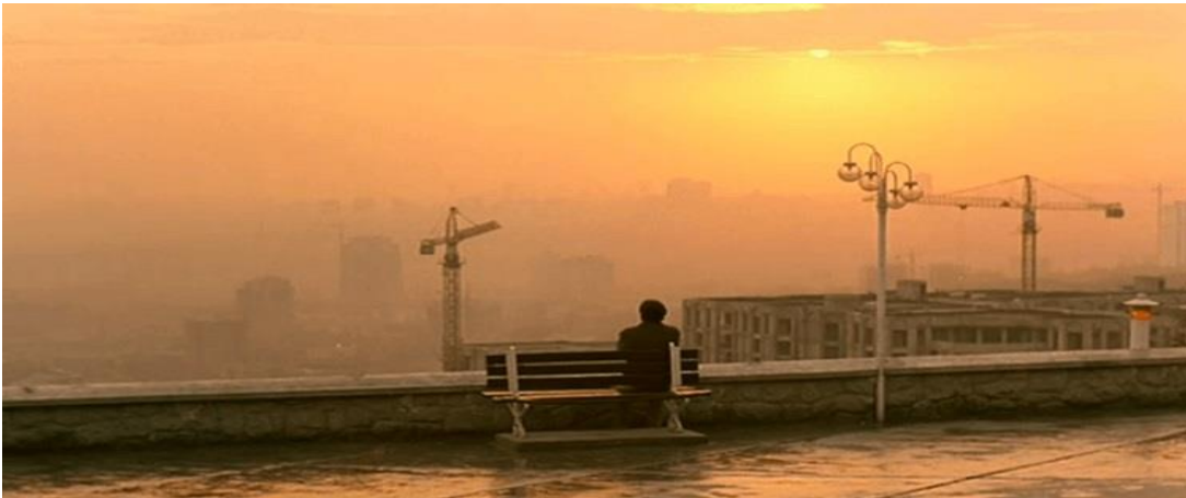
(Görsel 4 Yeniden uyanış.)

Kiarostami, bu sahnede minimalizmin estetik gücünü ustalıkla kullanır. Diyaloglar, sessizlik ve doğal görsellik, Bedii'nin içsel yolculuğunu inceliklerle işler. Geniş açılar ve sade kamera hareketleri hem karakterlerin yalnızlığını hem de onları çevreleyen dünyanın büyüklüğünü vurgular. Bu teknikler, izleyiciye yalnızca bir hikâye anlatmakla kalmaz, aynı zamanda insanın yaşamı, ilişkileri ve ölüm karşısındaki duruşunu sorgulatan derin bir deneyim sunar. Bakari ile olan bu karşılaşma, Bedii'nin yolculuğunda önemli bir dönüm noktasıdır. Bedii'nin yaşadığı dönüşüm, yalnızca bir karakter gelişimi değil, aynı zamanda insanın yaşamı ve ölümü anlamlandırma çabasında ilişkilerin ve küçük detayların nasıl büyük bir rol oynayabileceğinin güçlü bir örneğidir. Film, minimalist bir estetikle, izleyiciyi Bedii'nin dünyasına çeker ve onu kendi yaşamına dair sorular sormaya davet eder.