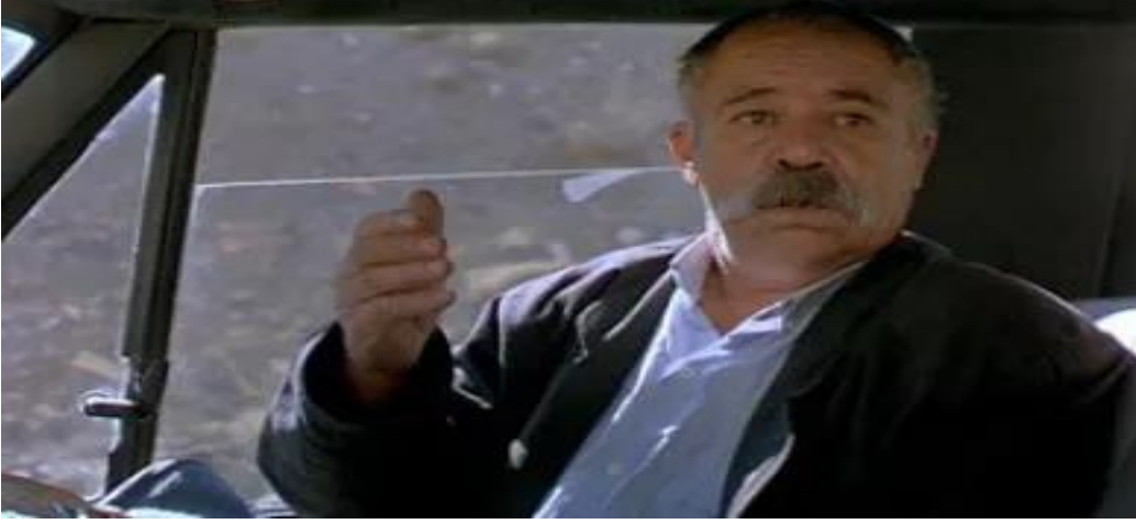
(Görsel 3 düşüncelerinde bir dönüşümün başladığı an.)

Bu karşılaşma, Bedii'nin yolculuğunun bir sonucu olmaktan çok, bu yolculuğun içinde derinleşen bir durak gibi işlev görür. Seyirci, Bedii ve ilahiyatçının konuşmalarında yalnızca iki farklı yaşam görüşünü değil, aynı zamanda kendi varoluşsal sorularını bulur. Bu minimalist sahne, yaşam ve ölüm üzerine büyük soruların sessizlik ve sadelikle nasıl işlenebileceğine dair Güçlü bir örnek sunar.