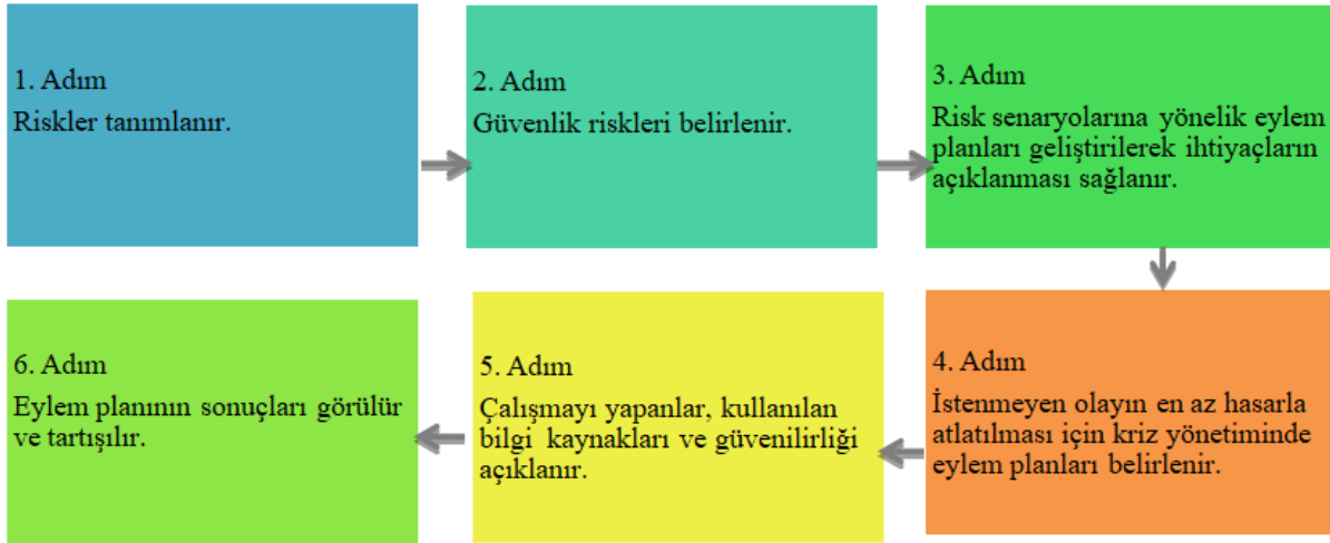
Şekil 2. Güvenlik ve Risk Açığı Modeline Göre Belirlenen Biyogüvenlik Adımları

Tarımsal alana yönelik saldırıların etkilerinin görülmesi zaman almaktadır. Bu nedenle, terör kaynaklarınca ilk tercih edilen yöntem olmadığı vurgulanmaktadır (Gill, 2015). Ancak biyolojik ajanların kolay elde edilmesi, henüz aşularının bulunmaması, hedef ülkenin ekonomisine ve gıda güvenliğine ciddi zararlar verme potansiyeli nedeniyle tercih edilmektedir (Chalk, 2004).