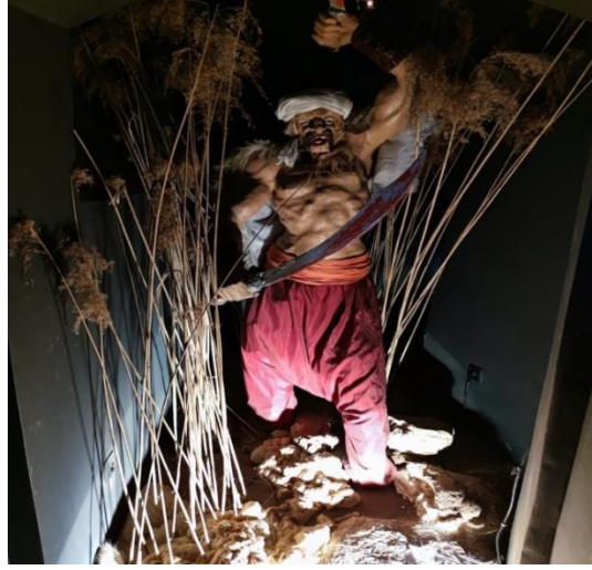
Görsel 5: Đurđevac kent müzesinde Osmanlı askeri betimlemesi.

Hırvatlar ise zekâ ve bilgelikleriyle kendilerinden kat kat üstün Osmanlı askerlerini yenen temiz ve masum bir halk olarak tasvir edilmektedir (Görsel 6). Đurđevac kentinde yapılan saha çalışması ve gözlemler esnasında kamu kurumlarının, cadde ve sokakların ve birçok işletmenin simgesinin horoz olduğu ve anıtsal yapılarda bu savaşın temsillerinin yoğun biçimde kullanıldığı görülmüştür. Đurđevac kent müzesinde ise kuşatmayla ilgili çizimlere ve sanatsal eserlere rastlanmaktadır. Farklı eserlerin ortak özelliđi, Osmanlı-Türk korkusundan beslenen bir düşmanlık ve kötülük figürüdür. Bunlara dayanarak, etkinliđin Hırvat ulusal birliđinin tesis edilmesine ve Hırvat kimliđinin oluşumuna katkı sađlayan bir icat olduğu iddia edilebilmektedir. Kurumsal anlamda ilk kutlama 1968 yılında yapılmıştır. Bir diđer ifadeyle, Đurđevac kuşatmasının tarihsel bir anlatı ve ulusal bir mit olarak kavramsallaştırılması, yakın bir dönemde gerçekleşmiştir bu yönüyle icat edilmiş bir gelenek olduğu anlaşılmaktadır. Hobsbawm'un ifadesiyle, 58 hem fiilen icat edilen, inşa edilen ve resmi olarak tesis edilen, hem de kısa ve tarihlenebilir bir dönemde -belki de birkaç yıl gibi- daha az takip edilebilir bir sürede ortaya çıkan ve büyük bir hızla yerleşen gelenekler, icat edilmiş olarak değerlendirilir. "İcat edilmiş gelenek", normalde açık veya gizil olarak kabul