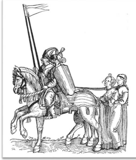
Görsel 2: Krbava Savaşı'ndan sonra savaş esiri olarak köleleştirilen Hırvat kadınları betimleyen bir temsil 36

Krbava Savaşı, Osmanlı birlikleri ile Hırvat soyluların oluşturduğu kalabalık bir ordu arasında gerçekleşmiştir. Savaşın gerçekleştiği bölgede Osmanlı Devleti'nin düzenli-klasik bir ordusu yoktur. Onun yerine atlı birliklerden oluşturulmuş hareket ve manevra kabiliyeti yüksek bir birlik vardır. Osmanlı birliği, askerî becerileri sayesinde sayıca kendisinden çok daha kalabalık olan Hırvat ordusunu kesin bir yenilgiye uğratmıştır. Savaşın sonu Hırvat Krallığı yıkılmış, birçok Hırvat soylusu hayatını kaybetmiş ve çok sayıda Hırvat asker esir düşmüştür. Bu sebeple savaşın etkileri 15. yüzyıldan itibaren Hırvat toplumunun askerî ve politik söyleminde, edebiyat ve halk anlatılarında travmatik etkileri olan bir savaş olarak önemli bir yer