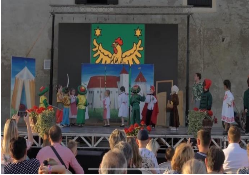
Görsel 3: İlköğretim öğrencileri tarafından Đurđevac Kuşatmasının sahnelenmesi 54

Tarihsel kaynaklara ve anlatıya göre, 1552 yılında Osmanlı ordusu Đurđevac kalesini kuşatmıştır. Osmanlı ordusunun başında ise Ulema Bey adında deneyimli ve yaşlı bir komutan vardır. Ulema Bey, çok kalabalık bir orduyla Đurđevac ve çevresini ele geçirmek istemektedir. Çünkü Đurđevac ve çevresi Viyana'ya giden güzergâhta önemli bir konuma sahiptir. Ulema Bey, küçük bir kaleden ibaret olan Đurđevac Kalesini rahatlıkla ele geçirebileceğine inanmıştır. Kalenin etrafını kalabalık bir orduyla kuşatır ve kaleyi yoğun top atışına tutar fakat günler geçmesine rağmen Đurđevac halkı, kaleyi her fırsatta onarır ve kendi imkânlarıyla karşılık vermeye çalışır. 55 Ulema Bey, kaleyi ele geçirememesinden ötürü aşırı derecede öfkelenmiştir ve Đurđevac Kalesini, içindeki insanlar açlıktan ölünceye kadar kuşatma altında tutmaya karar vermiştir. Kalenin içinde bulunan Đurđevac halkı, zor koşullar altında olmasına ve açlık çekmesine rağmen kaleyi savunmaya