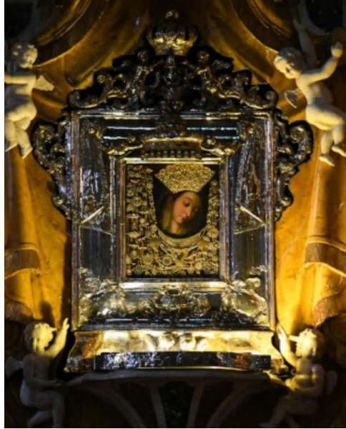
Görsel 7: Gospa Sinjska - Meryem Ana'yı temsil eden tablo

Tarihsel kayıtlara ve halk arasında dilden dile aktarılan anlatıya göre, 1715 yılında 60.000 Osmanlı ordusu, Sinj kentini kuşatma altına alır fakat rahip İvan Grçiç komutası altındaki 700 kişi civarındaki Sinj sakinleri teslim olmayı reddeder. Bunun üzerine Osmanlı ordusu kenti çevreleyen surları günlerce yoğun top atışına tutar, ardından kalabalıklar halinde kente saldırır fakat Sinj kentini ele geçirmez. Bu arada kent halkı, Meryem Ana'nın resmedildiği bir tablonun (Görsel 7) yer aldığı manastırda toplanmış ve dualar etmektedir. 63