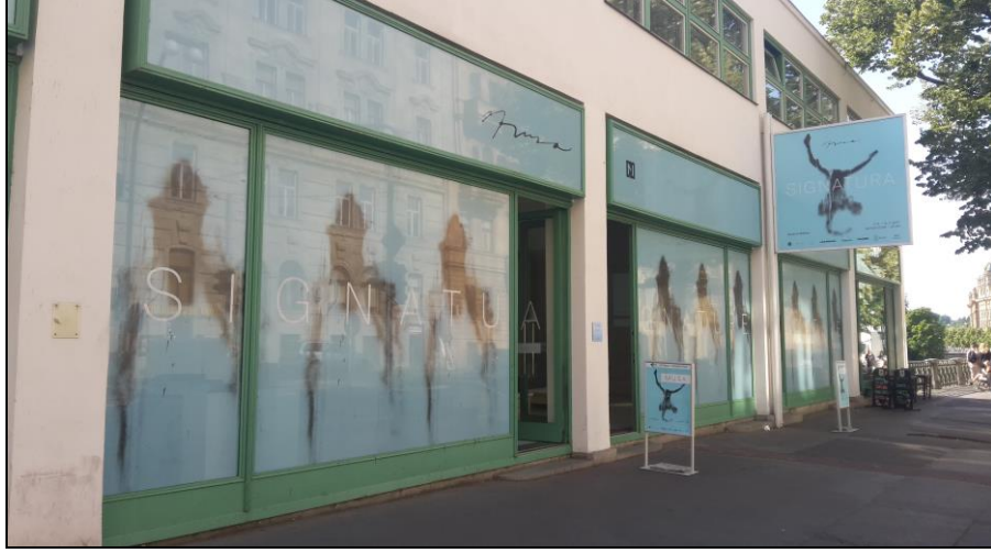
Resim 8. Manes Galeri . Dış Cephe. Prag-Çekya.

Dövme konusundaki üslubunu resimsel satırlara aktarma çabası olan bu çalışmalar ilkin deneysel çerçevede ilerlemiştir. Başarı kazanan yapıtlar ilk kişisel sergisinin yolunu açmıştır. 2015 yılında Ales Güney Bohemya Galeri 'de açılan sergi onun plastik sanatlar mecralarındaki öncül boy gösterişi olmuştur. 25 Bu sergiyi izleyen yıl Prag'da Pro Art Galeri 'de bir etkinlik daha hazırlamıştır. Musa vs. Jaqr isimli bu etkinlik de pozitif eleştiriler alınca sonraki adımda İmza sergisi için Manes Galeri ile çalışmıştır.