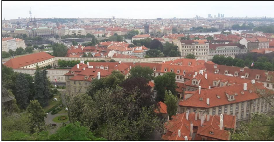
Resim 1. Çeklerin sosyo-kültürel gelişimleri ve ülkenin günümüz plastik sanatlar mecralarındaki yerini kavrayabilmek için yapılan bu araştırma 2017 yılında, Prag kent merkezinde gerçekleştirilmiştir. Prag-Çekya.

İkinci başlıkta ise Çek sanatının belirttiğimiz siyasi süreç içindeki dönüşümüne etki eden konular irdelenmiştir. Ülke sanatının 20.yy sonrasındaki serüvenini içeren kısım, A. Mucha gibi diğer Çek sanatçılardan da söz ettikten sonra L. Musil ve üretimleri ile sonlandırılmış, sonuç bölümünde de genel bir değerlendirme yapılmıştır.