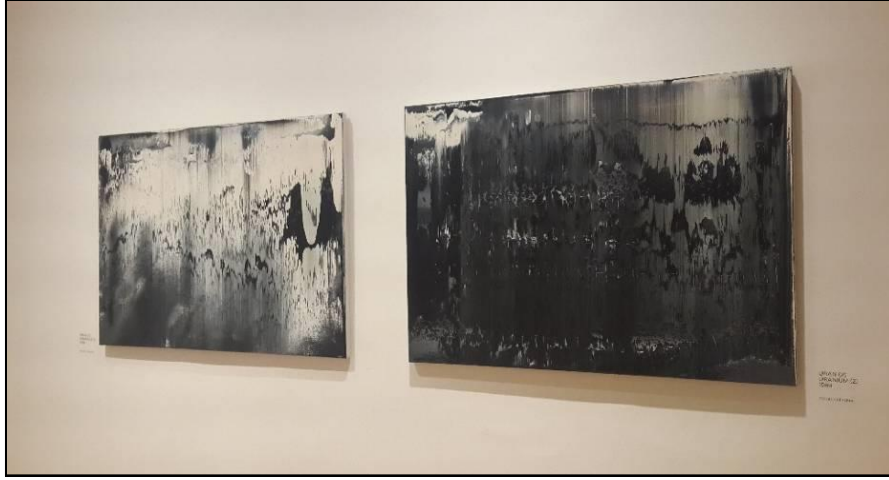
Resim 7. Prag Ulusal Sanat Galerisi, G. Richter Retrospektifi. Sergi Salonundan Kesit. (Sanatçının 1989 tarihli Uranyum 1-2 isimli çalışmaları) Prag-Çekya.