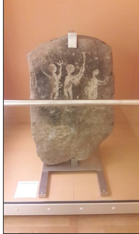
Resim 10. Almanya'daki Hannover Şehir Müzesi koleksiyonunda primitif sanata referans olabilecek önemli nesnelere barındırmaktadır.

Şaman kültüründe de yeri bulunan bu nesnelere, günümüzde L. Musil 'in anahtar kelimeleri olan doğa ve hayvan imgeleri ile özdeşleşmiş durumdadır. Dolayısıyla İmza sergisindeki yapıtlarında “primitif” silüetlerinden yararlanan sanatçıyı; arayışını şekillendirirken primitif