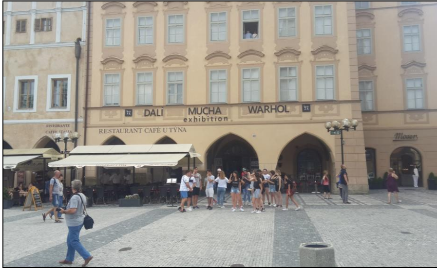
Resim 6. Andy Warhol (1928-1987), Salvador Dali (1904-1989) ve A. Mucha'nın yapıtlarına ev sahipliği yapan Prag Sanat Galerisi. Dış Cephe. Prag-Çekya.

ilke edinmiştir. Aynı yaklaşım FUTURA Çağdaş Sanatlar Merkezi için de geçerlidir. 2003 yılında faaliyete geçen bu merkez sunduğu geniş sergileme alanının haricinde, Birleşik Devletlerde çalışma olanağı tanıyan "sanatçı değişim programları" organize etmektedir. Yıllık periyotlarda uzun soluklu sayılabilecek sergiler açan Leica Galeri ise etkinliklerine 2002 yılında başlamıştır. Daha çok fotoğraf disiplinine dair yapıtlar sergileyen kurum günümüz sanatçılarından seçkiler sunmayı ve Orta Avrupa'daki sanat fuarlarında devamlılık teşkil edecek şekilde yer almayı kendine misyon edinmiştir. Dvorak Sec Galeri 'de benzer bir çizgiyi izlemektedir. Kapılarını 2005 yılında açan galeri güncel üretime şans tanırken uluslararası düzeyde organize ettiği karma sergiler eşliğinde Çek halkına yeni sanat seçkileri sunmaktadır. Saydığımız galeriler Çekler için önemli sanat platformlarıdır. Fakat daha geniş hacimli olan iki sanat kurumundan da söz etmemiz gerekir. İlki Prag Sanat Galerisi 'dir.