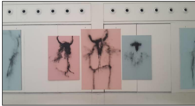
Resim 14. L. Musil. "İmza" isimli sergiden. Manes Galeri. İç Mekân/Sergi Salonu, Kesit 4. Prag-Çekya.