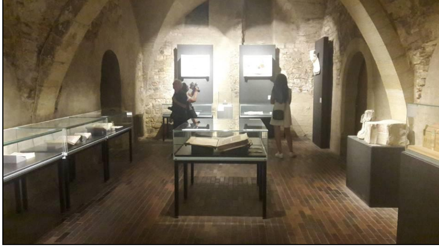
Resim 2. Charles Üniversitesi bugün tüm köklü tarihini Prag şehrindeki Karolinum çatısı altında kalıcı bir sergi ile göz önüne sermektedir. Prag-Çekya.

Yaşananlar Çek halkının hafızasında silinmez izler bırakmıştır. Ancak bunlardan ulus-toplum bilincine en fazla zarar vereni Nasyonal Sosyalistlerin muharebe yıllarında ülkedeki eğitimi sekteye uğratması olmuştur. Konu Orta Avrupa'da akademik araştırmalar hususuna en köklü okullardan biri olan Charles Üniversitesi 'ne parantez açarak açıklanabilir.