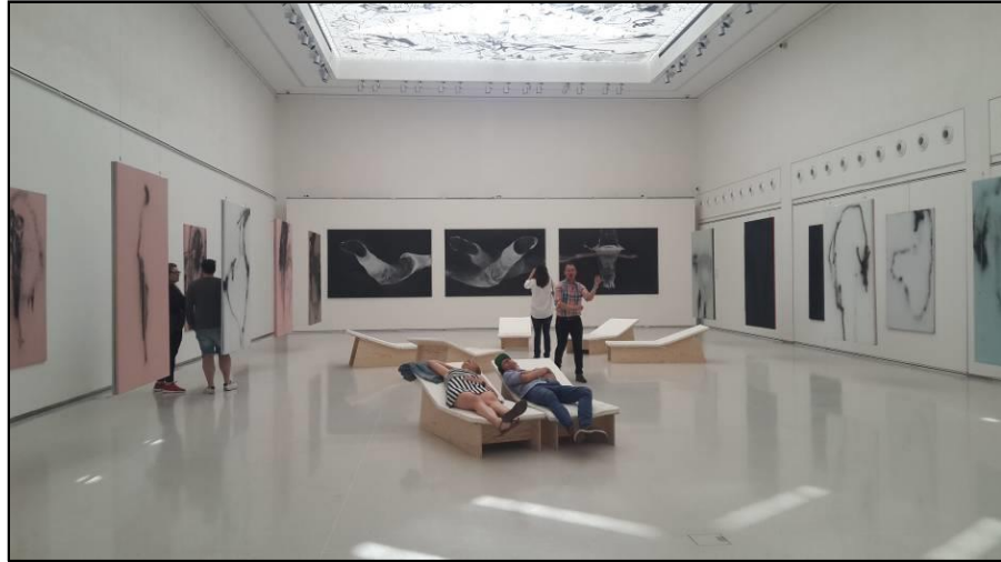
Resim 9. L. Musil. "İmza" isimli sergiden. Manes Galeri . İç Mekân/Sergi Salonu, Kesit 1. Prag-Çekya.