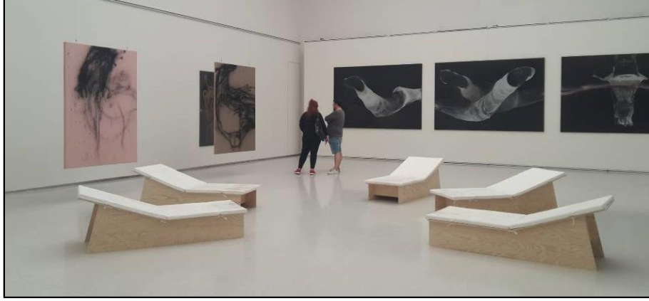
Resim 12. L. Musil. "İmza" isimli sergiden. Manes Galeri. İç Mekân/Sergi Salonu, Kesit 2. Prag-Çekya.