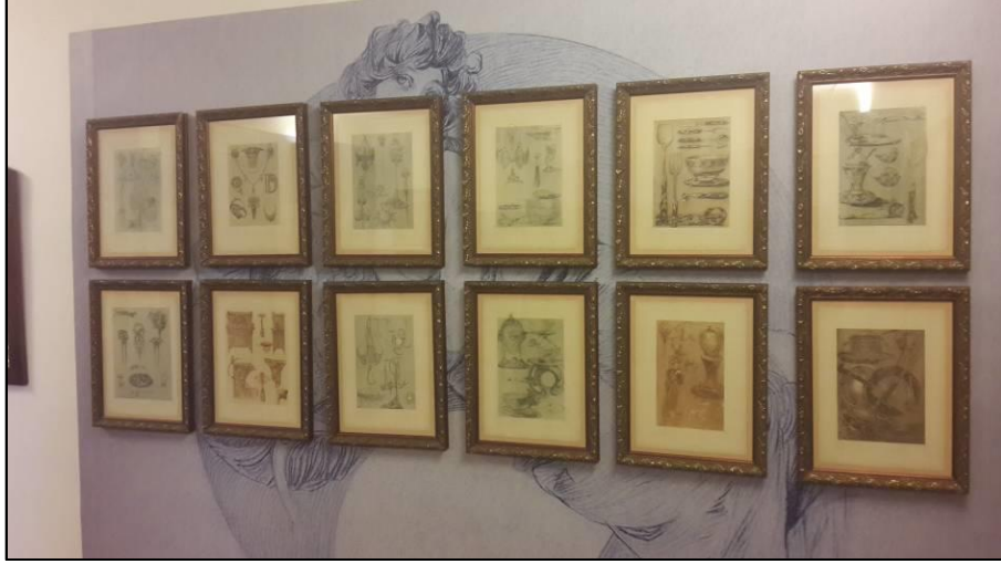
Resim 4. A. Mucha 'nın yapıtlarının bir kısmı ve kişisel eşyalarından örnekler Prag'da Prag Sanat Galerisi 'nde sergilenmektedir. Prag-Çekya.

Doğduğu yıllarda yaşadığı bölge Avusturya-Macaristan İmparatorluğu 'nun bir parçası olan A. Mucha Orta Avrupa'nın yeni sanat 20 üslubuna dâhil edilen bilindik sanatçılarından biridir. 21 İlk akademik resim derslerini 1885 yılında Münih'te alan A. Mucha , 1887-88 yıllarında Paris'e geçmiş ve şehrin ünlü sanat okullarından Julian ve Colarossi akademilerine kayıt olmuştur. Lakin bir yıl kadar sonra finansal problemler yaşamaya başlamıştır.