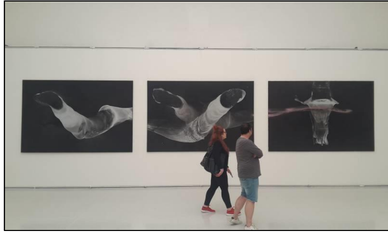
Resim 13. L. Musil. "İmza" isimli sergiden. Manes Galeri. İç Mekân/Sergi Salonu, Kesit 3. Prag-Çekya.