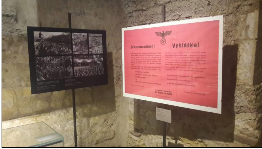
Resim 3. Karolinum çatısı altındaki sergide sürece dair önemli belge ve nesnelere yer almaktadır. Görselede Nasyonal Sosyalistlerin 1939 yılının Kasım ayında tüm Çek üniversitelerinin kapatıldığını ilan ettiği poster yer almaktadır (Sağdaki Kırmızı Poster). Prag-Çekya.

Devamında ülkeden ayrılan topraklar yeniden bütünleşmeye başlamış, Orta Avrupa'da Çeklerin merkezde olduğu birleşme esaslı adımlar atılmıştır. Lakin Prag'da savaştan sadece üç yıl sonra iktidarlığı komünist parti devralmıştır (1948). Bu gelişme ile Çekler Doğu Bloğu içine dâhil olmuş, hükümet iç ve dış politikalar konusunda Sovyetler ile uyumlu bir çizgiyi takip etmiştir.