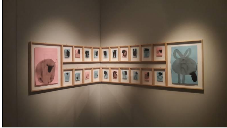
Resim 15. İmza sergisinin hazırlanma aşamasında görev alan kişi ve kurumların tamamı Çekya vatandaşsıdır/merkezlidir. L. Musil. "İmza" isimli sergiden son kare. Manes Galeri. İç Mekân/Sergi Salonu, Kesit 5. Prag-Çekya.