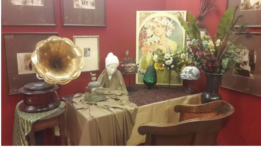
Resim 5. A. Mucha'nın Prag'da Prag Sanat Galerisi'nde sergilenen atölye kurgusu ve fotoğrafları. Prag-Çekya.

A. Mucha'nın İkinci Dünya Savaşı'nın hemen öncesinde maruz kaldığı bu baskı daha önce bahsettiğimiz Charles Üniversitesi'nde yaşanan olayların sanatsal ayağı için küçük bir örnektir. Öyle ki onun haricinde kalan ve işgal altındaki Çek topraklarında faaliyet gösteren diğer sanatçılar da ya üretimlerine ara vermek durumunda kalmış ya da sorguya (veyahut öğrencilerde olduğu gibi kamplara) gönderilmiştir. 23