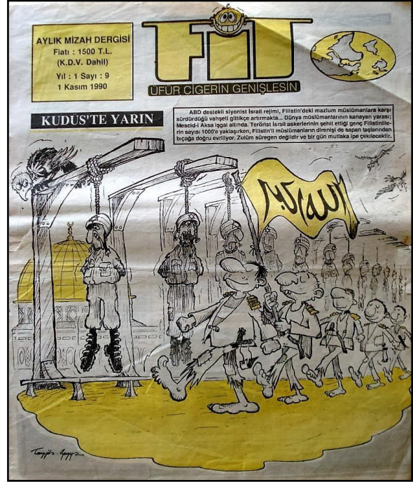
Şekil 1 - Fit, Sayı 9.

1990 yılında İzmir merkezli çıkmaya başlayan ve 11 sayı yayınlanabilen Fit dergisi (Şekil 1), “Şahısların ve kurumların putlaştırılmalarına karşıyız. Tüm bunları ‘yeni putlar koymadan’ yıkmaya çalışacağız.” şiarıyla yola çıkmış bir dergidir. Derginin bütün İslami dergilerde ortak olarak sayabileceğimiz Amerika ve İsrail düşmanlığı üzerine çizilmiş birçok karikatürün yanı sıra siyasi karikatürlerin genel ağırlığını türban sorunu, Kemalist algı, Filistin sorunu gibi konular oluşturmaktadır. 12 Eylül ve darbe karşıtlığı üzerine çizilen karikatürlere de yer verilmesi dikkat çekicidir.