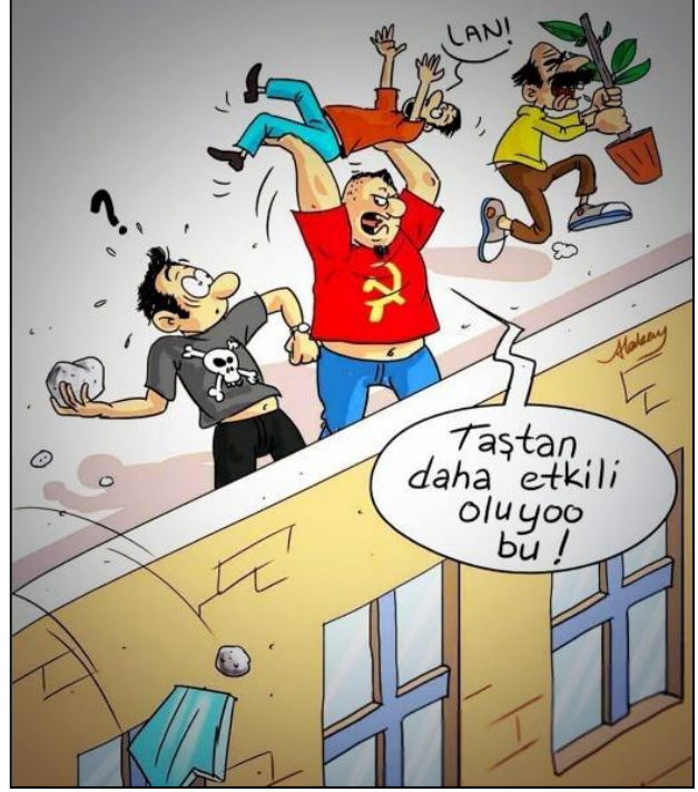
Şekil 8 - Cafcaf, Sayı 56.

Ahmet Atakan'ın ölümü üzerine çizilen bir karikatür (Şekil 8) AKP ile olan söylemsel birlikteliğin çok açık bir tezahürü olarak okunabilir. Derginin 56. sayısının kapağında görünen rabia işaretinden 17 Aralık sonrası Samanyolu TV'nin önünde yapılan ve göstericilerin kapıları zorladığı, bayrakları indirdiği eylemin ön figürlerinden birinin Asım Gültekin olmasına; 78 gün süren TEKEL direnişi ile ilgili direnişin son günlerine kadar tek