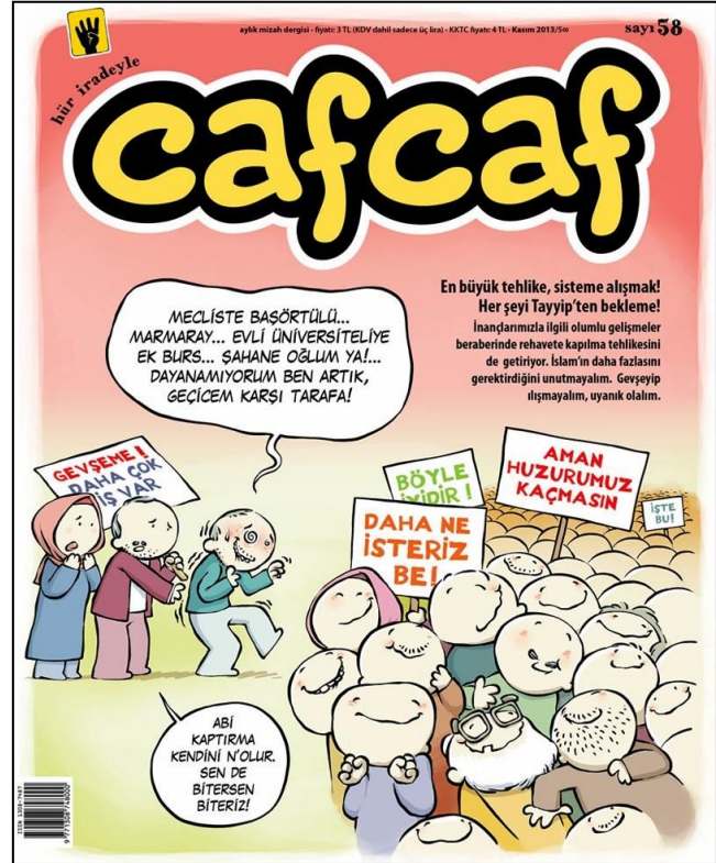
Şekil 9 - Cafcaf, Sayı 58.

İslam'ın tasvirle ilgili yorumlama farklılıklarından ötürü yaşadığı bocalama, görsel mizahın İslami toplumlar içerisinde köklenmesinde büyük bir engel teşkil etmiştir. İslam'ın gitgide asık yüzlü ve katı bir hal almasında bu bocalamanın etkili olduğu görüşü ileri sürülebilir. Fakat özellikle günümüzde Siyasal İslam diye kavramsallaştırılabilecek hareketin mizahı bir kalıba sokma ve dava uğrunda kullanılabilir bir araca dönüştürme potansiyelinin, özellikle halk kültürü içinde kendi kendine yeşeren mizahi figürleri budayarak kuralları olan bir 'İslami mizah' kavramı yarattığını söyleyebiliriz. İslami mizah kavramı bu yüzden politik