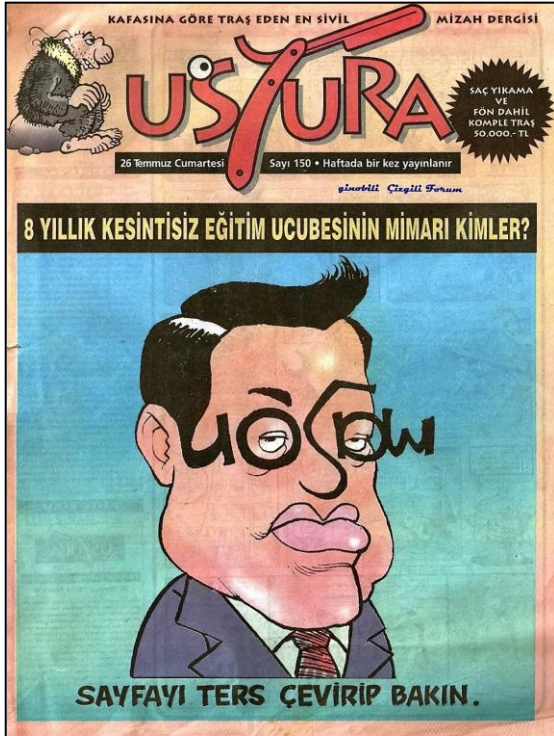
Şekil 4 - Ustura, Sayı 150.

yaratıldığı ve bu dergilerde mizahın kendisinin gittikçe araçsal bir yaklaşımla ele alınmaya başlandığını söylemek mümkündür.