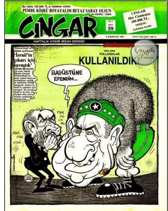
Şekil 3 - Cıngar, Sayı 39.