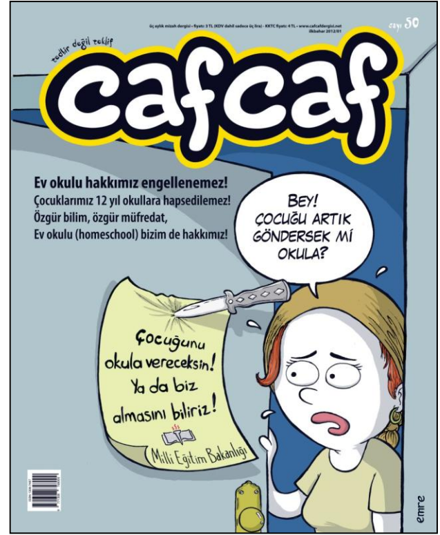
Şekil 5 - Cafcaf, Sayı 50.

fakat öncesinde çalışmanın yöntemi hakkında birkaç söz söylememiz gerekir. Yukarıda da kısmen değindiğimiz gibi, İslami mizah dergilerinin üzerine çok sınırlı tez çalışmaları vardır. Bunun dışında Cafcaf üzerine İren Özgür'ün (2012) bir makalesi ve Duygu Özsoy'un (2011) bir bildirisi yayınlanmıştır. Ayrıca Cantek ve Gönenç'in (2011)