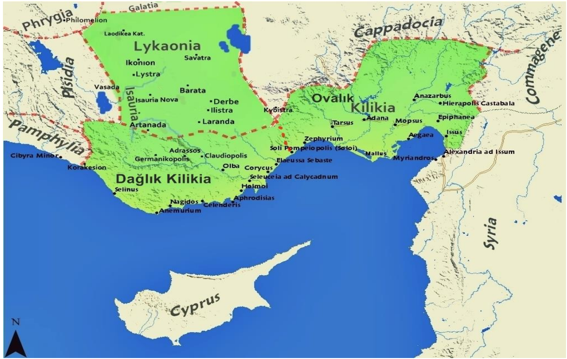
Harita-1: Lykaonia ve Kilikia Bölgeleri (Bardakcı 2017, Harita 2'den alınmıştır.)