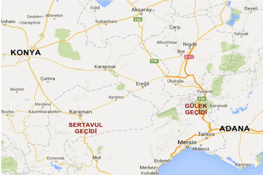
Harita-3: Geçitler( https://maps.google.com adresinden yararlanılmıştır.)

Sertavul Geçidi günümüzde olduğu gibi tarih boyunca da çok kullanılmıştır. Öyle ki Frig kralı Midas Torosları bu geçitten geçerek, Silifke civarında, Asur kralı II. Sargon ile savaşmıştır. Bu savaşın ardından yenilen Midas büyük ihtimalle aynı geçidi kullanarak Konya Ovası'na kaçmıştır. Aynı şekilde Pers kralı Kyros'un Kunaksa'ya düzenlediği seferde, kendisine yardım eden Kilikia kraliçesini, komutanlarından Menon'u görevlendirerek Sertavul Geçidi ile ülkesine göndermiştir. Kyros ise Gülek Geçidi'ne yönelmiştir. Kilikia kraliçesinin daha kısa olan yoldan gönderilmesine rağmen, Kyros'un yolu uzatmasının sebebi, Sertavul üzerinden geçmeyi kendisi için riskli bulması olarak değerlendirilebilir 21 . Ayrıca Septimus Severus, Niger'e karşı Torosların savunmasını yıkmak için yaptığı seferde, Gülek Boğazı yerine Sertavul Geçidi'nden geçerek Kalykadnos (Göksu) Vadisi'ne gelmiştir (MS 194). Severus, Sertavul Geçidi'nden geçtiği sırada Germanikopolis (Ermenek) yakınında bulunan Athena mabedinde, Severus zafer alayının kutlamaları yapılmıştır 22 .