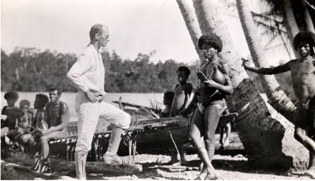
Malinowski'nin Günlüğü'nden: 12 Kasım 1917.

“Spiller’in yerine banyo almaya gittim. Enkaz gemilerden ve kızamıktan konuştuk. Sonra adanın etrafında yürüdüm. Çok insan vardı. Oğlanlar hindistancevizi yiyor ve flüt çalışıyorlardı. Yarı medenileşmiş Samarai yerlileri bana itici ve yavan geliyorlar. Onlarla çalışmak için en küçük bir arzu duymuyorum” (1988, s. 111-112).