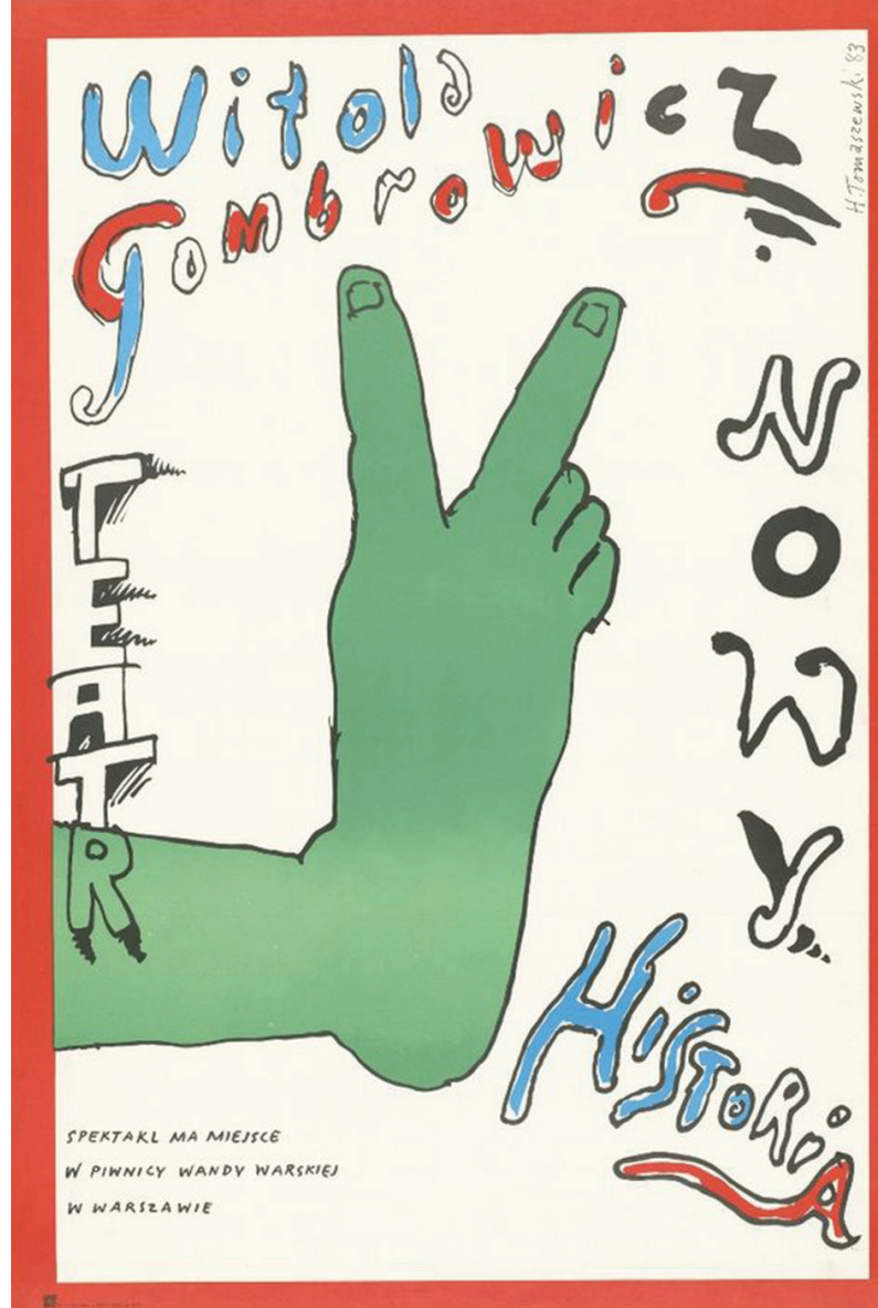
Resim 4. Henryk Tomaszewski - "Historia" Witold Gombrowicz ( https://www.pinterest.co.uk/leocogneau/the-polish-poster-style/ )

Kızılay Afişi, Görey'in Kızılay kurumuna dikkat çekmek ve halkı bilinçlendirmek adına tasarladığı sosyal afiş çalışmasıdır (Resim 1). Afişte giysisi olmayan, üzerinde Kızılay'ın sembolünün bulunduğu örtü ile örtülen küçük kız çocuğunun bir kadına sarıldığını görmekteyiz. Tasarımda korunmaya muhtaç olan ve üşüyen kız çocuğuna anne şefkati ile yaklaşan bir kadın figürünün kullanılması, Kızılay kurumunun muhtaç kişileri sahiplendiğini ve duyarlılığını belirtmektedir.