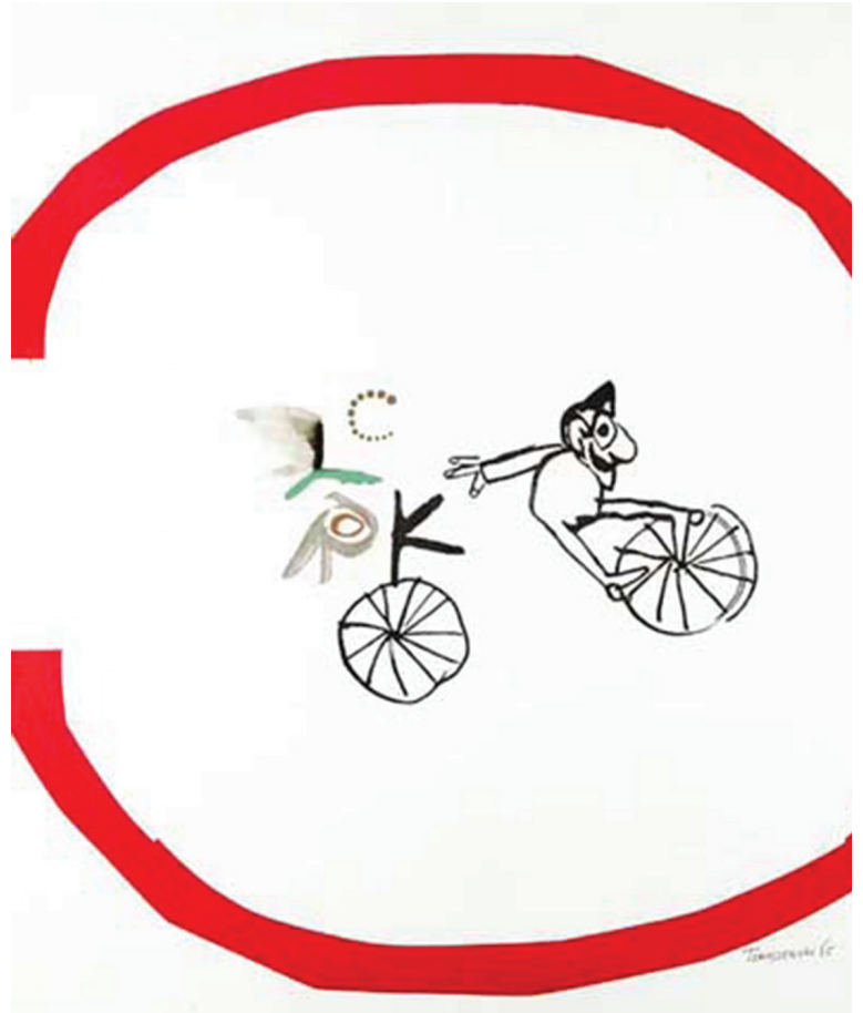
Resim 6. Henryk Tomaszewski - Circus 1965

karakterler, afişlerine sıra dışı bir hareketlilik ve eğlence katmıştır. Circus afişinde el çizimi ile yapılmış "Unicycle" olarak anılan tek tekerlekli bisiklet üzerinde gülerek eğlenen erkek figürü ve tipografik karakterler altında tek başına bir tekerlek çizilmiştir (Resim 6). Beyaz zemin üzerindeki sade ve çizgisel kompozisyonu çevreleyen, gözün ilk algıladığı renk olan kırmızı daire dikkat çekmiş ve odak noktası oluşturmuştur. Sanatçının tasarımlarında kullandığı soyut, serbest, karmaşık ifade teknikleri, açıkça siyasi konulardan uzak duran sanatçının bazı eleştirel düşüncelerini tasarımlarının içerisine gizlemiştir.