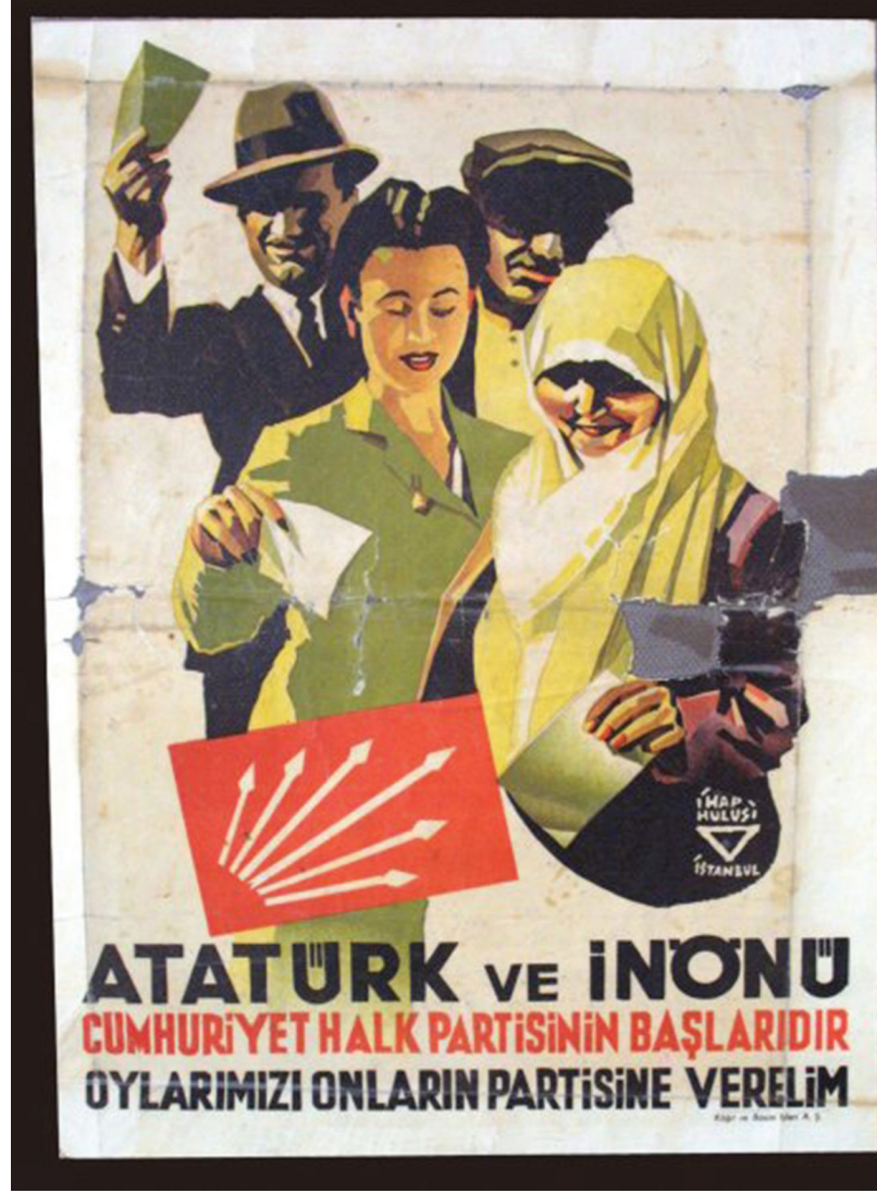
Resim 2. İhâp Hulusî Görey - Chp Afişi

Polonya'da ise yapılanma süreci düşünce ve ülkü açısından Türkiye ile benzerdir, ama tasarım sürecinde farklılıklar bulunmaktadır. Tarihsel olarak her iki ülkenin kesiştiği en önemli dönem I. Dünya Savaşı'dır. Ancak II. Dünya Savaşı sonrası yaşananlar, Polonya açısından çok keskin ve belirleyici özellikler taşımaktadır.