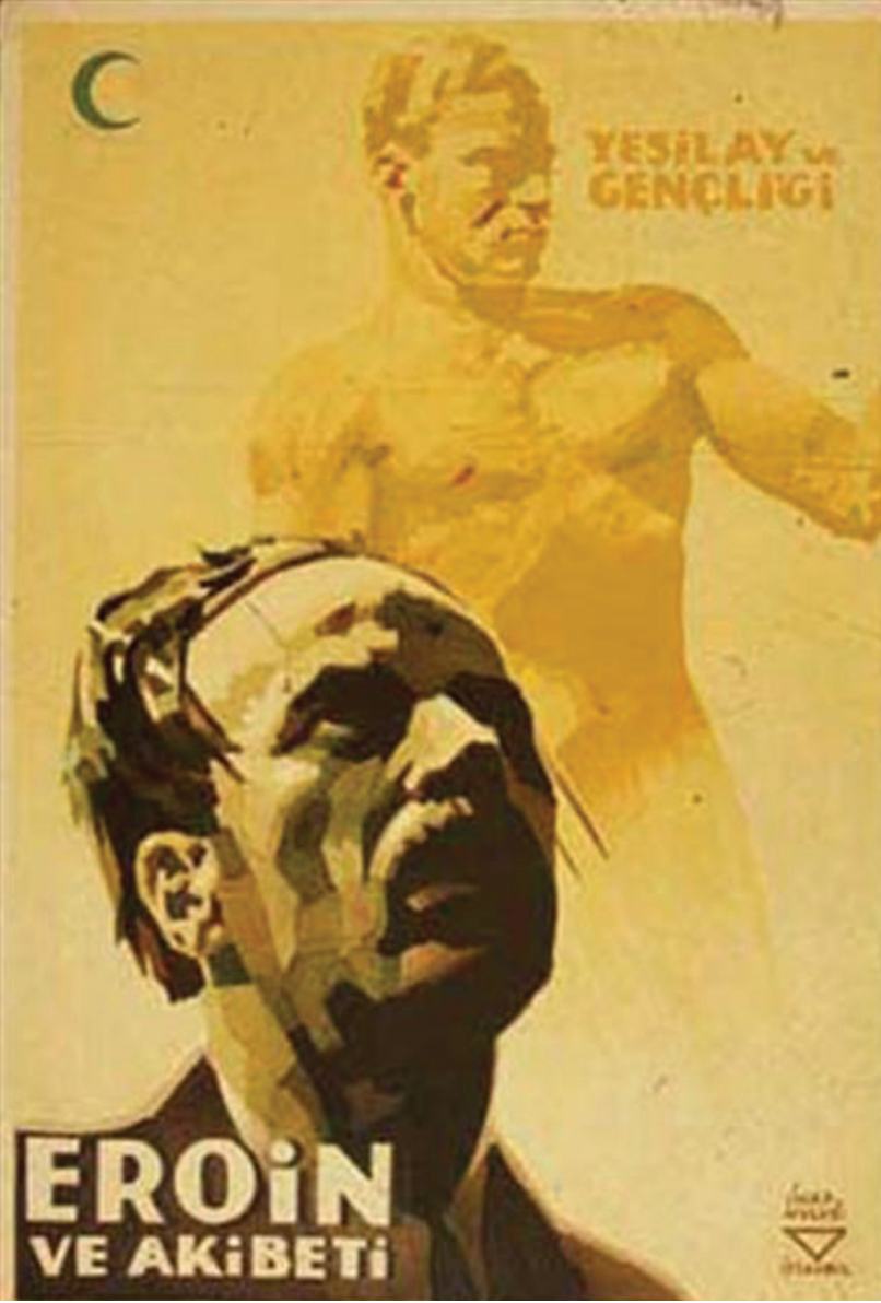
Resim 3. İhap Hulusi Görey - Yeşilay Afişi

( https://www.ntv.com.tr/galeri/sanat/afislerle-cumhuriyet-tarihi )