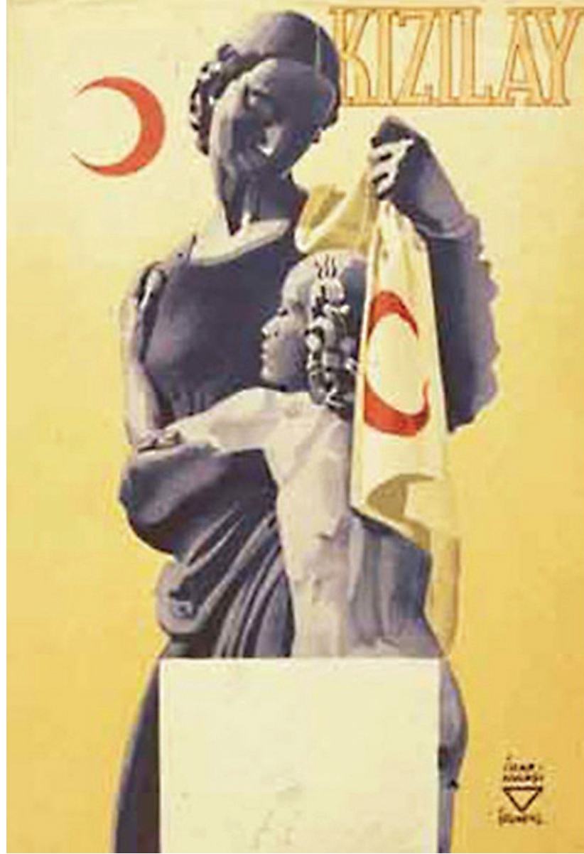
Resim 1. İhap Hulusi Görey - Kızılay Afişi ( http://vektorelcizim.net/turk-grafik-sanatinin-kurucusu )

Kültürel afişler, sanatsal ve kültürel konuları işleyen, "festival, seminer, sempozyum, balo, konser, sinema, tiyatro, sergi ve spor gibi kültürel etkinlikleri tanıtan afişlerdir" (İncearı, 2015:16). Bu afişlerde halkı sanatsal ve kültürel etkinliklere yönlendirmek, aynı zamanda ilgi çekici tasarımlar ile bu etkinlikleri halka sevdirmek amaçlanmıştır. İçerik, doku ve renk bakımından diğer afişlere oranla daha zengin olan tiyatro ve sinema afişlerini tasarlayan sanatçılar daha özgür ve özgün tasarımlar üretebilmişlerdir. Ekonomik kaygısı bulunmayan kültürel afişler, ticari afişlerden özgür olabilme özelliği ile ayrılmıştır. Fakat günümüzde sinema sektöründe oluşan rekabetler, bu afişlerin az da olsa ticari kaygı taşımasına sebep olmuştur.