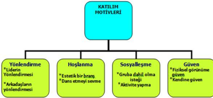
Şekil 1. Yarışma öncesi günlük ve görüşme ile ilgili değerlendirmelerden elde edilen katılım motivleri ile ilgili kodlar ve temalar

Araştırmada katılımcılar için iki durum analiz edilerek temalar ortaya konmuştur. Yarışma öncesi sportif okul takımlarına katılım sebepleri, beklentileri ve karşılaştıkları problemler ve yarışma sonrası katılım amacına ulaşip ulaşılmadığı ve karşılaşılan problemlerin mevcut durumu incelenmiştir.