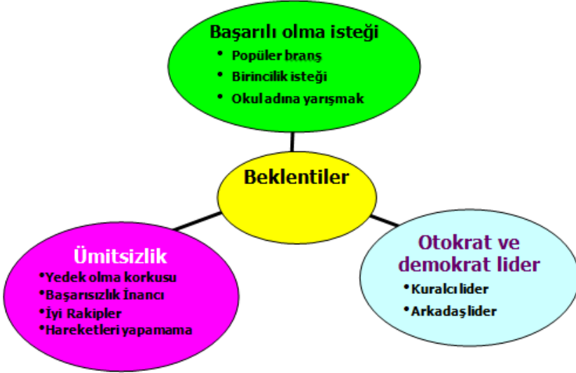
Şekil 2. Yarışma öncesi günlük ve görüşme ile ilgili değerlendirmelerden elde edilen katılım beklentileri ile ilgili kodlar ve temalar

olmak, heyecan duymak, stresten uzaklaşmak ve yeni beceriler kazanmak olarak belirlemiştir. Bu araştırmalar bu çalışmanın katılım motivlerini destekler niteliktedir.