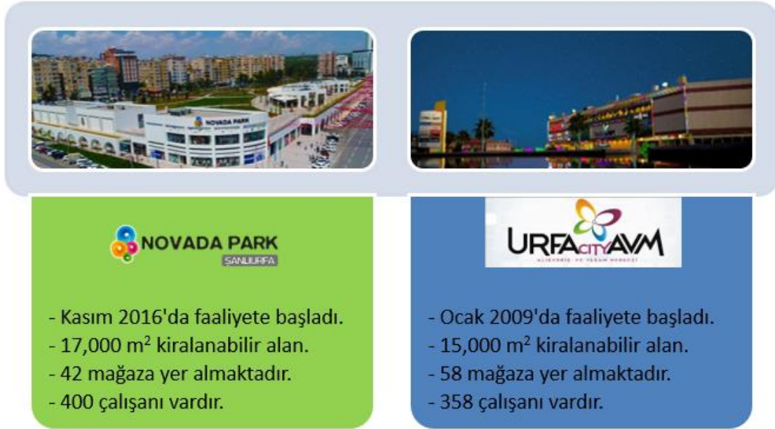
Şekil 4. Çalışmanın Evreni

Çalışmanın evrenini Şanlıurfa'da faaliyet gösteren ve şehrin en önde alışveriş merkezlerini oluşturan biri açık hava konseptinde, NOVADA Park ve diğeri kapalı alan konseptinde Urfa City AVM olmak üzere bu iki AVM'de yer alan mağazaların çalışanları oluşturmaktadır. Şekil 4, çalışmanın evrenini oluşturan bu iki mağaza hakkında kısaca bilgi vermektedir.