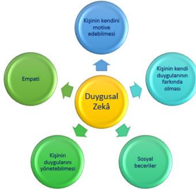
Şekil 3. Duygusal Zekâ Boyutları

Bu çalışma da AVM mağazası çalışanlarının duygusal zekâ seviyelerine onların demografik ve iş yaşamıyla ilgili özelliklerinin etkisi (cinsiyet, yaş, eğitim, medeni hal, çocuk sayısı, çalıştığı görev, AVM, mağaza sektörü, aylık gelir, kurumdaki hizmet yılı, haftalık mesai saati, mesleği seçmedeki temel unsur ve meslekte en çok değiştirmek istediği husus) SPSS v22 istatistiksel programı ile ilişki olarak incelenmiş, bulgular özelde mağaza yöneticilerinin, genelde AVM yöneticileri ile il ve ülke genelinde yerel ve merkezi yönetimlerin ekonomik yaşamda önemli yer tutan alışverişlerin güzel bir biçimde gerçekleşmesine olanak sağlayacak eğitim ve istihdam politikalarının belirlenmesinde yardımcı olacak şekilde yorumlanmaya çalışılmıştır.