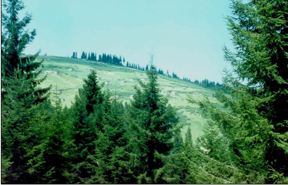
Fotoğraf 4. Daha ziyade bir güz yaylası niteliğinde olan güzle yerleşmeleri, mezra ve yaylalar kadar yaygın değildir.

Diğer taraftan, Doğu Karadeniz Bölümü'nde, farklı bir güzle etkinliği söz konusudur. Örneğin; Trabzon yöresinde, insanların ilkbahar mevsiminde yaylaya çıkışında, kendi köyüne ait güzle alanlarına çıkmadan önce mezraya, daha sonrada daha yükseklerdeki güzlelere çıkarlar. Bazen de güzle alanlarında hiç konaklama yapılmayarak, doğrudan yaylalara çıkılır. Yayla sezonunun sonlarına doğru ise, yayla alanlarında kış koşullarının başlaması üzerine burayı terk eden yayla sakinlerinin bir kısmı hayvanları ile birlikte, önce güzlelere inerler. Havaaların uygunluğuna bağlı olarak, burada da bir müddet kaldıktan sonra, aşağı seviyelerdeki yerleşmelere (mezra veya köy) doğru hareket ederler ve yaylalara yönelik mevsimlik göç olayını tamamlarlar (Zaman, 1999: 177–179). Yaylalardan inilen (sonbahar) veya mezralardan çıkılan (ilkbahar) ve böylece yayla ile mezra arasında yer alan geçici bir yerleşme olan güzlelerdeki ekonomik faaliyetleri; hayvan yetiştirme dışında tereyağı , peynir , minçi (minzi/lor) ile bazılarında kışlık yakacak odun üretimi oluşturmaktadır (Zaman, 1999: 183–187).