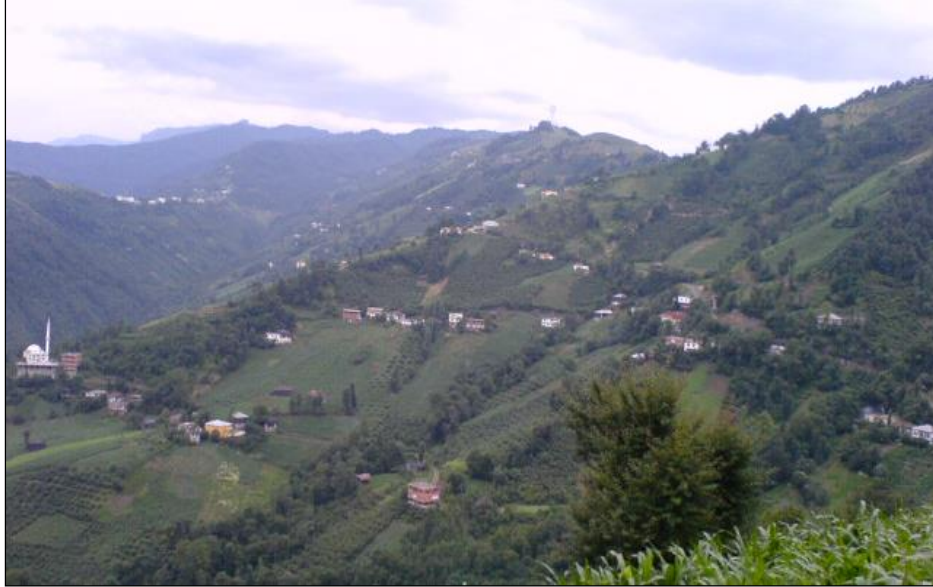
Fotoğraf 5. Doğu Karadeniz Sahil Yöresinde dağınık yerleşme şekli görülür.

sayısının artmasıyla iskân çekirdeklerinin çoğalmasının bir sonucu olarak değerlendirilebilir. Kısmi toplulaşma, genelde aynı aileye mensup bireylerin inşa ettikleri evler neticesinde giderek birbirlerine yaklaşımları sonucunda ortaya çıkmıştır. Bu yerleşme dokusu toplu ve dağınık yerleşmelerin pek çok ara şekillerinden sadece birisidir ve hâkim özelliğine göre birinin veya diğerinin içerisine dahil edilebilir (Tarkan, 1973: 120). Bu değerlendirmeye bağlı olarak gevşek dokulu yerleşme formu, her ne kadar yavaş yavaş toplu dokulu yerleşmelere geçişi yansıtıyor gibi görünüyorsa da, kıyı yöresi içerisindeki köylerin genel yerleşme özellikleri dikkate alındığında, dağınık yerleşme formu içerisinde ele alınmalarının daha doğru bir yaklaşım olacağı kanaatini taşımaktayız.