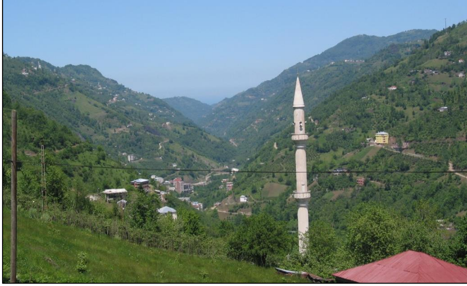
Fotoğraf 6. Yerleşmeler akarsu vadileri boyunca iç kesimlere doğru nispeten daha geniş alanlara dağılmıştır (Fotoğraf: Akisar/Ağaser vadisi- Şalpazarı).

Devamlı kırsal yerleşmelerden köy yerleşmelerinin büyük çoğunluğu, kıyı ile 500 m yükselti kuşağında dağılışı gösterir. Bu yükseltiden sonra ise yeryüzü şekilleri, iklim ve ekonomik çeşitliliğe bağlı olarak köy yerleşmelerinin sayısı azalmakta ve kıyı kesimi itibarıyla 1000 m yükselti kuşağının üzerinde pek fazla köy yerleşmesi bulunmamaktadır. Oysa Sahil Yöresi içerisinde, kıyı kuşağı diye de tabir edilen 0-500 m yükselti arasında, köy yerleşmelerinin yoğunluk kazanmasında; tarım alanlarının daha geniş olması, ticari değere sahip çay, fındık, tütün ve bahçe tarımının yapılması, yükseklerle oranla elverişli iklim ve ulaşım şartları gibi ekonomik faktörlerin daha elverişli olması gibi etkenler rol oynamıştır. Başka bir anlatımla, bu alanların yerleşme bakımından tercih edilmesinin başlıca nedenleridir.