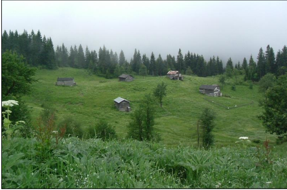
Fotoğraf 3. Bölgedeki mezralarda temel ekonomik faaliyeti hayvancılık oluşturur.

arasında kesintisiz olarak kullanılmaktadır. Mezraya çıkan ailelerden bir kısmı, daha yüksekte bulunan yaylalara çıkarken, bu yerleşmelerde evi ve arazisi olmayanlar, 6–7 ay mezralarda kalmaktadır. Böylece bu mezralar, birinci gruptaki mezralardan ayrılmaktadır. Bu tip mezraların bir bakıma yayla yerleşmesi özelliği kazandıkları söylenebilir. Çünkü daha alçak yükseltilerde yer almaları sonucu daha uzun süre kullanımları dışında, gerek faaliyet gerekse de meskenler bakımından çok belirgin bir fark söz konusu değildir. Başka bir anlatımla, sadece buldukları mevki itibarıyla daha elverişli iklim şartlarına sahip olmalarına bağlı olarak, hem yaz başı hem de sonbaharda biraz daha uzun süre yerleşmeye sahne olmalarıyla yaylalardan ayrılırlar (Zaman ve Sevindi, 2001: 432).