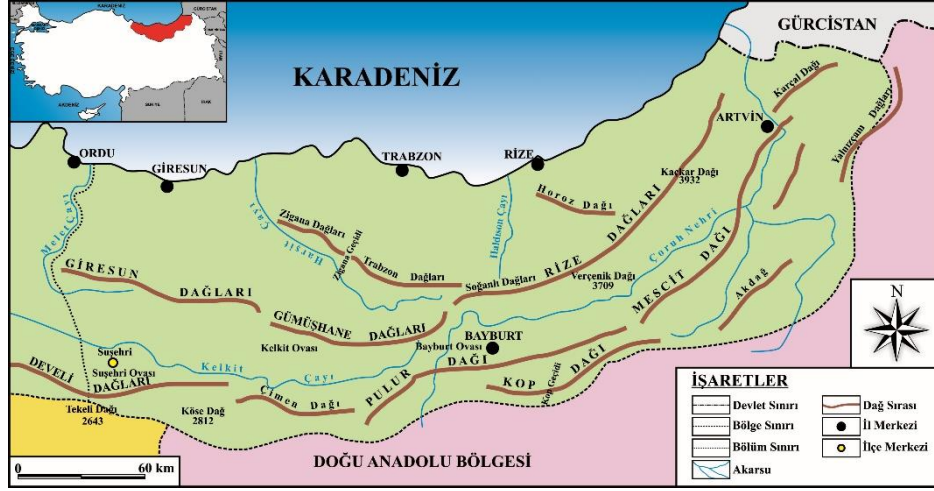
Şekil 1. Konum Haritası (Zaman, 2007: VII).

Doğu Karadeniz Bölümü, doğuda Gürcistan sınırından başlar ve batıda Ordu'nun doğusunda denize ulaşan Melet Çayı'na kadar devam eder. Bölümü, Doğu ve İç Anadolu bölgelerinden ayıran sınır, Doğu Karadeniz Dağlarının iç sıralarını oluşturan dağların (Tekeli Dağı, Köse Dağı, Kızıldağ, Çimen, Kop, Mescit ve Yalnızçam) İç Anadolu ve Doğu Anadolu'nun yüksek platolarına (düzliklerine) bakan yamaçlarından geçirilmiştir. Nitekim sınır, doğuda Yalnızçam Dağları'nın Ardahan Platosu'na bakan yamacından başlayarak önce güneye, sonrada batıya doğru uzanır. Çoruh Irmağı'nın Oltu ve Tortum Çayı havzaları, bölüm sınırları içerisinde kalır. Daha batıda Kop ve Çimen dağlarından geçen sınır, Kelkit Havzası'nın güneyindeki dağların (Kızıldağ, Köse Dağı, Tekeli Dağı) güney yamaçlarını takip ederek Canik ve Giresun dağları arasına yerleşmiş olan ve kaynaklarını Mesudiye'nin güneyindeki Giresun Dağları'ndan alıp, Ordu şehrinin doğusunda denize ulaşan Melet Irmağı enine vadisine kadar uzanır. Böylece, Orta ve Doğu Karadeniz bölümleri kuzeyden güneye doğru bu akarsu vadisini takip ederek 2643 m yükseltideki Tekeli Dağı'na ulaşır (Şekil 1).