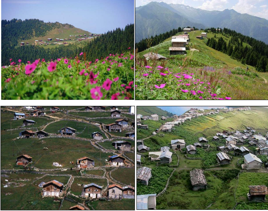
Fotoğraf 2. Doğu Karadeniz kıyı dağlarında bir kısım yayla yerleşmeleri orman alanları içerisinde, bir kısmı da Alpin kuşakta kurulmuştur.

Kırsal nüfusun yanı sıra, şehir nüfusunun da bir bölümünü yakından ilgilendiren yaylacılık faaliyetleri ile bazı aktivitelerin gerçekleştirildiği alanlar olan yaylalar, yöre insanları için ek bir geçim sahası olduğu kadar rekreasyonel, yani sayfiye amaçlı da kullanılan yerlerdir. Osmanlı döneminden beri bu gayeyle çıkılan yaylaların sayısı son dönemlerde bir hayli artmıştır. Şüphesiz bu artış, 1980'li yıllarda başlayıp, 1990'larda hızlanan yayla turizmine yönelik yapılan çalışmaların bir sonucudur. Bu yönüyle bölge yaylaları; büyük ölçüde bozulmamış doğal yapısı, soğuk suları, olağanüstü doğal manzaraları, insan yaşamına uygun iklimi, doğal bitki örtüsü, geleneksel yaşam tarzı ve meskenleriyle önemli potansiyele sahiptir (Zaman, 2007: 219). Başka bir deyişle, turizm amaçlı olarak da kullanımları söz konusudur.