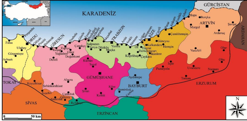
Şekil 2. Doğu Karadeniz Bölümü'nün İdari Haritası (Zaman, 2007: VIII).

Doğu Karadeniz Bölümü coğrafi anlamda homojen değildir ve çeşitli yörelerden oluşur. Bazı coğrafyacılar (Arınç, 2014: 183-185) bölümü; Kıyı Yöresi, Kıyı Dağları Yöresi, Yukarı Kelkit-Çoruh Oluğu Yöresi ve İç Sıralar Yöresi olarak dört bölümde incelerken, bazıları da (Yücel, 1987: 12-25, Atalay ve Mortan, 2003: 92-99) Sahil Yöresi ile Yukarı Kelkit-Çoruh Oluğu Yöresi olarak ele almaktadır. Bu yörelerden Doğu Karadeniz Dağları'nın kuzeyini kapsayan Sahil Yöresi, YÜCEL tarafından; Sahil Yöresi Yalı (Kıyı) Şeridi, Dağ Ormanları Kuşağı şeklinde bölümlere ayrılmıştır. Bu bağlamda sahil yöresi, batıda Giresun Dağları ile başlayıp doğuya doğru Gümüşhane-Zigana (Kalkanlı) Rize ve Karçal dağları ile devam eden kıyı dağlarının kuzey tarafını kapsar.