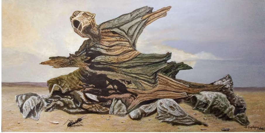
Görsel 11. Deli Rüzgar, 60x120 cm, Tuval üzeri karışık teknik, 2022

Bu teknik uygulanırken ilk aşamada tuval üzerine çeşitli maddeler kullanarak harc hazırlanır ve bununla çalışma yüzeyini 4-5 mm kalınlığa ulaşıncaya kadar kaplanır. Malzemenin kurummasını takiben modeli oluşturan çizim, tıpkı sigrafitto tekniğinde olduğu gibi kazıyarak yüzeye çizilir. Tasarımın özelliğine göre çukurlaştırarak veya yükseltme yaparak boyamaya geçilir. Boyama aşaması bu aşamada oldukça önemlidir. Çünkü bu aşamada; hem taşın içinde var olan doğal renkleri aktarmak hem de yüzeyin pürüzlü dokusunu boyayla doldurarak deforme etmemek gerekir. İnce katmalar halinde transparan boya ile aşamalar halinde boyamak sürecin ustalık gerektiren bölümünü oluşturur (Görsel 11).