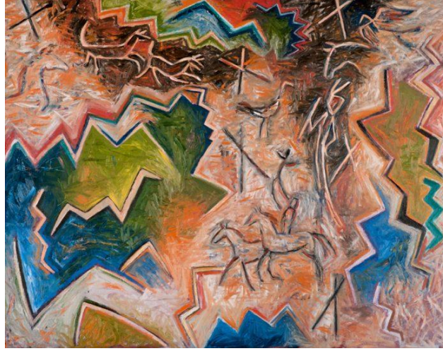
Görsel 2. Jaune Quick-to-See Smith, Herding, 1985

renklerin duygusal rezonansını vurgular. Örneğin, Wassily Kandinsky, Kazimir Malevich, Jaune Quick-to-See Smith gibi sanatçılar, petroglif sanatında bulunan sembolik dili anımsatan ruhani veya duygusal tepkiler uyandırmak için temsili olmayan formlar ve şekiller kullanmışlardır (Görsel 2).