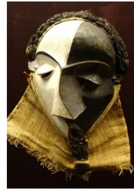
Görsel 4. Afrika Mbangü Maskesi