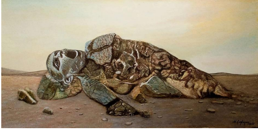
Görsel 7. Sesimi Duyan Var Mı? 60x120cm, Tuval üzeri karışık teknik, 2022

birleştirerek kendime özgü tarzımı oluşturdum. Malzeme bilgisi ve teknik beceriyi geliştiren denemelerin yanında sayısız kitap ve makaleyi okuyarak resim sanatının felsefi ve kuramsal bilgilerini edindim. Sanat tarihi, estetik, mitoloji, din ve sosyoloji başta olmak üzere kuramsal yönümü geliştirmek için incelediğim literatürde bir süre sonra hep aynı kavramın beni heyecanlandığı fark ettim. Doğala ulaşma çabam, doğayı daha yakından tanımam gerektiği konusunda beni teşvik etti. İnsanın doğa ile ilişkisi ve doğa karşısındaki durumu bir süre sonra sanatsal çalışmalarımın merkezinde yer almaya başladı. Güncel sanat eserlerimde doğa ve insan arasındaki ilişki ana tema olarak çıkmakta; güncel toplumsal olaylar, savaşlar, göçler, afetler eserlerimde estetik kaygılarla birleşerek geleceğe ulaşan birer belgeye dönüşmektedir (Görsel 7). Doğaya olan derin bağlılığım, eserlerimde net bir şekilde hissedilmektedir. Doğanın güzellikleri ve insanın bu güzellikleri algılama biçimi, sanatsal felsefemin bir parçasını oluşturmaktadır.”