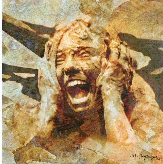
Görsel 10. Yitip Giden Bedenler Serisinden-5, 60x60cm, Tuval üzeri karışık teknik, 2024

Bu noktada yazarın kendi ifadesiyle aktardığı bilgiler önemlidir: “Benim için ‘fosilizm’ kavramı, geçmişin izlerini günümüzle birleştiren bir yaklaşımı temsil etmektedir. Fosiller, doğanın milyonlarca yıl önceki hallerini günümüze taşımakta ve eserlerim bu kavramı modern yaşamın izleriyle harmanlamaktadır. Eserlerimde fosillerin şekilleri ve formları, günümüz insanının izleriyle bir araya gelmekte; renk ve doku eserin anlamını derinleştirmektedir. Doğal tonlar ve dokular, doğanın sadeliğini ve güzelliğini yansıtmakta; aynı zamanda şeffaf ve akrilik boyaların kullanımı eserin yüzeyine bir derinlik ve çok katmanlılık katmaktadır” (Görsel 10).