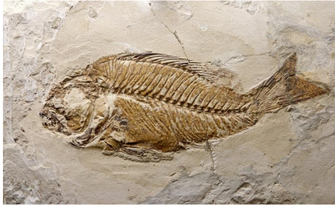
Görsel 8. Tarih-öncesi Dönem Balık Fosili

Şişginoğlu (2022, s.116) bu durumu şu ifadelerle tanımlamaktadır: “Hasan Çağlayan yok olan yaşamın sırrını yine doğada gören sanatçılarımızdan biri. Doğa ile ilişkisinde ‘tutkuya dayanan sevgi-korumaya dayanan saygı’ hemen hissedilir. Yaşamın başlangıç ve bitiş öyküsünün doğadaki en çarpıcı kanıtı fosillerdir.” İlgili eserlerde doğal renkler ve formlar, insana ait izlerle birleştirilmiştir. Bu akım, “fosilizm” olarak adlandırılmaktadır (Görsel 8).