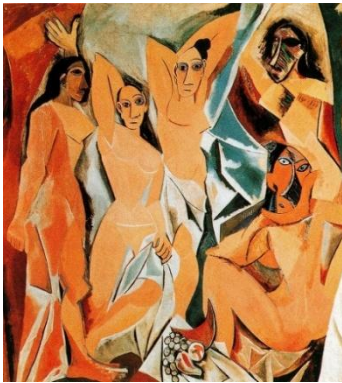
Görsel 3a. Pablo Picasso, Avignonlu Kızlar Kaynak: (URL-2)

Petrogliflerin, onları yaratan toplumların kültürel kimlikleriyle derinden iç içe olduğu gösterilmiştir. Sıklıkla toprak işaretleri, dini semboller veya tarihi olayların kayıtları olarak işlev görmüşlerdir. Kültürel kimliği ifade etmek için görsel temsilin kullanılması, kişisel, etnik ve ulusal kimliği keşfetmek için güçlü bir araç olarak hizmet etmeye devam eden çağdaş sanatta da devam etmektedir. Örneğin; Amerikan Yerlileri, Avustralya Aborjinleri ve Afrika geleneklerinden gelenler de dahil olmak üzere dünyanın dört bir yanındaki yerli sanatçılar, petrogliflerde bulunan sembolizm de dahil olmak üzere atalarının geleneklerinden ilham alabilirler. İspanyol ressam Pablo Picasso'nun 20. yüzyılın başlarında Paris'teki etnografya müzelerinde gördüğü Afrika maskeleri, onun sanatsal ufkunu genişletmiş ve eserlerinde devrim niteliğinde değişikliklere yol açmıştır (Görsel 3 ve 4). Bu sanatçılar, eski gelenekleri yeniden yorumlamak ve yeni hikayeler anlatmak için resim, heykel, dijital sanat veya karışık medya gibi çağdaş medyayı kullanmaya devam etmekte ve böylece geçmiş ile bugün arasındaki boşluğu doldurmaktadır.