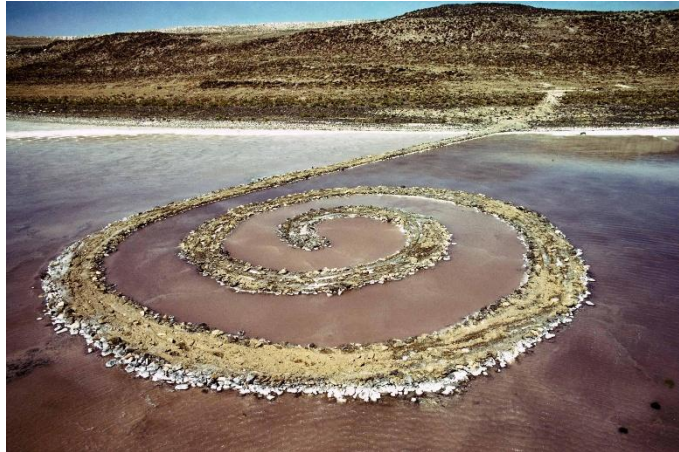
Görsel 5. Robert Smithson, Spiral Jetty , 1970

Petroglifler genellikle doğal ortamlarda; uçurumlarda, mağaralarda veya diğer belirgin kaya yüzeylerinde yaratılmıştır ve bu da onların manzarayla doğrudan bağlantılı olduğunu göstermektedir. Doğal dünyayla bu doğrudan ilişki, çağdaş sanatta, özellikle de sanatçıların manzaranın kendisini tuval veya araç olarak kullandıkları arazi sanatı veya çevre sanatı gibi akımlarda da bir temadır. Robert Smithson'ın ' Spiral Jetty ' adlı eseri ya da Andy Goldsworthy'nin geçici heykelleri gibi ünlü arazi sanatı örnekleri, petroglif geleneğine benzer bir toprakla ilişki çağırır (Görsel 5). Her iki durumda da sanatçı oyma, yerleştirme veya tasarım yoluyla toprak ve peyzajla ilişki kuran eserler yaratmak için doğal unsurları kullanır.