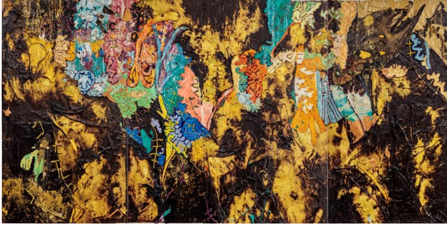
Görsel 6. Mark Bradford, Fire Fire, Tuval üzeri karışık teknik, 687.7×346.7 cm, 2021

gibi diğer sanatçılar ise tarihi ve yerli uygulamalardan yararlanarak derin kültürel öneme sahip malzemeleri bir araya getirmektedir (Görsel 6).