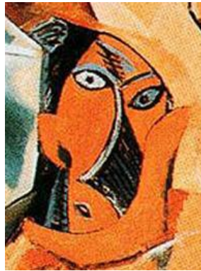
Görsel 3b. Avignonlu Kızlar (Detay)