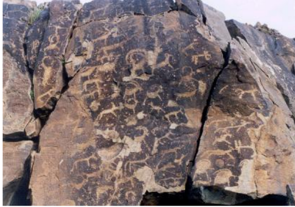
Görsel 1. Farklı hayvan türlerini gösteren kaya üstü tasvir. Bugut, Moğolistan.

“Bir devrin iletişim aracı, yazısı olarak nitelendirilen kaya üstü tasvirler, kavramların işaretlenmesi/kalıcılığının sağlanması ve gelecek nesillere aktarılması itibarıyla sosyal ve kültürel açıdan büyük önem taşır” (Mert, 2007, s.233). Petroglifler sıklıkla soyut ya da sembolik olarak nitelendirilir ve modern sanatta gerçekleştirilen sürece benzer şekilde fikirleri, anlatıları ya da duyguları yakalama çabasını temsil eder. İster taş yüzeyde ister tuval üzerinde olsun, kavramları görsel olarak ifade etmek için gösterilen çaba, bu iki sanatsal form arasında temel bir bağlantı kurar. Petroglifler anlam ifade etmek için sıklıkla geometrik desenler, stilize hayvanlar ve insan figürlerini kapsayan soyut ve sembolik imgeler kullanır (Görsel 1).