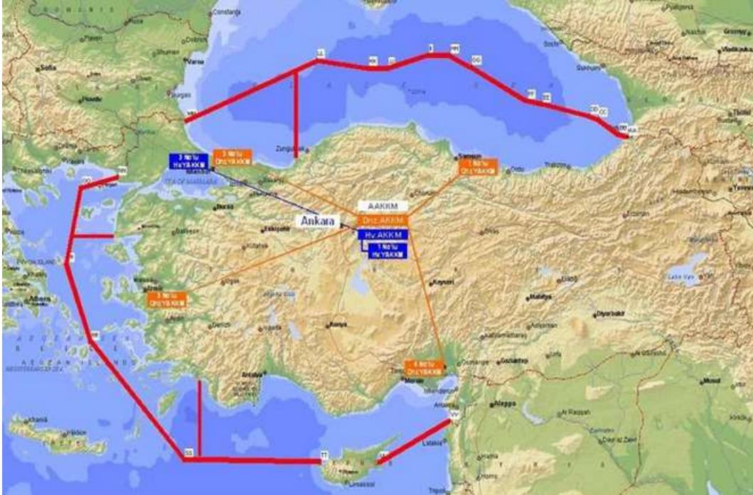
Şekil 1. Türk arama kurtarma bölgesinin haritada şematik gösterimi. (UDHB, 2017)

Türk Arama ve Kurtarma Yönetmeliği'ne göre; hava ve deniz vasıtalarının karada, havada, su üstünde ve su altında tehlikeye maruz kalması, kaybolması veya kazaya uğraması hallerinde bu vasitalardaki şahısların her türlü araç, özel teçhizat veya kurtarma birlikleri kullanılarak aranması ve kurtarılması işlemlerinin bütününe “arama ve kurtarma (search and rescue - SAR)” denilmektedir. Ülkemizde arama ve kurtarma faaliyetlerinin genel koordinasyonundan Ulaştırma Denizcilik ve Haberleşme Bakanlığına bağlı Ana Arama ve Kurtarma Koordinasyon Merkezi (AAKKM) sorumludur. Türk arama kurtarma bölgesi ‘içinde arama ve kurtarma hizmeti icra edilmek üzere tespit edilmiş ve Yönetmeliğin Ek-1’inde koordinatlarla tanımlanan saha’ olarak tanımlanmıştır (Türk AK, 2001: Madde 4). Türk arama kurtarma bölgesinin, harita üzerindeki şematik gösterimi Şekil 1’deki gibidir (UDHB, 2017).