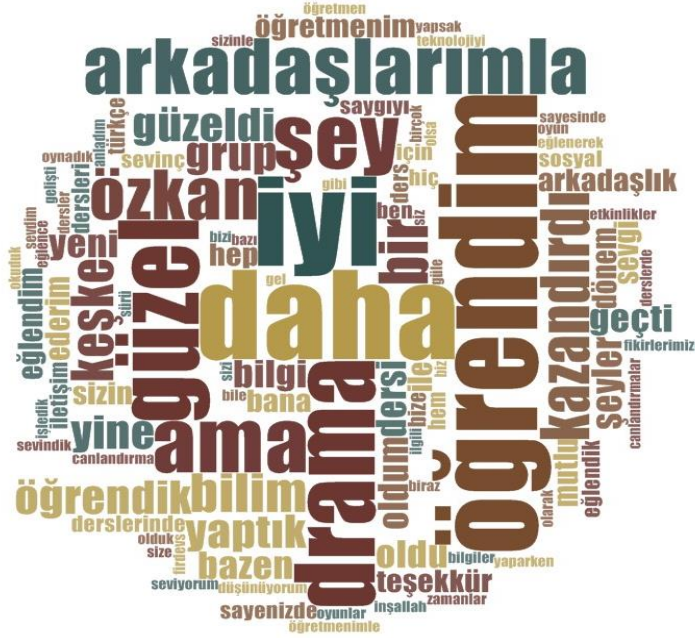
Şekil 2. Öğrencilerin “Derslerin yaratıcı drama ile işlenmesi sana neler kazandırdı?” sorusuna verdikleri cevaplara ilişkin kelime bulutu analizi

Öğrencilerin bu soruya verdikleri cevaplara ilişkin kelime bulutu analizi Şekil 2’de görülmektedir.