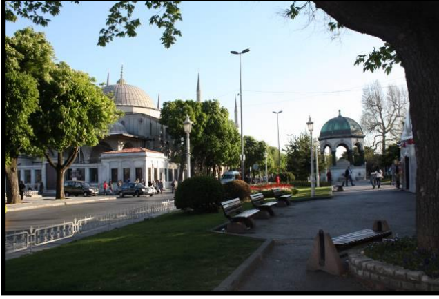
Resim 5. Sultanahmet Meydanı'nın kuzey ucu. Saat kulesi inşa edilmesi düşünülen Sultan Ahmet Muvakkithanesi'nin önü ve 1901 tarihli Alman Çeşmesi.

1884 tarihli belgede, İstanbul'da uygun yerlere birer saat konulmasının kararlaştırıldığı; bu amaçla şimdilik iki saat satın alındığı bildirilmiştir (BOA., İ.DH., 940/74403, 2 Zi'l-hicce 1301/23 Eylül 1884). Bu iki saatin nereye konulacağına dair iki farklı görüş beyan edilmiştir. Birinci görüş, Beyazıt Meydanı'ndaki Daire-i Askeriye'nin ana kapısının iki yanındaki mevcut saatlerden birinin değiştirilmesi; ikinci saatin ise Tophane Meydanı'nda bulunan saat kulesindeki mevcut saatin üstüne konulması yönündedir. Bu iki saatin nerelere konulacağı yönündeki ikinci görüşte ise; saatlerden birinin Sultanahmet ve Ayasofya Meydanlarına nazır bir konumda bulunan Sultanahmet Muvakkithanesi önüne bir saat kulesi inşa ettirilerek buraya takılması önerilmiştir (BOA., İ.DH., 940/74403, 16 Rebî'ü'l-âhir 1302/3 Şubat 1885). Sonraki tarihlerde, Sultanahmet Muvakkithanesi'nin önüne ve Beşiktaş Meydanı'na "gotik usulde" yapılmasına karar verilen kulelerle ilgili birtakım ayrıntıların belirlenmesine karar verilmiştir (BOA., DH.MKT., 1376/59, 9 Safer 1304/7 Kasım 1886). Yazışmalarda bahsi geçen Sultanahmet Meydanı'na nazır konumdaki muvakkithanenin önüne inşası planlanan saat kulesinin yapılmadığı, bu düşüncenin hayata geçirilmediği anlaşılmaktadır. Yine de İstanbul'da bir saat