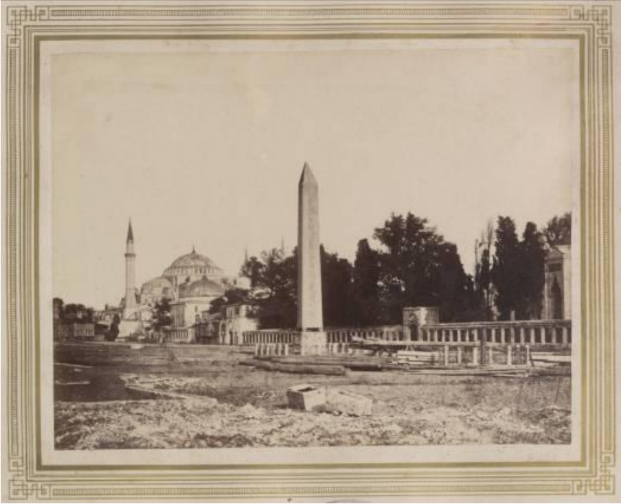
Resim 4. XIX. yüzyılın ikinci yarısına tarihlenen fotoğrafta Sultanahmet Meydanı'nın bir bölümü.

uygun olacağı ifade edilmiştir. Burmalı Sütun ve diğer sütunların, yapılan keşfe göre bu yolda tamiri istenmiştir. İngilizler tarafından yapılan hafriyatla açılıp tekrar kapatılan ve Burmalı Direk olarak tanımlanan Burmalı Sütun'un, geçen zamanla toprak içinde kalacak kısmının çürümesine sebep olacağı belirtilerek sütunun temelinden yukarıya kadar etrafına duvar yaptırılarak üzerine demir parmaklık konulması istenmiştir. Aynı tarihte, diğer iki anıtın da etrafının kazılıp ortaya çıkarılması ve demir parmaklıklarla çevrilerek muhafaza altına alınması kararlaştırılmıştır ( Resim 4 ).