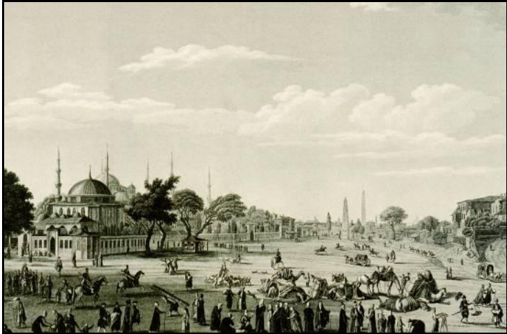
Resim 1. XIX. yüzyılın başında Sultanahmet Meydanı. (Kaynak: MELLING, A. I. (1819) Voyage pittoresque de Constantinople et des rives du Bosphore , Paris)

Sultanahmet Meydanı (1), Osmanlı Dönemi yazışmalarında yer alan ifadeyle "asıl İstanbul şehrinin" kamusal alanıdır. Sultan Ahmet Külliyesi'nin inşasından sonra yazışmalarda daha çok Sultanahmet Meydanı olarak geçmeye başlayan bu alan, XVIII. yüzyılın sonunda, önceki dönemlere oranla, önemini kaybetmekle birlikte XIX. yüzyılda tekrar ilgi odağı olmuştur ( Resim 1 ). Osmanlı Devleti'nin son yüzyılında, birçok etkinliğe sahne olan meydanda, bu dönemde birtakım düzenlemeler yapılmıştır. Bu makalede, meydandaki düzenlemeler ile meydanın XIX. yüzyıldaki önemi, yazılı kaynaklar ve Başbakanlık Osmanlı Arşivi'nde bulunan belgeler yardımıyla ortaya konulmaya çalışılmıştır.