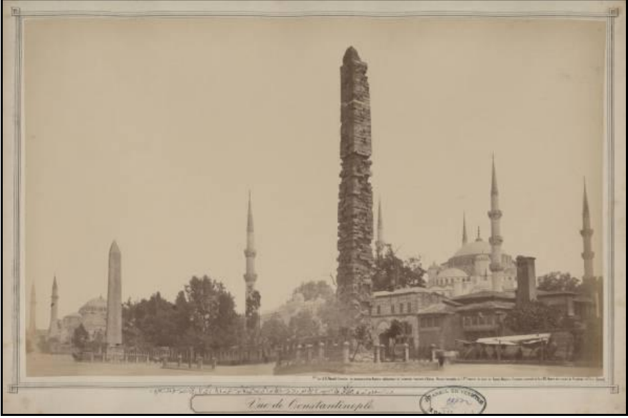
Resim 6. 1878 tarihli fotoğrafta Sultanahmet Meydanı.

Yıkılmak üzere olduğu belirlenen Dikilitaş/Örme Sütun'un tamirine başlanması zaman almıştır. Konu ile ilgili yazışmaların uzun süre devam ettiği anlaşılmaktadır. 1899'da karar verildiği anlaşılan Örme Sütun'un tamirine 1894 yılı sonlarına doğru başlanabilmektedir. Anıtın tamiratının 1894 yılı sonuna kalmasının nedeni, 10 Temmuz 1894'te İstanbul'da yaşanan deprem olmalıdır.