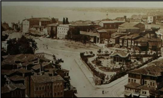
Resim 3. XIX. yüzyılın ikinci yarısında Sultanahmet Meydanı'nın kuzey yönü ve Millet Bahçesi.

1890 yılında, Millet Bahçesi'nin genişletilmesi düşünülmüştür ( Resim 3 ). 9 Eylül 1306 (21 Eylül 1890) tarihli belgeye göre, Şehremaneti idaresinde bulunan Millet Bahçesi'nin Mekteb-i Sanayi önüne kadar genişletilerek umumi bir bahçe haline getirilmesi istenmiştir. Mekteb-i Sanayi'ye gelir getirmek üzere yapılan mevcut barakaların kaldırılması ve yeniden düzenlenerek genişletilmesi planlanan bahçenin her iki ucuna mektebin ürünlerinin satılması için dükkanlar yapılması, bahçenin de mektep idaresine bırakılması hakkında Ticaret ve Nafia Nezareti'nden bir yazı yazılmıştır. Daha sonra Sultanahmet Meydanı'nın bahçe haline getirilmesinin uygun olmayacağı anlaşılmıştır (Ergin, 1995: 3896-3897).