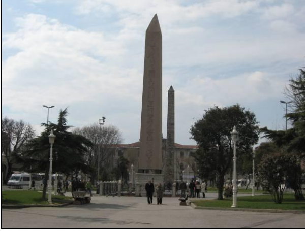
Resim 7. Sultanahmet Meydanı'nın son durumu. Meydanda bulunan Dikilitaş, Burmalı/Yılanlı Sütun ve Örme Sütun.

Sultanahmet Meydanı, XIX. yüzyılda, çevre düzenlemeleri, mevcut anıtların onarımları, yeni inşa edilen veya edilmesi düşünülen yapılarıyla Osmanlı'nın, Osmanlı İstanbul'unun Batılı yüzünü yansıtan bir meydan olarak düzenlenmiş ve kullanılmıştır ( Resim 7 ). Dikilitaşları, millet bahçesi, sergi binası, Alman Çeşmesi yanında inşa edilmesi planlanan saat kulesi meydanın "Batılı" öğeleridir.