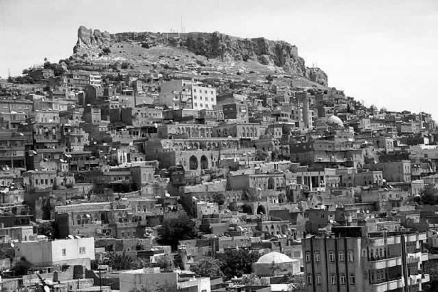
Resim 1: Mardin Kenti Genel Görünümü

Yer aldığı tepenin güney yamacında, doğu - batı doğrultusunda çizgisel bir gelişmişlik gösteren bir yerleşim düzeni oluşturmaktadır (Resim1). Sur içinde gelişmesi nedeniyle sivil ve dini mimarlık örneklerinin yer aldığı doku kademeli bir düzen oluşturur.