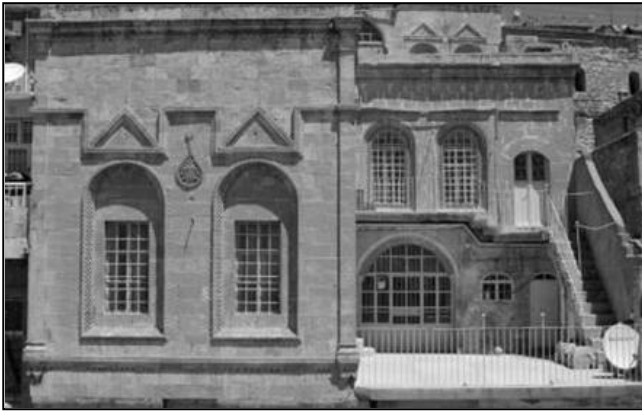
Resim 2: Tipik Mardin Evi Cephesi

Mardin Evleri'ndeki eyvan, uzun eksenini evin cephesine dik, tek açıklıklı ve tonoz örtülüdür. Mardin' deki eyvanlar topografik yapıdan dolayı, teraslar şeklinde birbiri üzerinden dışa açılmaktadır (Akkoyunlu, 1988). Plan şeması olarak, eyvanlı ev geleneğine sahip olan Mardin evlerinde alt katlarda sokağa bakan pencere yoktur, eyvanın yorumu ise bu bölgelerde daha farklıdır. Çardakların altındaki süslü, profilli, bindirme tekniği ile yapılmış taş konsollar cephelerin, dolayısıyla sokağın en önemli unsurlarıdır (Resim 2).