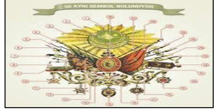
Şekil 1: 1922 Osmanlı saltanat bayrağı Şekil 2: Osmanlı ihtişamını gösteren otuz ayrı sembolün yer aldığı arma 1