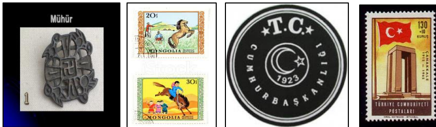
Şekil 11-12: Moğolistan Devlet Mühür ve Pulu Şekil 10: Türkiye Cumhuriyeti Devlet Mühürü ve Pulu

1911'deki bağımsızlık uyanışından sonra Moğollar, içinde ışıldayan ve "her iki din ve devletin hamilidir" yazan yeni bir mühür tanıttılar. Bir yıl sonra, 1922'deki devrimden sonra, bakanlıkların sembolik olarak devlet bağımsızlığını gösteren mühürleri değişti. Daha sonra 1924'teki anayasada tüm bakanlıkların kare şeklindeki SOYOMBO'lu işlenmiş mühür kullanması gerektiği söylene de, yuvarlak devlet amblemi kullanılmıştır(Boldbaatar, Humphrey, 2007:3-22).