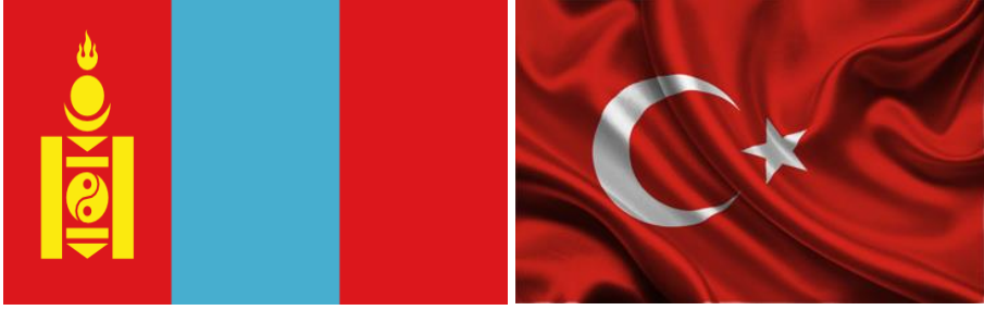
Şekil 6: 1992 Moğolistan Kabul Edilen Bayrağı Şekil 5: 1922 Anayasa ile Kabul Edilen Türk Bayrağı