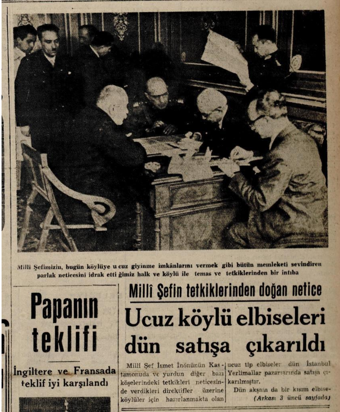
EK 1: İkdam Gazetesi, 11 Mayıs 1939, nr. 117, s. 1. Ucuza Köylü Elbiselerinin Satışa Çıkarılması