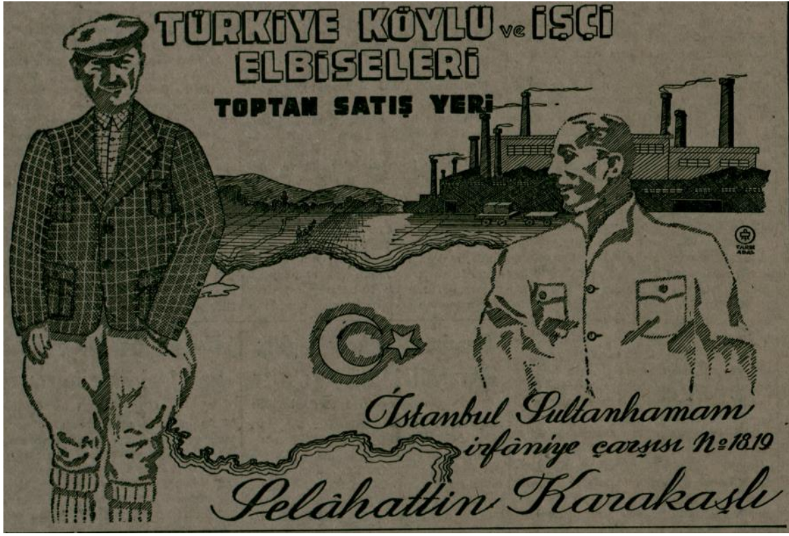
Ek 4: Cumhuriyet Gazetesi, 16 Mart 1943, nr. 6673, s. 4. Köylü ve işçi elbiseleri toptan satış merkezi