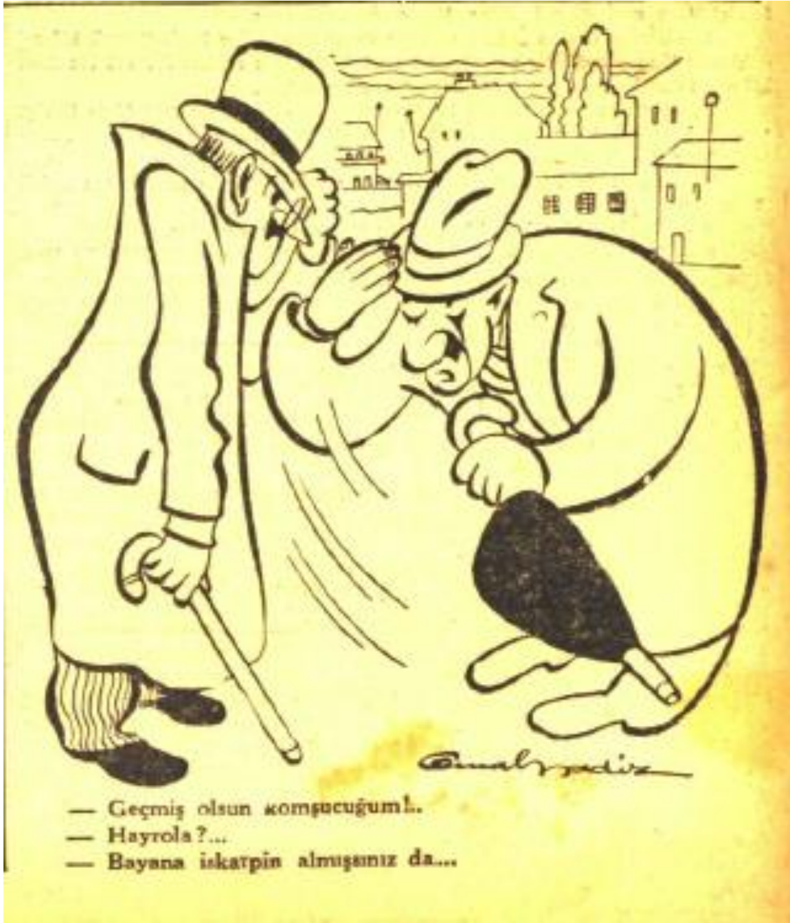
Ek 11: Cumhuriyet Gazetesi, 10 Ocak 1944, nr. 6968, s. 1. Ayakkabı fiyatlarının pahalılığı