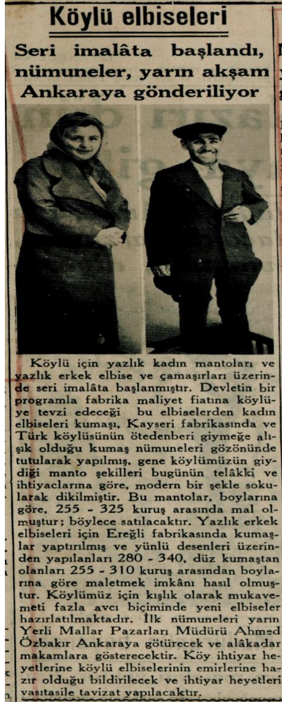
Ek 3: Cumhuriyet Gazetesi, 11 Haziran 1939, nr. 5416, s. 2. Seri imalatına başlanan köylü elbisele