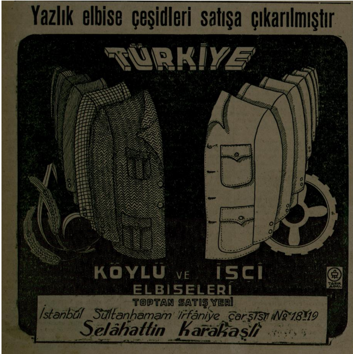
Ek 6: Cumhuriyet Gazetesi, 3 Mayıs 1943, nr. 6721, s. 4 Yazlık köylü ve işçi elbiseleri satışa çıkarılmıştır.