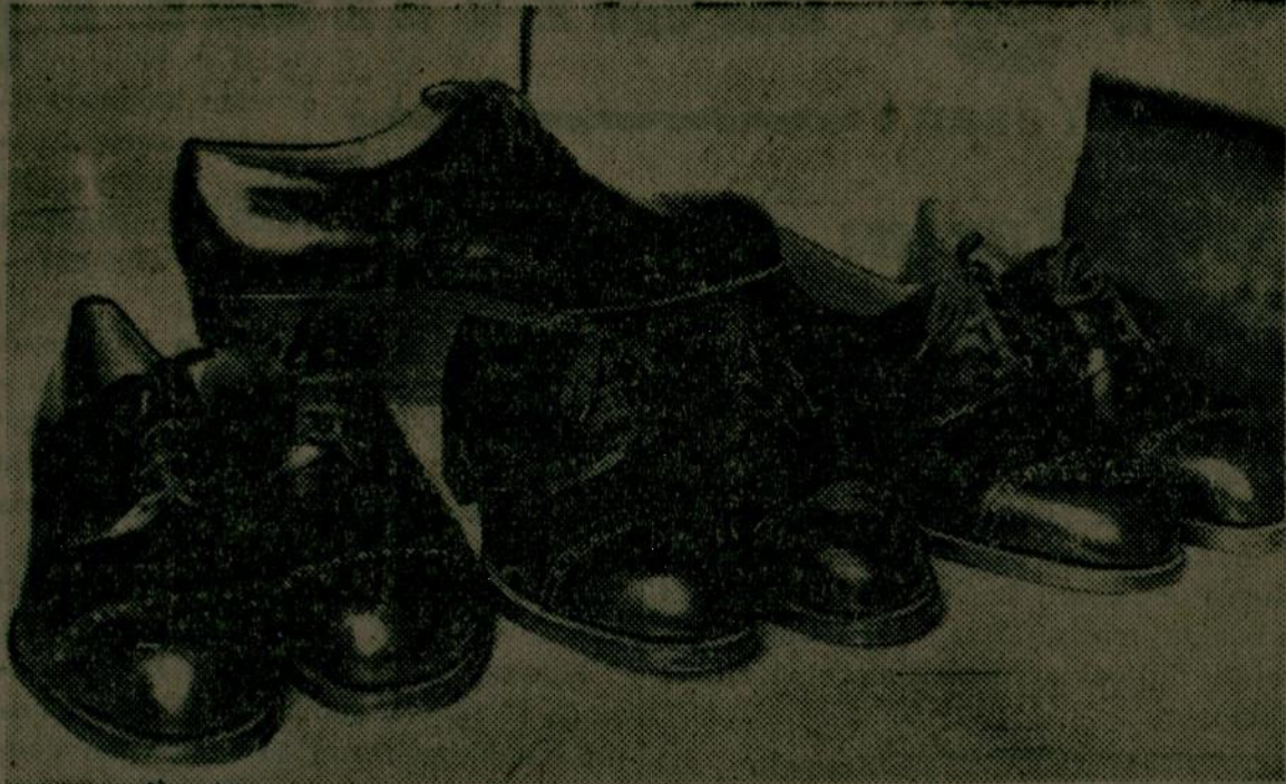
Hazırlanan halk tipi ayakkabıları

660 kuruş fiatla hafta başında piyasaya çıkarılacak