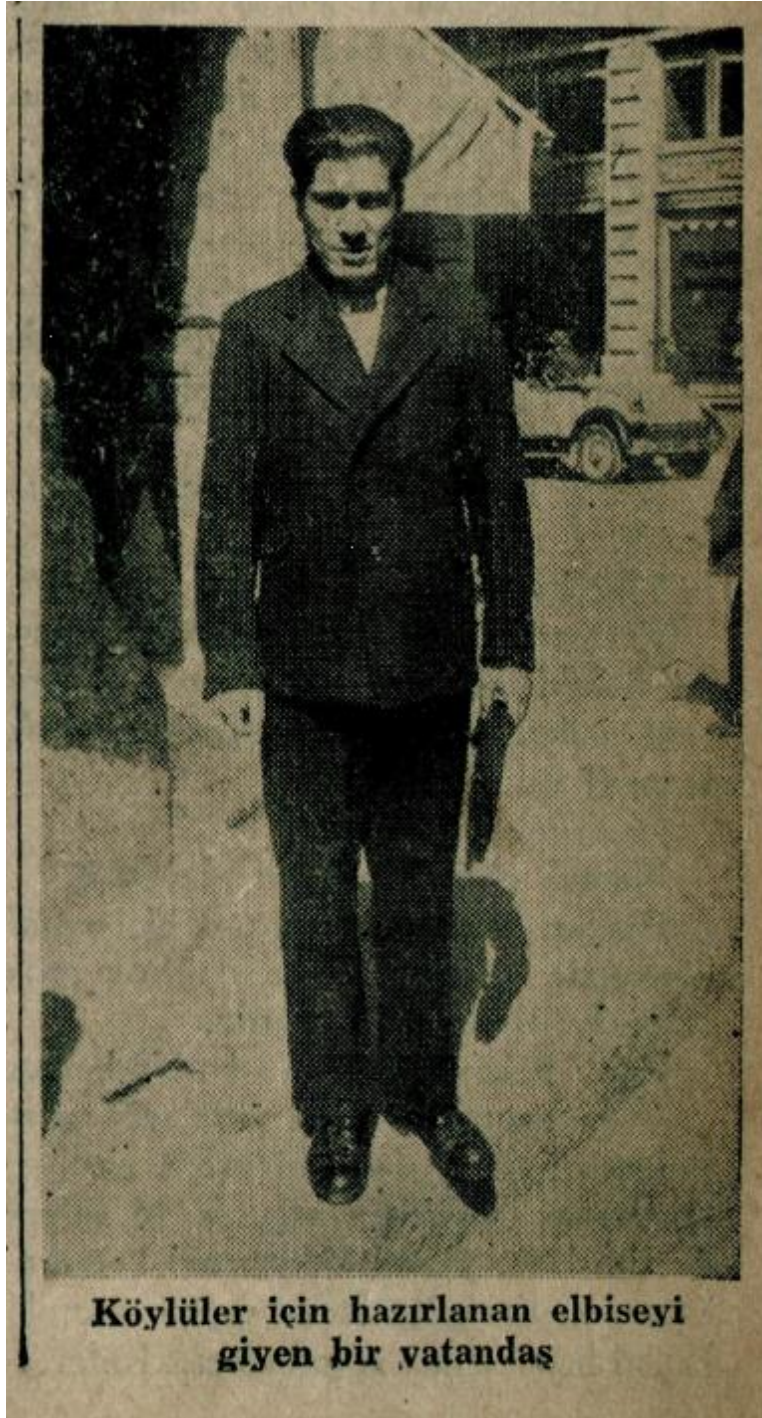
Ek 2: Cumhuriyet Gazetesi, 11 Mayıs 1939, nr. 5385, s. 1. Köylüler için hazırlanan elbise örneği