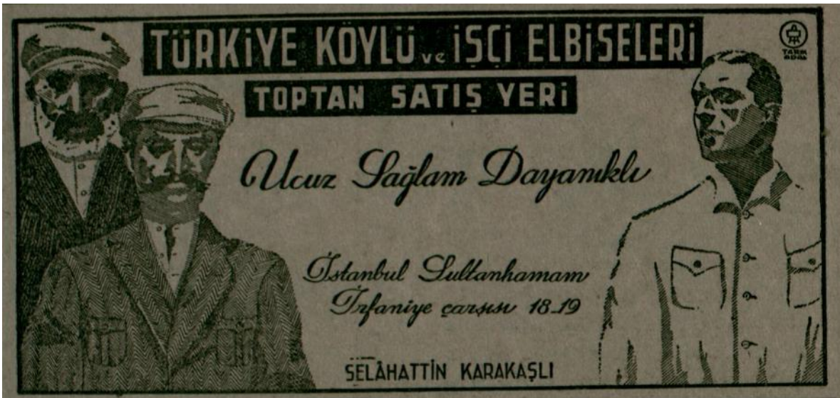
Ek 5: Cumhuriyet Gazetesi, 10 Mart 1943, nr. 6667, s. 4. Köylü ve işçi elbiseleri toptan satış merkezi