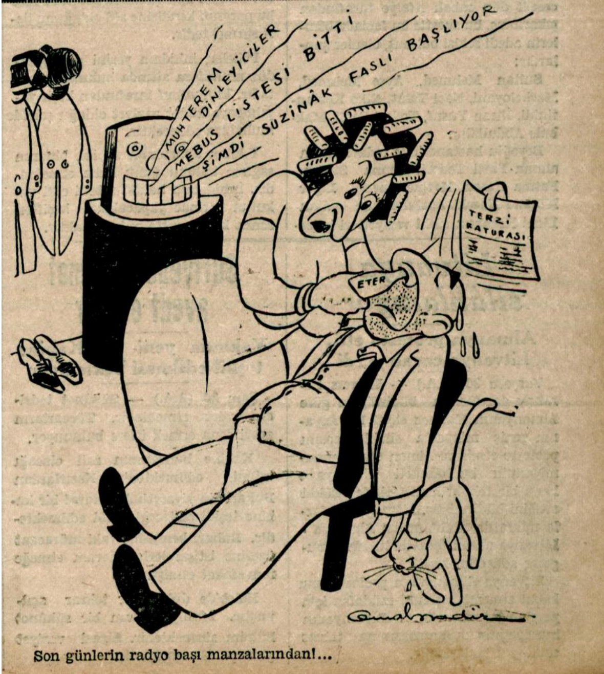
Ek 8: Akşam Gazetesi, 27 Mart 1939, nr. 7342, s. 1. Kıyafet masraflarının lüks tüketime girmesi