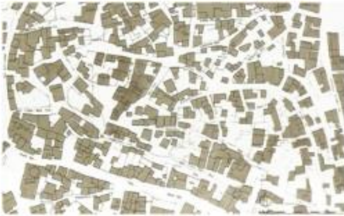
Şekil 6. Erzurum'un tarihi kentsel dokusunda yol strüktürü (Aru, 1998).

Aru'nun (1998) Osmanlı kentleri için ifade ettiği gibi kentlerin biçimsel karakterinin arkasında yol strüktürünün biçimsel karakteri bulunmaktadır. Osmanlı kenti yol strüktürünün biçimsel karakteri ile ilgili dikkat çekici özellikler ise yol ağının sergilediği geometrik esasa dayanmayan, dar, kıvrımlı yapı ve çıkmaz sokaklardır. Tipik bir Osmanlı kenti olan Erzurum'un da organik dokusunda organik yollar ve çıkmaz sokaklar yol strüktürünün temel öğeleri olarak görülmektedir (Şekil 6). Yılmaz'ın (2010) vurguladığı gibi Erzurum'un Osmanlı döneminde gelişme gösterdiği alanda sokak düzeninin ve bu sokak düzeni içerisinde mimari eserlerin ve konutların konumlanışları tipik Osmanlı kentlerindeki gibi olmuştur. Osmanlı dönemi Erzurum'unda organik dokulu yol strüktürünün düzensizliği; yapının yapı adasının; yapı adasının yolun; yolun da kentin genel karakteri üzerinde etkili ve belirleyici olduğu bir bütünlük içerisinde varlık göstermiştir.