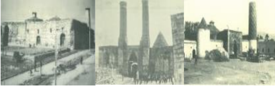
Şekil 2. 20. yy.' da Ulu Cami (solda), Çifte Minareli Medrese (ortada), Yakutiye Medresesi (sağda)

1982), bu döneme ait ve bugün halen Erzurum'un sembolü olarak kabul edilen Çifte Minareli Medrese ile Ahi Baba, Cimcime Hatun ve Rabia Hatun Kümbetleri yer almaktadır (Karpuz, 1976; Özgen, 2009). Erzurum'un 1242-1336 yılları arasında İlhanlı yönetimi altında kaldığı (Yurt Ansiklopedisi, 1982) dönemden kalan önemli eserler ise Yakutiye Medresesi ve Ahmediye Medresesidir (Madran, 2009) (Şekil 2). Diğer taraftan, 11.-15. yy.'lar arasında üretilen eserlerden Ulu Cami, Çifte Minareli Medrese, Yakutiye Medresesi ve Ahmediye Medresesi ile belirlenen ve Şekil 1'de okunabilen dörtgen alan 15. yy.' a kadar kentin asıl yerleşim alanı olma özelliği taşımıştır. Bu alanın kuzeydoğu köşesinde İç Kale yer almaktadır (Can, 1998; EBB, 2012).