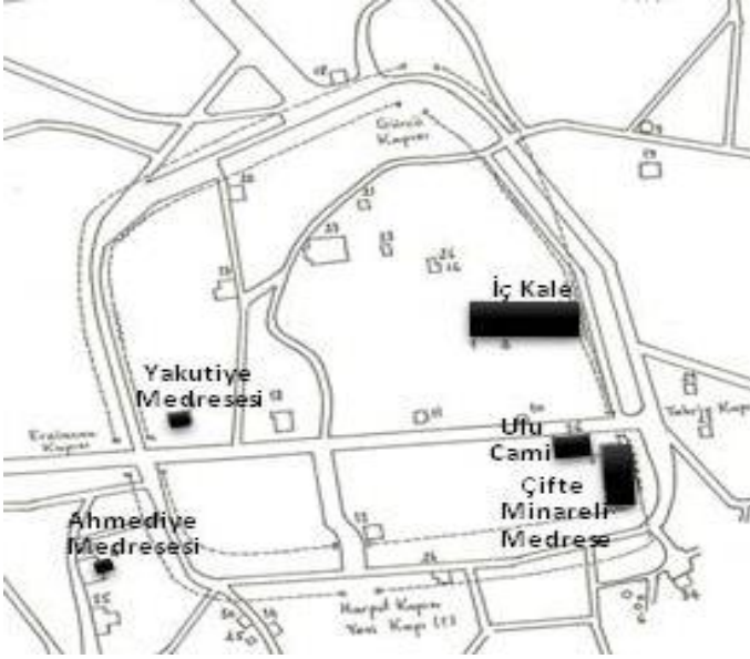
Şekil 1. Erzurum Kalesi'nin ve 15. yy.' a kadar kentin asıl yerleşim alanını sınırlandıran yapıların tarihi kentsel doku içinde konumu (Ünal, 1968'den elde edilen plan üzerine hazırlanmıştır).

bezenmiştir. Günümüzde kentte görülen eserlerin hemen hepsi Saltuklu, Selçuklu, İlhanlı, Osmanlı ve Türkiye Cumhuriyeti dönemlerine aittir. Erzurum'da 11. yy.' dan öncesine ait tek eser olan ve 5. yy.'ın başında, kentte Roma hâkimiyeti sürerken yapıldığı kabul edilen Erzurum Kalesi 6 aynı zamanda kentin en eski yerleşim alanı olarak kabul edilmektedir (Şekil 1).