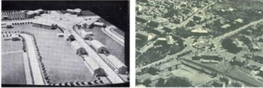
Şekil 11. Cumhuriyet Meydanı'nın maket görüntüsü (Belediye dergisi, 1939; aktaran Karakaya, 2010) (solda), 1960'larda Cumhuriyet Meydanı ve yakın çevresi (sağda)

ile başlayarak Yakutiye Medresesi ile Lala Paşa Camii ve Belediye Binası'nı içine alan kentsel düğüm noktasından, Caferiye Camii, Cimcime Hatun Türbesi, Ulu Cami, Çifte Minareli Medrese ve Erzurum Kalesi'ne uzanan Cumhuriyet Caddesi, eski ticaret merkezi olan Taş Mağazalar'a yönlenen düğüm noktasına bağlanmaktadır. Dolayısıyla, Cumhuriyetin ilanının ardından yönetici merkez kentin omurgasının etki ve çekim alanında yer almıştır. Ayrıca Osmanlı döneminden farklı olarak Lambert planı ile Erzurum'da kentin yeni modern yüzünün mekâna kazındığı bir kamusal alan olarak Cumhuriyet Meydanı inşa edilmiştir. Cumhuriyet Meydanı (Şekil 11) dört tarafından 1930'larda inşa edilen Türkiye Cumhuriyeti'nin ve modern Erzurum'un yeni yüzünü sembolize eden binalarla tanımlanmıştır. Bu binalardan birinin radikal modernite projesinin kültürel boyutunun hayata geçirilmesinin yolu olarak tanımlanan halkevi olması dönemde Cumhuriyet Meydanı'nın taşıdığı anlamı vurgulamaktadır. 7