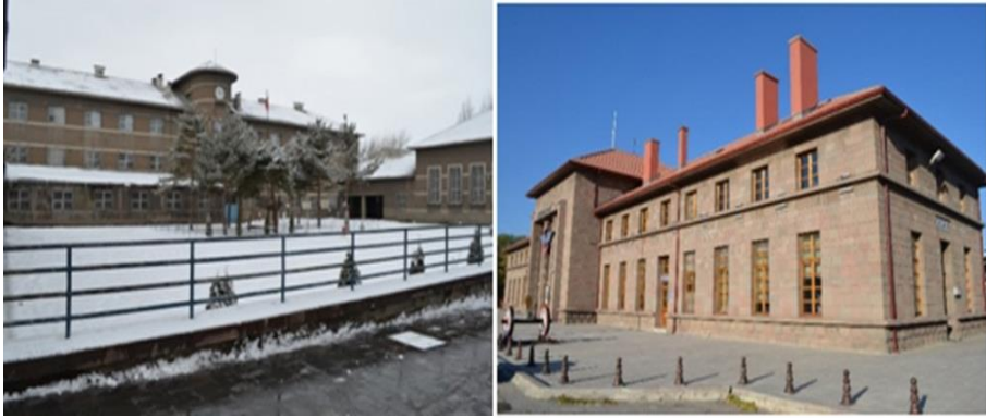
Şekil 9. Erzurum Lisesi (solda), Gar Binası (sağda)

Erzurum'un bugünkü gelişme deseni üzerinde büyük ölçüde belirleyici olan Lambert Planının kent içi ulaşım sistemi içinde önerdiği önemli bağlantıların tümüne yakını açılmış ve konut alanları plana uygun bir şekilde kurulmuştur (EBB, 2012; Can, 1988). Yerleşim alanları nüfusun sosyo-ekonomik özellikleri gözetilerek bahçeli siteler ve aile evlerinden oluşan, halkın oturacağı alanlar, çoğunlukla iki katlı konutların yer aldığı işçi ve esnaf mahallesi, üç kat izni verilen yeni mahalleler ve ticaret ile konutun birlikte yer alacağı karma bölgeler şeklinde düzenlenmiştir (EBB, 2012). Planda, kent içi ulaşım ağı merkez çevresinde dolaşan ring yollar; merkeze gelen ışınal yollar ve ana eksenler, transit yollar ve servis yolları ile kılcal yollar olarak dört grupta toplanmıştır. Ticaret bölgesinin kent merkezinde yer almasını öneren plan, kentte yer alan tarihi eserlerin çevrelerinin açılarak korunmasını önermiştir (EBB, 2012). Diğer taraftan Cumhuriyetin ilanının ardından da kentte önemli mimari yapılar inşa edilmeye devam edilmiştir. 20. yy.'ın ilk yarısında başta Lambert tarafından tasarlanan Erzurum Lisesi (Kulözü, 2015) olmak üzere İş Bankası, Gar, Halkevi ve Eski Tekel Binaları dönemde kentin öncü modernleri olmuştur (Şekil 9).