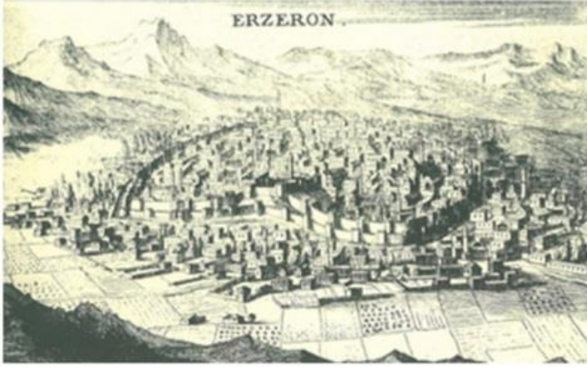
Şekil 3. 18. yy. başında Erzurum (Joseph P. De Toumefort tarafından 1701 yılında çizilmiştir)

Diğer taraftan bu dönemde üretilen ve kentte bugün halen varlığını sürdüren önemli mimari varlıklar arasında Rüstem Paşa Kervansarayı ve Lala Paşa Camii yer almaktadır (Gündoğdu vd., 2010; EBB, 2012; Karpuz, 1976; Madran, 2009) (Şekil 4).