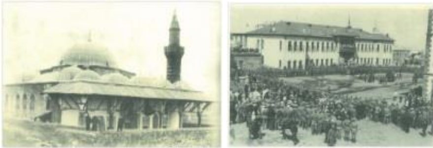
Şekil 4. 20. yy.' da Lala Paşa Cami (solda), Hükümet Binası (sağda)

Diğer taraftan bu dönemde üretilen ve kentte bugün halen varlığını sürdüren önemli mimari varlıklar arasında Rüstem Paşa Kervansarayı ve Lala Paşa Camii yer almaktadır (Gündoğdu vd., 2010; EBB, 2012; Karpuz, 1976; Madran, 2009) (Şekil 4).