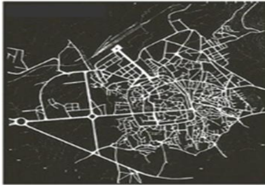
Şekil 5. Erzurum’un tarihi organik dokusu ve çevresinde gelişen geometrik dokulu gelişimi yönlendiren yol strüktürü (Aru, 1998).

Sonuç olarak Erzurum 6000 yıllık tarihinde farklı medeniyetlere ev sahipliği yapmış olmasına karşın, 20. yy.’ın başında, belki de 400 yıl süren uzun Osmanlı hâkimiyeti nedeniyle, geleneksel organik dokulu bir Osmanlı kenti görünümündedir (Aru, 1998) ve bugün halen kentte bu dokunun izleri görülmektedir (Şekil 5). Erzurum’un organik gelişme dokusu, kenti oluşturan temel öğelerden yollar ve merkezler üzerinden ortaya koyulabilir.