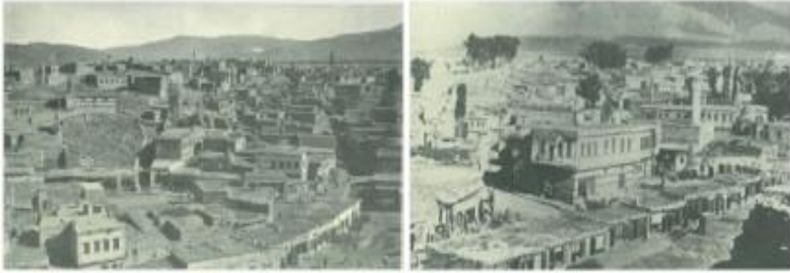
Şekil 7. 19. yy.' da Taş Mağazalar (solda), 20. yy.' da Taş Mağazalar (sağda)

Ayrıca kentin Osmanlı döneminde büyüme yönü göz önünde bulundurulduğunda Taş Mağazaların kentin merkezinde yer aldığı, bütün ana aksların Braudel (1987) ve Cezar'ın (1983) Osmanlı kentleri için ifade ettiği gibi, bu ticari merkeze açıldığı görülmektedir. Osmanlı kentinde dini merkez ise hem işlevsel rolü, hem de fiziksel varlığından kaynaklı olarak camidir. Osmanlı dönemi Erzurum'unda dini merkez olarak kabul edilebilecek iki kentsel mekân; Taş Mağazalara yakın konumu ile Ulu Cami ve hemen yanında yer alan Çifte Minareli Medresenin oluşturduğu kentsel alan ile Mimar Sinan'ın Erzurum'daki tek eseri olan Lala Paşa Camii ile yakınında inşa edildiği Yakutiye Medresesi'ni içine alan kentsel alandır. Klasik dönem Osmanlı kentlerinde varlığı tartışma konusu olan yönetici merkez ise, Aktüre'nin (1978) Osmanlı kenti fiziksel mekânında yönetici merkez işlevi gören özel bir yapı olmadığı yönündeki vurgusuna uygun olarak Erzurum'da okunabilir bir kentsel mekâna yâda bilinen bir yapıya sahip değildir. Ancak Batılılaşmanın etkisi ile Osmanlı'nın son döneminde gelişen Belediye için Erzurum'da Lalapaşa Camii'ne yakın bir konum seçilmiştir(Şekil 4).