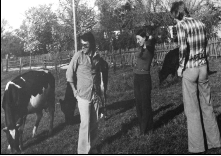
Mülkiye öğrencileri, İnek Bayramı döneminde Köpekköy'ün inekleriyle