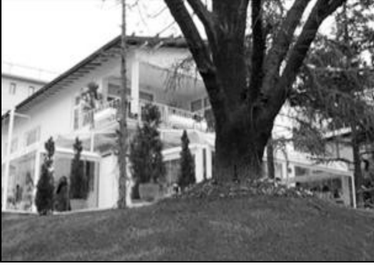
14 Mayıs Evleri'nden dış görünüş (Kaynak: Belli and Boyacıoğlu, 2007: 722, 723)

1952 yılından beri Boğaz Sokak'ta yaşayan N. Erbir, 14 Mayıs Evleri'nin ilk başta Kavaklıdere'nin çehresini değiştirdiğini ve sonraları Arjantin ve Filistin Caddeleri'ndeki kullanımın bu yapıların yeni fonksiyonlarıyla değiştiğini şöyle anlatıyor: