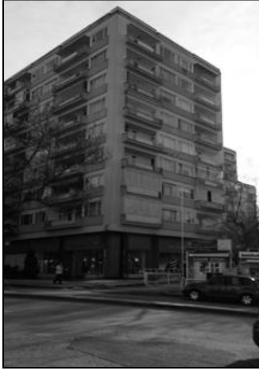
İlbank Apartmanı (Fotoğraf: Çılga Resuloğlu, 2013).

yapının üç sene sonra giriş bölümündeki bazı yerleri kapatılmış ve iş yerlerine kiraya verilmiştir (Çapanoğlu, 2007: 34). 14