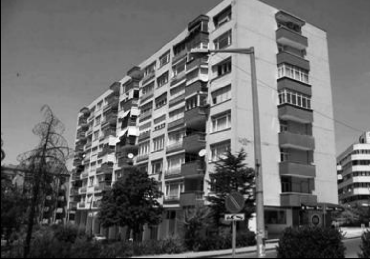
Hayat Apartmanı (Kaynak: Candan, 2010).

çünkü postane vardı, oraya da yürürdük, Özdemir'e de yakındı. Kızılay en çok ilgimizi çekerdi; demin de dediğim gibi, genelde otobüsle giderdik.