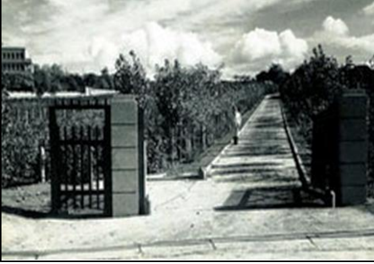
Kavaklıdere Şarap Fabrikası'nın bağlardan oluşan girişi

Bugünkü Tunus Caddesi'nin olduğu yerde akan Kavaklı Dere, semte ismini vermiştir. Kavaklıdere Şarap Fabrikası, bugünkü Sheraton Otelinin olduğu alan ve Kavaklı Dere boyunca yerleşmiş olan kavak ağaçları (populus alba), semtin 1930'ların ortalarına kadar ana silüetini oluşturmuşlardır.