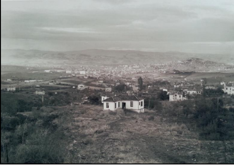
Çankaya sırtlarından Kavaklıdere, Kurtuluş ve Ulus'a bakış (1932)