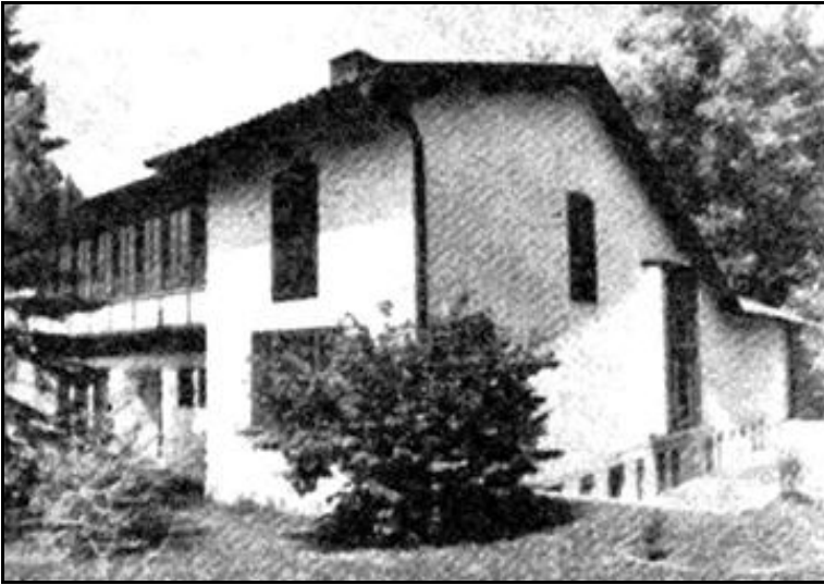
And Evi'nin dış görünüşü

Atatürk Bulvarı'nın güneyinde yer alan Cenap And Evi, semtin önemli konutlardan biridir. Sivil mimari örneği olarak değerlendirilen ve ikinci ulusal mimari akımın özelliklerini taşıyan bu yapı, Emin Halid Onat tarafından 1952 yılında tasarlanmıştır. İki katlı ve yerel malzemelerle yapılmış, geleneksel Türk Evleri'nin özellikleriyle geleneksel Alman Evleri'nin özelliklerini birleştirmiştir (Ankara 1910-2003, 2003: 53). Cenap And Evi, yerel, nostaljik ve modern bir karaktere sahiptir. Kavaklıdere için bir odak noktası olmasının yanı sıra, Ankara'daki mimari yapılar arasında da önemli bir yeri vardır. Etrafıyla uyum içinde olan Cenap And Evi, Tunalı Hilmi Caddesi'nin de Kuşulu Park'la birlikte bitiş/başlangıç noktası olarak işlev görmektedir.