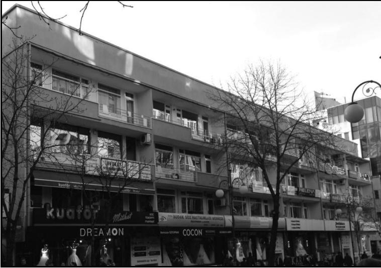
Üniversite Apartmanı (Fotoğraf: Çılga Resuloğlu, 2013)

Üniversite Apartmanı'nda daireler çok büyüktür. O zaman ön taraf iş yerim arka taraf ise evimdi. Arkada iki oda, bir salon ve mutfağın bir kısmını ev olarak kullanıyordum. Önde salonu ikiye böldüm, bir kısmını bekleme yeri yapmıştım. Biz orada bu şekilde 1978 yılına kadar oturduk. Sonra Keneddy'de 1979-1992 yılları arasında oturduk. Esasen bu muhiti sevdiğimiz için taşınmadık. Kavaklıdere'nin böyle bir havası vardır. Bir kere oturmaya, daha doğrusu burada yaşamaya başlarsanız sonra kolay kolay başka muhite alışamıyorsunuz.