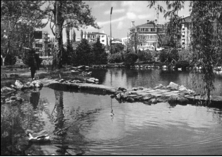
Kuşulu Park'tan bir görünüş (1970'ler)