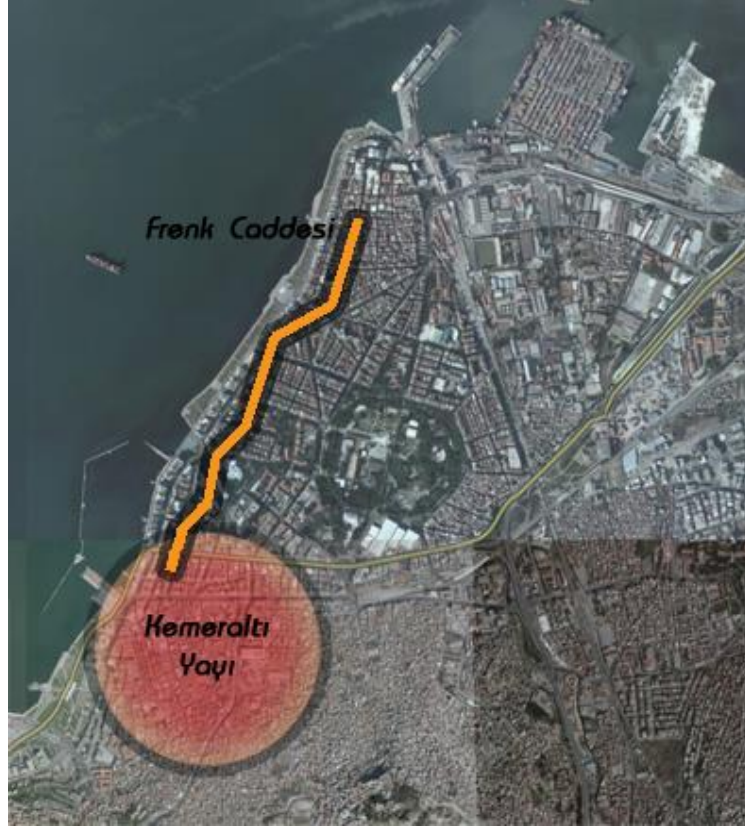
Şekil 2. 19.yy'da İzmir'in ticaret mekânları (Bu harita, Google Earth'den faydalanılarak hazırlanmıştır)

Müslüman mahalleri merkezi iş alanından etkilenmemiş fakat göçen nüfusun sebep olduğu yerleşme ve kaymalarla, alt gelir grupları İkiçeşmelik'ten Eşrefpaşa'ya doğru yayılmış, orta tabaka Namazgah, Tilkilik'in arkaları ve Mezarlıkbaşı'na yerleşmiştir. Müslüman orta ve üst tabakalar, daha sonra şehrin güney yönünde Karantina'ya yerleşmeye başlamışlardır. Karataş ve Karantina'dan, Göztepe ve Kokaryalı