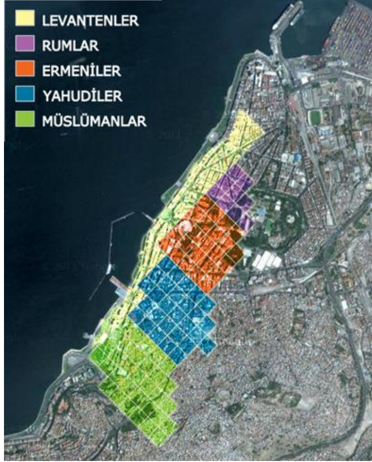
Şekil 1. 19.yy'da İzmir'de etnik mahalleler

Bunun yanı sıra mahallelerin topografyası bile şehrin sömürge karakterini ortaya çıkarmaktadır (Nahum, 2000). Buna göre; Türk Mahallesi Pagos Dağının (Kadifekale) yamaçlarında, sokaklar boyunca düzensiz bir şekilde sıralanmış küçük ahşap evlerden oluşurken, yanında Yahudi Mahallesi uzanmaktadır. Türk Mahalleleri Kemeraltı kavisinin başladığı noktada son bulmaktadır. Museviler, Tilkilik, İkiçeşmelik ve Kemeraltı'nın Havra sokağı civarına yerleşmişlerdir. Tilkilik'in yakınında bugün Basmane Garı, 9 Eylül Meydanı ve kısmen de fuarın yer aldığı kesimde Ermeni Mahallesi bulunmaktadır. Rum Mahallesi ise 19. yüzyılda