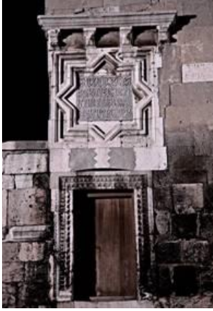
Fotoğraf: 5, Alâeddin Camii kuzey cephesi ve yıldız formu kitabesi.

Seyyid Mahmud Hayran'ın Türbesi'nin kubbe göbeğinde 46 yıldız görülür. Konyadakiler başta olmak üzere daha pek çok Selçuklu eserinde bu yıldız şeması tekrarlanmıştır.