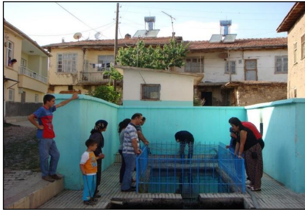
Foto 1. Kutsal Balıklı Göl'den bir görünüm.