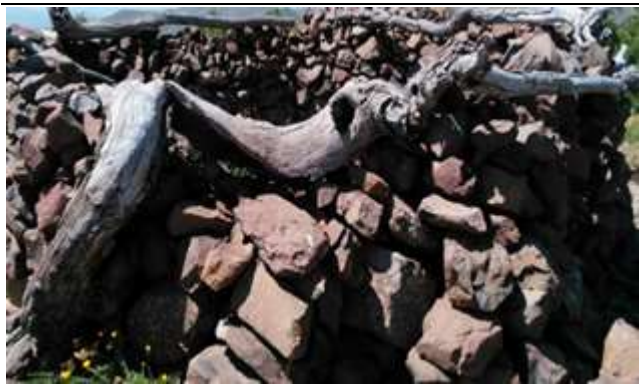
Resim 43. Az Ziyareti Yakınındaki Şifalı Olduğuna İnanılan Su