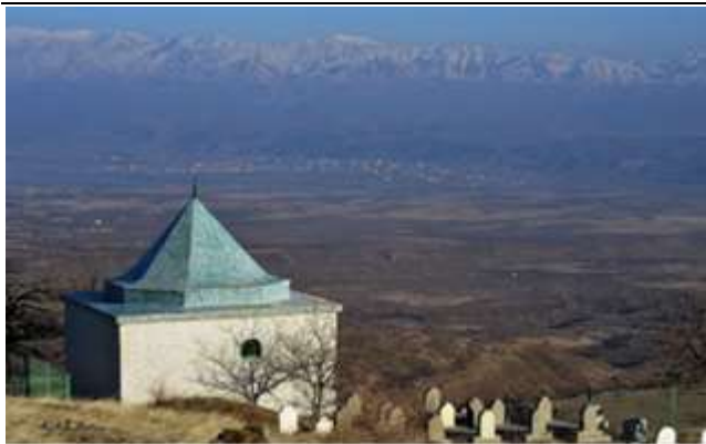
Resim 5. Şeyh Alauddin Türbesinin Dışından Bir Görünüm