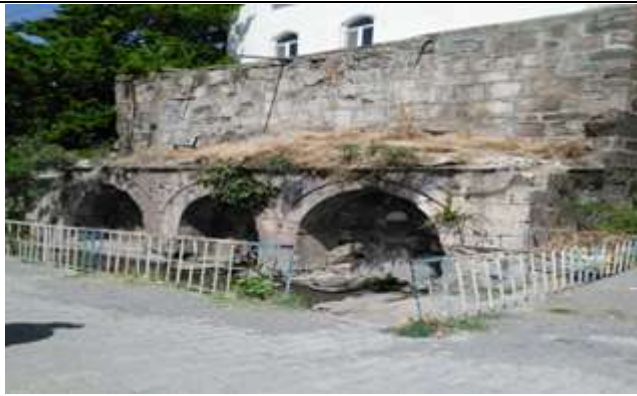
Resim 17. Camiye dönüştürülen Kiliseden Bir Görünüm

Üç evlilik yapan Molla İsmail'in ilk eşinden hiç çocuğu olmamıştır. İlk eşinin vefatından sonra ikinci evliliğini yapan Molla İsmail, 1924 yılında ikinci eşini de kaybedince Erzurum'un Karikum Köyü'nden bir hanımla üçüncü evliliğini yapmıştır. Molla İsmail'in yapmış olduğu bu evliliklerden toplam 9 çocuğu olmuştur. Dördü kız, üçü erkek olan bu çocuklardan yedisi hala hayattadır. 1974 yılında 90 yaşında vefat etmiş olan Molla İsmail, Adaklı'da dedesi ve babasıyla birlikte aynı türbenin içinde medfundur. Molla İsmail ve babası Seyda Molla Osman Efendi yaşadıkları bölgede ahlak ve ilimleriyle halkın sevgisini kazanmışlardır. Yöre halkı, onlara olan sevgilerini sürekli mezarlarını ziyaret edip Yasin-i Şerif okuyarak göstermektedir. 8