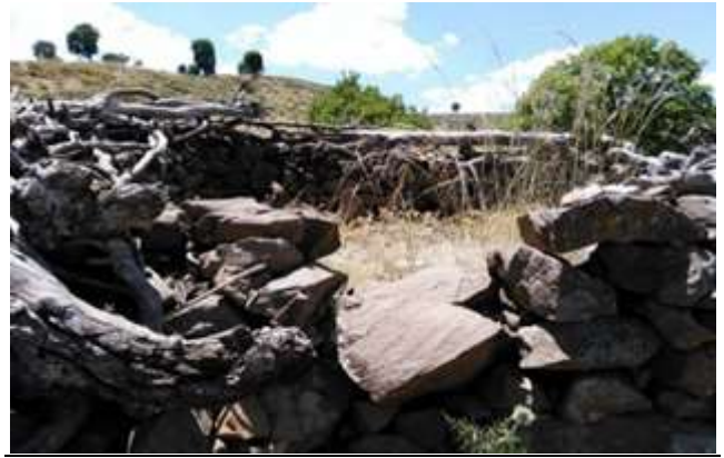
Resim 34. Melik Ahmet Ziyaretinden Bir Görünüm

Melik Ahmet ziyaretinin özellikle kas ve kemik rahatsızlığı olan hastalar için şifalı olduğu söylenmektedir. Rivayetlere göre ayakları tutmayan bir hasta Melik Ahmet'i ziyaret ettikten sonra şifa bulmuş ve yürümeye başlamıştır. Yöre halkı, ziyaret yerinin üstünde üç kez türbe inşa edildiğini ancak her seferinde ertesi gün bu inşa ettikleri türbelerin yıkıldığını aktarmıştır. Etrafı taşlarla çevrili bir mezardan oluşan Melik Ahmet ziyareti, insanlar tarafından sıkça ziyaret edilmektedir. 18