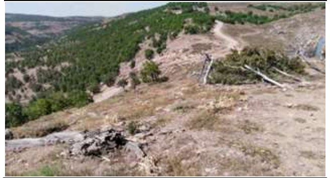
Resim 39. Şehit Asker Ziyaretinin Bulunduğu Tepe

Tepede bulunan bir ağacın, şehidin nişanesi olduğuna inanılmaktadır. Yörede kısmetinin açılmasını isteyenler bu ağaca çaputlar bağlamaktadırlar. Ancak zamanla yaşlanarak yıkılan bu ağaç, şehidin bir nişanesi olarak kabul edilmesinden dolayı odun olarak kullanılmamış ve olduğu yerde bırakılmıştır. 21