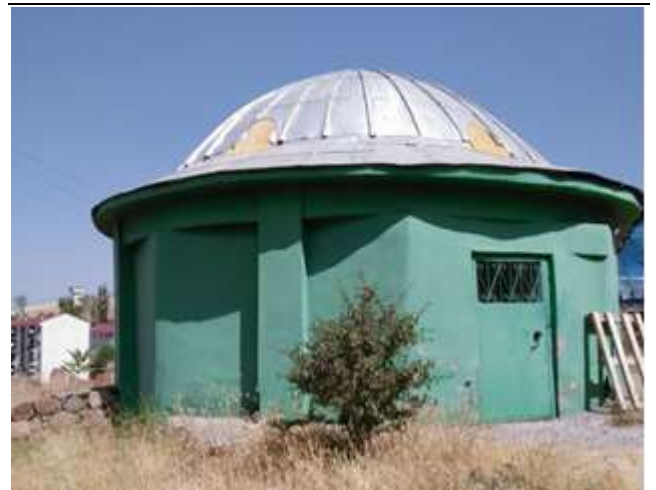
Resim 15. Molla İsmail Türbesinin Dışından Bir Görünüm

Bingöl'ün Adaklı ilçesi merkezinde bulunan türbedir. Molla İsmail'in babası Seyda Molla Osman Efendi, 1914 yılında Osmanlı-Rus harbinden önce Erzurum-Çat bölgesinde Molla Ömer Köyü'nde müderrislik yapmıştır. I. Dünya Savaşı patlak verdiği zaman Ruslar, Erzurum-Kars bölgesini işgal etmiş ve bunun üzerine Molla Osman ailesiyle birlikte Erzurum bölgesinden Adaklı-Kiği bölgesine göç ederek Sefkar Köyü'ne yerleşmiştir. Daha sonra ise buradan da Urfa-Bozova'ya göç ederek burada beş yıl yaşamıştır. Bu göçler sırasında Molla Osman'ın aile üyelerinden bazıları yol şartları ve hastalıklardan dolayı vefat etmiş bazıları da irşat amacıyla farklı bölgelere dağılmışlardır.