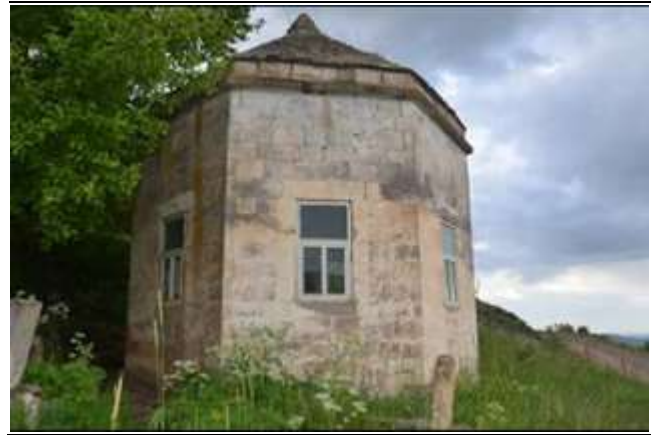
Resim 11. Yusuf-ı Harputî Türbesinin Dışından Bir Görünüm

Bingöl'e bağlı Kiğı ilçesinin Yeldeğirmeni (Zermek) Köyü'nde bulunan türbedir. Yusuf Harputî 19.yy'da Anadolu'da yetişmiş olan evliyalardandır. Babası Muhammed Efendi'dir. Soyunun Hz. Peygamber'e dayandığı söylenir. Bölgede, "Şeyh Yusuf Harputî" ve "Hacı Yusuf Harputî" adıyla tanınmıştır. Yusuf-ı Harputî, 1822 yılında Erzurum'a, bugün ise Bingöl iline bağlı olan Kiğı ilçesinin Yeldeğirmeni (Zermek) Köyü'nde dünyaya gelmiştir.