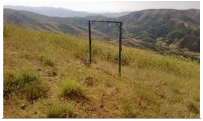
Resim 38. Karer Baba Ziyareti Kurban Kesim Yeri

Karer Baba ziyaretinden getirilen taş ve ağaç parçaları yörede ikamet eden Alevi Zazaları tarafından teberrük olarak kabul etmektedirler. Özellikle her hafta cuma akşamları eve getirilen bu teberrüklerin bulunduğu yer aydınlatılmakta ve teberrükler özel bir torba içerisinde evin bir köşesinde saklanmaktadır. Teberrükler hasta olan kişinin başına asıldığında o kişinin şifa bulacağına inanılmaktadır. Perşembe günleri adağı olan kişiler bu ziyarete gelerek kurban kesmektedirler. Yörede bir kimseden kötülük gören kişi, birisine beddua edeceği zaman; “Ya Allah, ya Karir Baba sen bunun cezasını ver” şeklinde beddua etmektedir. 20