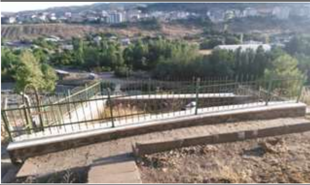
Resim 50. Seyda Efendi Ziyaretinin Dışından Bir Görünüm

Seyda Efendi'nin metfun bulunduğu yer, önceki yıllarda taşlarla çevrili iken son yıllarda halk tarafından mezarı beton duvarlar ve demir parmaklıklarla çevrilmiştir. Mezar taşı onarılmıştır. Mezarı sıklıkla ziyaret edilmektedir. Teberrük olarak mezarına şeker veya çeşitli yiyecekler götürülmekte ve bunlar şifa niyetiyle insanlara dağıtılmaktadır. 27