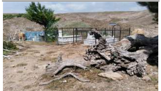
Resim 40. Şehit Asker Ziyaretinin Nişanesi Yıkılan Ağaç

Tepede bulunan bir ağacın, şehidin nişanesi olduğuna inanılmaktadır. Yörede kısmetinin açılmasını isteyenler bu ağaca çaputlar bağlamaktadırlar. Ancak zamanla yaşlanarak yıkılan bu ağaç, şehidin bir nişanesi olarak kabul edilmesinden dolayı odun olarak kullanılmamış ve olduğu yerde bırakılmıştır. 21