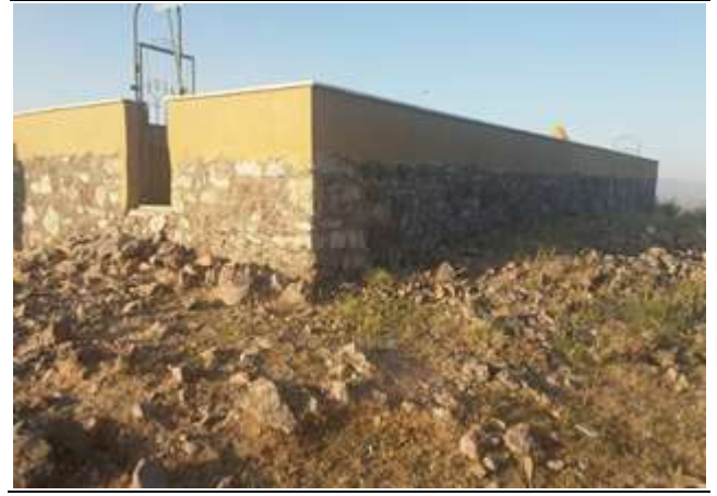
Resim 31. Kara Baba Ziyareti İçinde Bulunan Dört Mezar