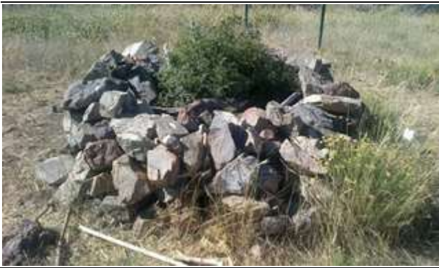
Resim 37. Karer Baba Ziyaretinden Bir Görünüm

Karer Baba ziyaretinden getirilen taş ve ağaç parçaları yörede ikamet eden Alevi Zazaları tarafından teberrük olarak kabul etmektedirler. Özellikle her hafta cuma akşamları eve getirilen bu teberrüklerin bulunduğu yer aydınlatılmakta ve teberrükler özel bir torba içerisinde evin bir köşesinde saklanmaktadır. Teberrükler hasta olan kişinin başına asıldığında o kişinin şifa bulacağına inanılmaktadır. Perşembe günleri adağı olan kişiler bu ziyarete gelerek kurban kesmektedirler. Yörede bir kimseden kötülük gören kişi, birisine beddua edeceği zaman; “Ya Allah, ya Karir Baba sen bunun cezasını ver” şeklinde beddua etmektedir. 20