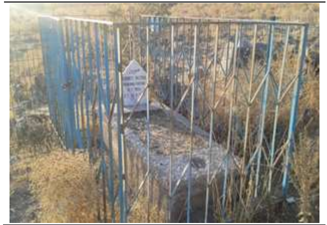
Resim 49. Kudret Buzrul Ziyaretinden Alınan Şifalı Taşlar