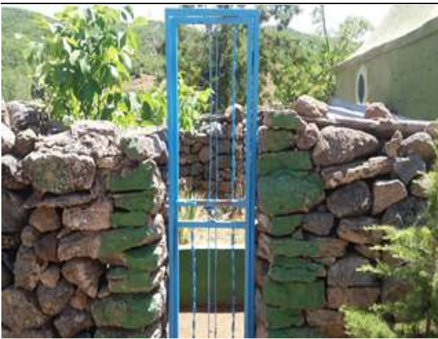
Resim 47. Şehit Kumandan Halit'in Mezarından Bir Görünüm