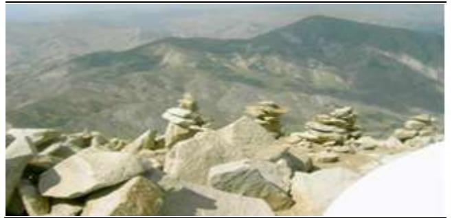
Resim 44. Sülbüs Dağı Ziyaretinde Dilek Taşları

Halk arasındaki bir inanca göre Sülbüs, Hz. Hızır'ın mekânıdır. İnsanlar onun beyaz bir atın üstünde yıldırım hızıyla zor durumda kalanların yardımına geldiğine inanılmaktadır. Yörede yaşayan insanlar hasret ve dertlerinin son bulması için Sülbüs dağında Hızır'ından yardım istemektedirler. Sünni, Alevi ve Hristiyan inancına sahip olan insanlar Sülbüs'ü ziyaret ederler ve dağın başında mum yakarak, ip bağlayarak ya da taş dikerek dilekte bulunurlar. Eskiden kurbanlar, Sülbüs'ün zirvesinde kesilmekte iken son