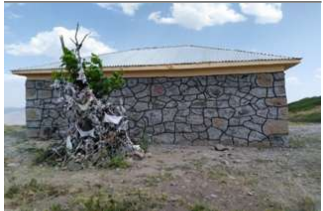
Resim 24. Şeker Baba Türbesinde Bulunan Dilek Ağacı

Çocuk sahibi olmak isteyip çocuğu olmayanlar Şeker Baba'ya gelerek dua etmekte, türbede bulunan ve kutsal kabul edilen dilek ağacına beşiği andıran bez veya tülbent bağlamaktadırlar. Adağı olan kişiler haftanın perşembe günleri Şeker Baba'yı ziyaret ederek kurbanlarını burada kesmektedirler. Şeker Baba'dan alınan taşlar teberrük (kutsal) sayılmaktadır. Ayrıca halk teberrük olması için ziyarete giderken yanında şeker götürmekte ve bu şekerleri şifa niyetiyle çocuklara dağıtmaktadırlar. 11