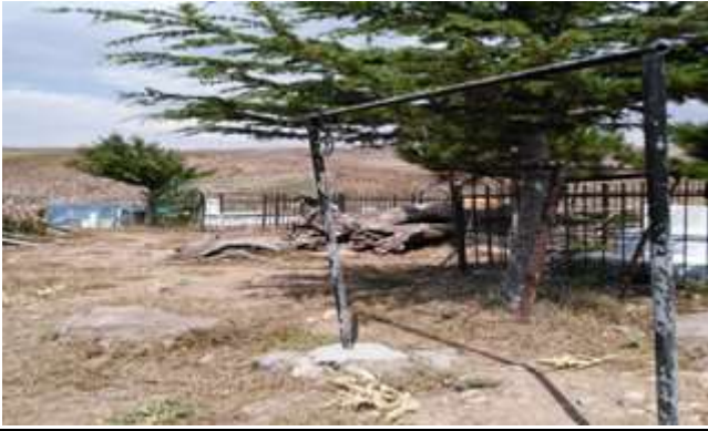
Resim 41. Şehit Asker Ziyareti Kurban Kesim Yeri

Her cuma gecesi bu ziyaretin bulunduğu tepede bir ışığın sabaha kadar yandığı belirtilmektedir. Köy halkının anlattığına göre; Cumhuriyetin yeni ilan edildiği yıllarda bölgeye gönderilen bir tabur asker bir gece bu tepedeki ışığı görmüş ve bu ışığın düşman askerleri tarafından yakıldığını sanarak gece boyunca bu tepeye ateş açmışlardır. Ancak sabah olduğunda tepeye çıktıklarında tepede ne bir insan, ne de bir kurşun kovana bulmuşlardır. Tabur komutanı köylülerden orada bir şehidin yattığını öğrenince hemen yaptığından pişman olmuş ve tepede bir kurban kesmiştir. İşte o günden beri adağı olanlar, bu ziyaret yerinde kurbanlarını kesmektedirler. 22