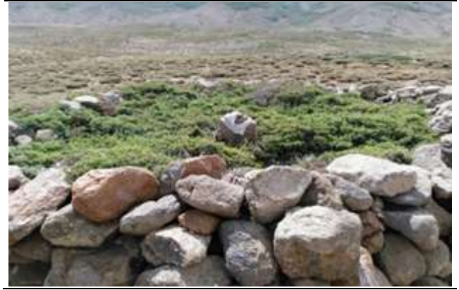
Resim 36. Şehidê Deştê Ziyaretinde Bulunan Kurban Kesim Yeri