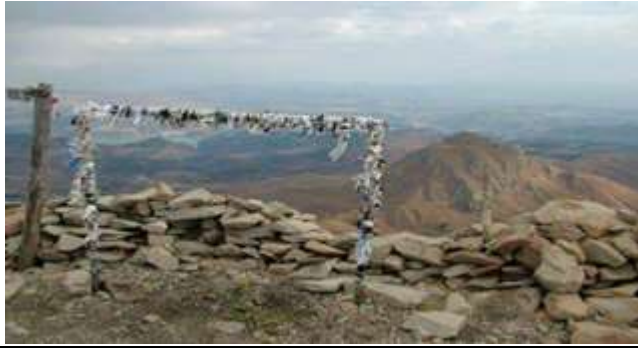
Resim 45. Sülbüs Dağı Ziyaretindeki Dilek İçin Bağlanan Çaputlar

Halk arasında anlatılan başka bir efsaneye göre ise; Sülbüs ve Tari dağları birbirine kırgın iki kardeşler. Bölge, düşmanlar tarafından ele geçirilmek istendiğinde Sülbüs'ten düşman askerleri üzerine atılan top sesleri duyulmuş. Sülbüs düşmana saldırırken kardeşi Tari, Sülbüs'e yardım etmez. Bu yüzden de Sülbüs'ün bedduasına uğrar. Bu beddua sebebiyle Tari'nin zirvesi bir gün darmadağın olur. Bu yüzden Tari Dağı'nın tepesi zirveden daha çok düzlüğü andırmaktadır. Sülbüs'ün doruğuna üç kez çıkan insanların manevi olarak görevlerini yerine getirdiklerine inanılmaktadır. Sülbüs dağı ayrıca dağcılar tarafından da sıklıkla ziyaret edilen bir dağdır (Conag, 2017).